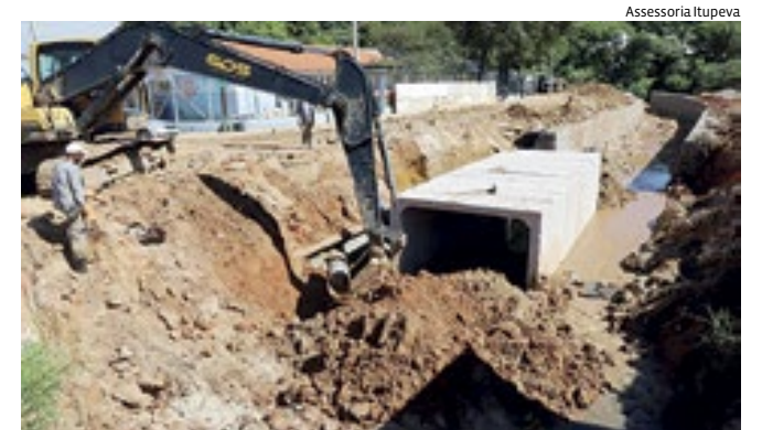
Prefeitura de Itupeva iniciou o assentamento de aduelas

As obras do Córrego Piracatu, que foram reiniciadas pela Prefeitura de Itupeva há cerca de dois meses, entraram em nova fase. Além do avanço na construção do muro de gabião (estrutura armada, flexível, drenante e de grande durabilidade e resistência), foi iniciado o assentamento das aduelas, localizadas entre a Avenida Ulysses Guimarães e a Rua Felício Falco. De acordo com a secretaria de Obras e Planejamento Urbano, a obra já avançou 20% desde o seu início.