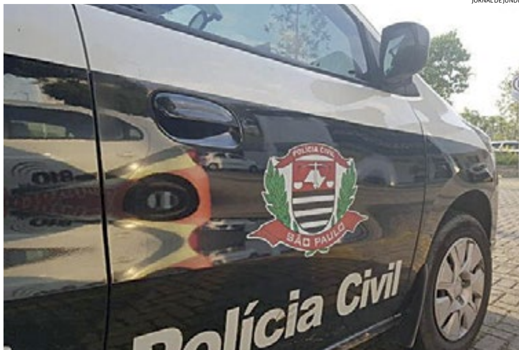
Os policiais apreenderam notebook e outros aparelhos, que serão periciados

De acordo com a investigadora-chefe Vanessa, as prisões ocorreram após investigações, decorrentes de denúncias. "Hoje nós do 1º DP de Jundiaí, após investigações, prendemos em flagrante dois homens e uma mulher que agenciam modelos mirins para trabalhos de publicidade para diversas empresas. As vítimas vieram até a delegacia para fazer boletins de ocorrência de estelionato, uma vez que levaram seus filhos para tirarem fotos e assinarem contratos com promessas de prestarem serviços de modelos para diversas empresas", disse.