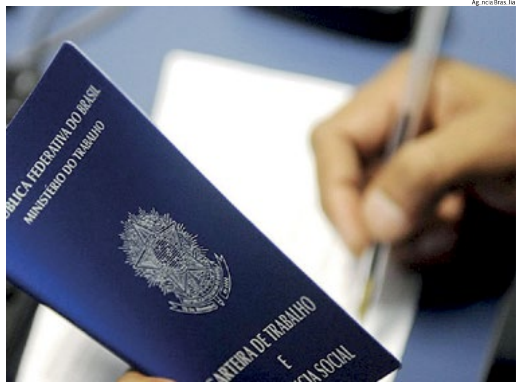
Jundiaí tem 179.581 trabalhadores com carteira assinada, o que equivale a 40,5% da população da cidade

De acordo com o Cadastro Geral de Empregados e Desempregados (Caged), do