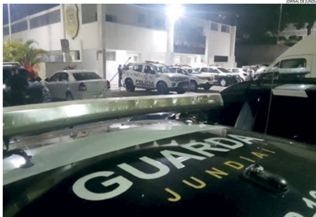
Os Gms conseguiram deter um suspeito, que foi levado ao Plantão, onde foi preso