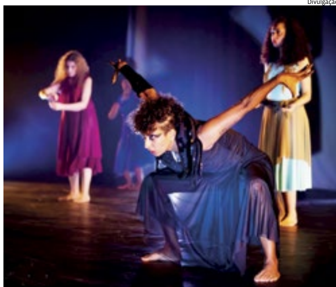
Sala Glória Rocha fica no Centro das Artes Prefeito Pedro Fávaro

Os ingressos gratuitos para o espetáculo estarão disponíveis a partir das 10h30 deste sábado (20), tanto na bilheteria do Centro das Artes, quanto na internet, por meio da plataforma Sympyla. Já na bilheteria do Teatro Polytheama, a distribuição é a partir das 15h. Cada interessado poderá retirar até dois ingressos.