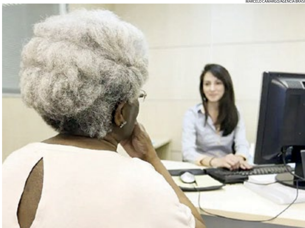
Em Jundiaí, entre os beneficiários do INSS, há aposentados por idade, tempo de contribuição e invalidez