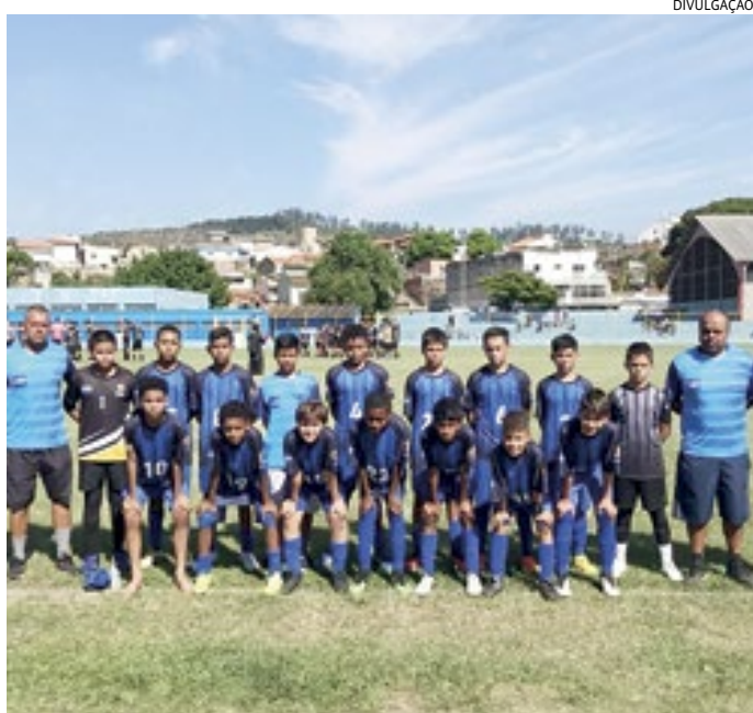
A equipe sub-13 venceu o Corinthians nos pênaltis e foi campeão