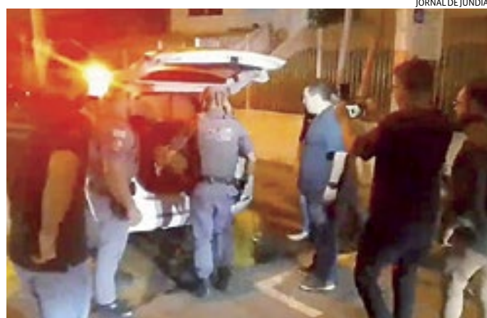
O momento em que o suspeito preso pela PM chega na DIG