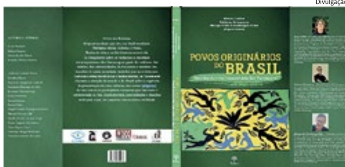
O livro será lançado nesta sexta-feira (19) na Unicamp

amarela nos últimos quatro anos. Em meio a esta tragédia anunciada, um grupo de professores e alunos da disciplina "Linguagem, Jornalismo, Ciência e Tecnologia", do Programa de Mestrado em Divulgação Científica e Cultural do Laboratório de Estudos Avançados em Jornalismo (LabJor), da Universidade Estadual de Campinas (Unicamp), resolveram estudar os Yanomami, para tecer, em uma construção coletiva, um perfil da trajetória desse grupo étnico, suas conquistas, características culturais e dificuldades, esse estudo acabou dando origem ao livro "Povos originários do Brasil: sentidos da crise humanitária dos Yanomami".