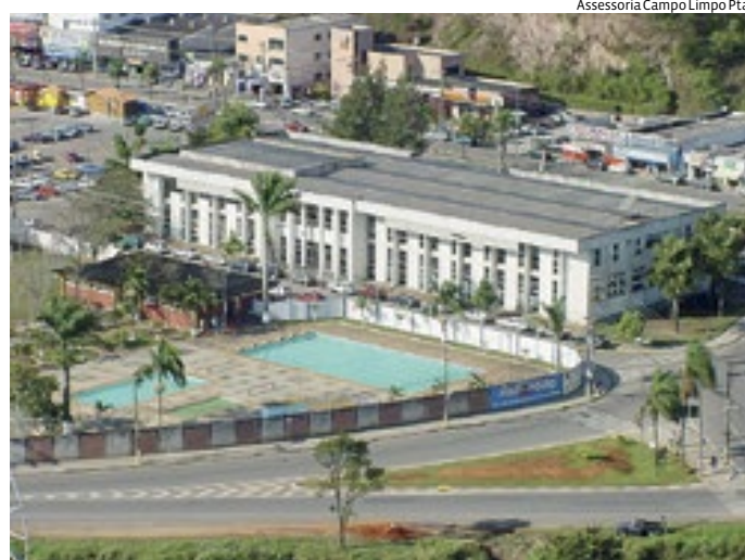
A audiência conta com transmissão ao vivo pelo Youtube

A deputada federal Dayany Bittencourt (União Brasil - CE) denunciou a existência de quatro câmeras e um microfone escondidos no apartamento onde ela morava na Asa Norte, em Brasília. Os equipamentos foram encontrados em 28 de agosto de 2023 e a investigação corria em segredo de justiça até a última semana. A deputada federal Dayany Bittencourt (União Brasil - CE) denunciou a existência de quatro câmeras e um microfone escondidos no apartamento onde ela morava na Asa Norte, em Brasília. Os equipamentos foram encontrados em 28