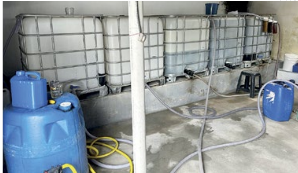
A fábrica clandestina vinha funcionando em uma casa no bairro Cecap, em Jundiaí