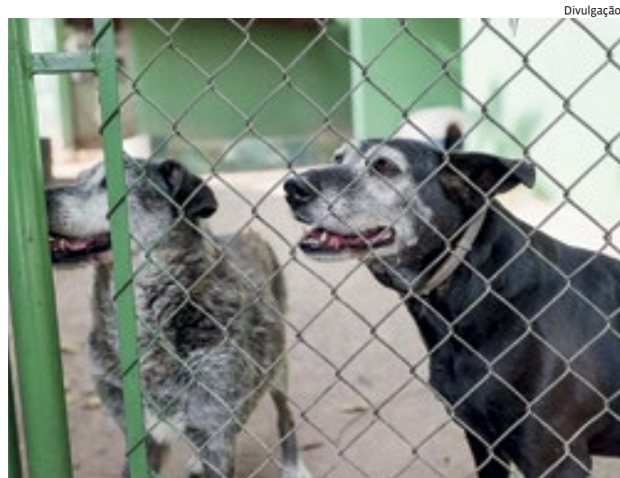
As novas instalações do DEBEA ficam próximas à atual sede