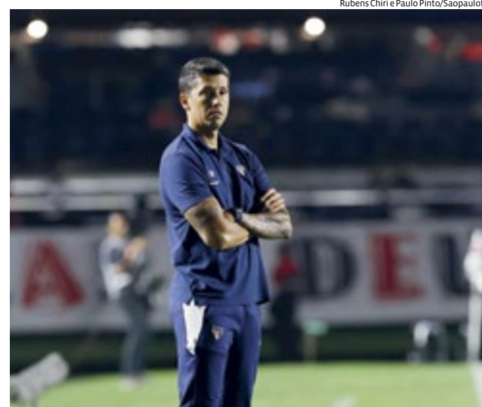
O treinador vai receber R$ 1,2 milhão pelo encerramento do contrato

A pressão aumentou sobretudo após a derrota para o Talleres, da Argentina.