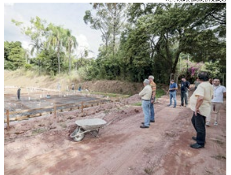
As novas instalações ficam em um terreno no bairro Chácara São Francisco