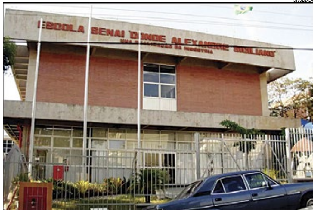
O Senai se pronunciou alegando que está à disposição da Polícia para ajudar nas investigações

A vítima foi ao Plantão Policial na noite de quinta-feira para denunciar o furto ocorrido pela manhã. Se-