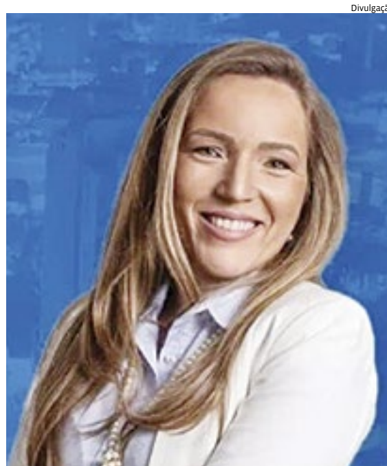
Dayane Martins é pré-candidata pelo Partido da Social Democracia Brasileira (PSDB) para as eleições 2024