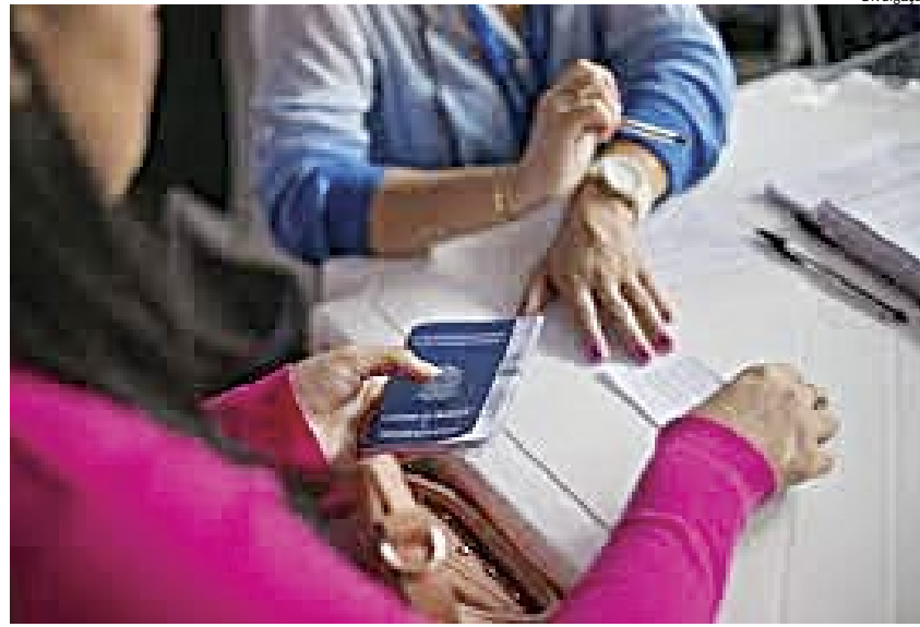
A contratação de aprendizes poderia ser maior de acordo com a capacidade das empresas

Ela lembra que a aprendizagem permite aos jovens conciliar o trabalho com a escola. “O programa de aprendizagem é a porta de entrada para que a pessoa adquira experiência e veja se aquilo vai de encontro com o que ela deseja para a carreira. Auxiliar administrativo e auxiliar de comércio e varejo, por exemplo, tem acesso a uma fatia do setor de uma empresa, mas acaba conhecendo tudo o que a área pode oferecer e pode se interessar por outros setores,