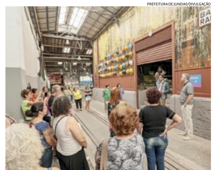
Grupo inicial visitou o Espaço Expressa e conheceu história do local