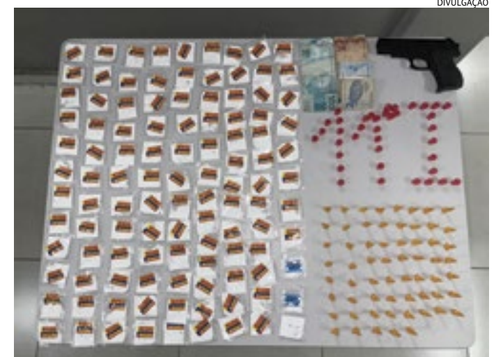
As drogas foram apreendidas, mas os suspeitos acabaram liberados

Questionado se sua esposa ainda estava envolvida com tráfico de drogas, ele alegou que não mais, porque está grávida e deixou a vida de crime, o que ela também alegou. Per-