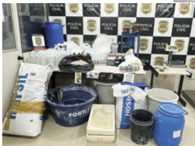
Local era usado para armazenar drogas e outros insumos

O endereço já era monitorado pelos policiais, que tinham informações sobre a movimentação suspeita no imóvel. Em janeiro deste ano, em uma apreensão de mais de 200 quilos de cocaína na zona sul de São Paulo, os investigadores encontraram registros indicando a localização da "casa cofre", no interior paulista, onde possivelmente parte da droga era armazenada até o transporte final. Com o avançar da apuração, a Polícia Civil pediu à Justiça o cumprimento de busca e