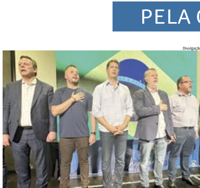
Cerimônia de posse da presidência do Partido Liberal Jovem

O deputado federal Chiquinho Brazão (sem partido-RJ) usou quase R$ 14 mil da cota parlamentar em fevereiro de 2024 para divulgar um projeto que propõe combater a violência contra a mulher e prevenir o feminicídio. Brazão foi preso neste domingo (24) acusado de mandar matar a vereadora Marielle Franco (PSOL-RJ). Ela foi vítima de feminicídio político em 2018. Três anos depois, em 2021, o deputado protocolou o projeto na Câmara dos Deputados. Segundo a Polícia Federal, a morte de Marielle foi idealizada pelos irmãos Domingos e