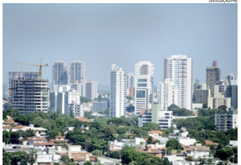
A expectativa é de que os lançamentos do mercado superem os do ano passado