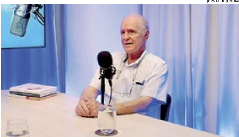
Médico falou sobre amor à rotina de curar crianças e sua história de vida