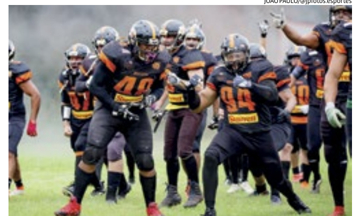
Com o resultado, o Ocelots soma uma vitória e uma derrota no campeonato

A próxima partida em casa será no dia 21 de abril, às 14h, contra a equipe do Guarani Indians, na Arena Jagatirica, localizada na avenida Santo Ceolin, nº 1450 - Bairro dos Fernandes. Os ingressos já estão disponíveis para venda on-line, pelo link: www.bit.ly/ingressoocelots , e custam R$ 17,50.