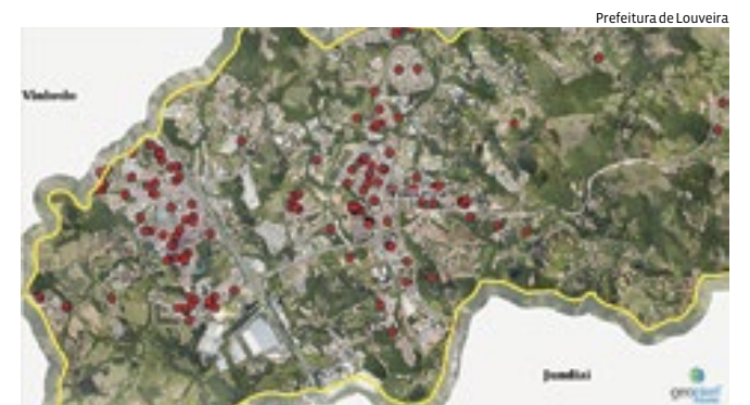
Objetivo é facilitar o monitoramento epidemiológico

A partir de agora, Louveira conta com mapa online com as regiões onde foram confirmados casos de dengue. O objetivo é facilitar o monitoramento epidemiológico com transparência com a população. A Secretaria de Saúde ressalta a importância de realizar os cuidados em casa. Em combate às arboviroses como a dengue, a equipe da Vigilância em Saúde realiza ações estratégicas em diferentes frentes, contando com visitas periódicas em imóveis residenciais e comerciais para orientações quanto aos sintomas, bem como medidas de prevenção e controle de criadouros de mosquitos, vistoria em pontos de atenção e aplicação de larvicidas em recipientes que não podem ser removidos. A prefeitura também utiliza um drone para vistoriar locais que apresentam dificuldade de acesso para a equipe da Vigilância em Saúde. Identificada alguma irregularidade como ponto de criadouro de mosquito, a equipe age para eliminar e evitar a proliferação.