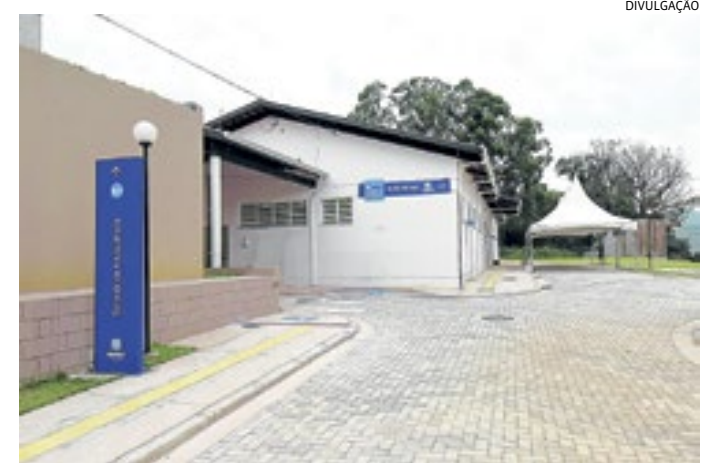
Das 8h às 17h, a população poderá se dirigir à Nova UBS Jardim do Lago