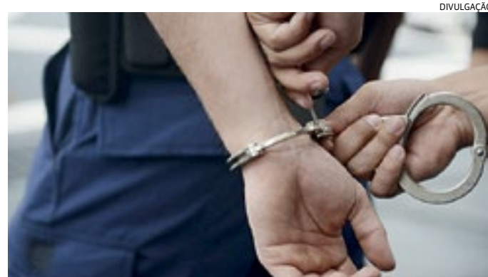
O suspeito foi solto pelo juiz para responder pelo crime em liberdade

Durante a audiência, o juiz entendeu que a prisão em flagrante foi feita de forma legal, mas que não cabia a conversão em preventiva. "Por outro lado, entendo não ser o caso de manutenção da custódia cautelar. Observo que o preso praticou, em tese, crime sem violência e/ou cuja pena, a princípio, não impõe necessariamente o regime fechado, não estando preenchidos, por ora, os requisitos para a prisão cautelar. Ademais, houve pedido do Ministério Público pela soltura, sendo vedada a prisão cautelar de ofício. Pelo exposto, concedo liberdade provisória ao preso, a qual, em substituição à prisão, deverá comparecer a todos os atos do processo, mantendo seu endereço atualizado, bem como comparecimento bimestral em Juízo. Não cumprida tal condição, nova prisão preventiva poderá ser decretada".