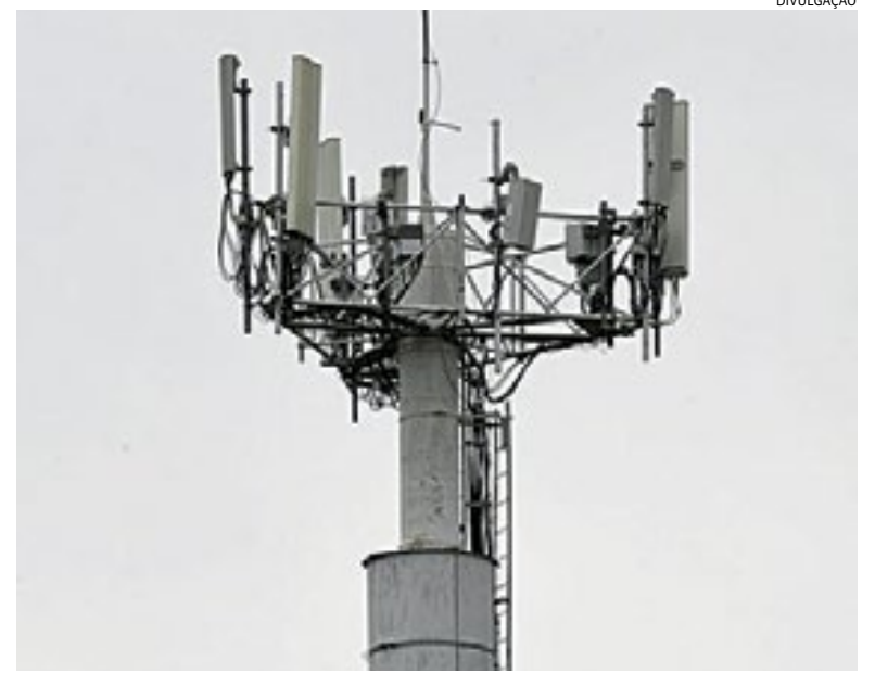
Distribuição das torres pelo território de Jundiaí ainda não é homogênea