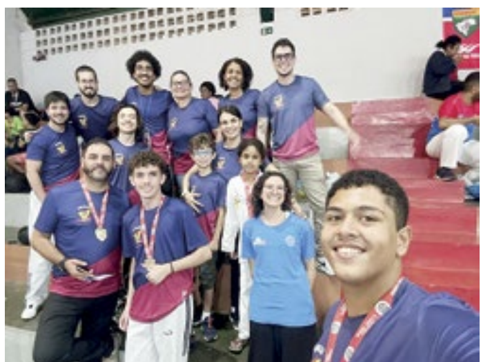
Os jundiaienses tiveram ótimo desempenho em casa