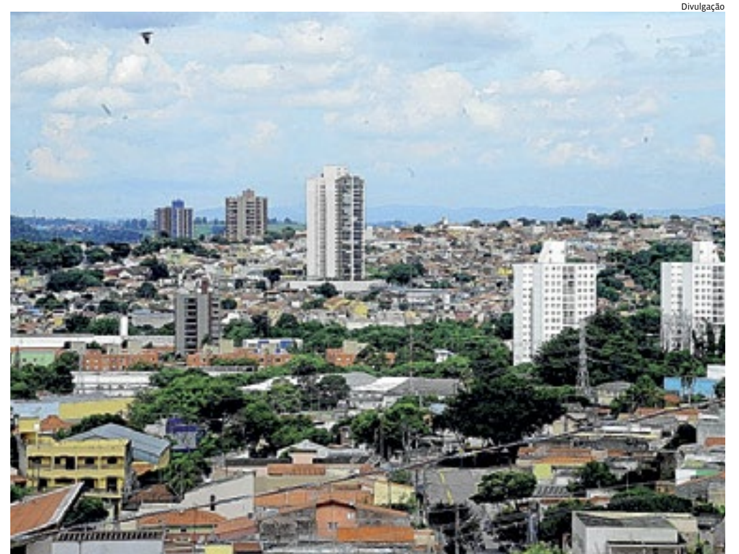
Em Jundiaí, demanda supera oferta e novo Minha Casa, Minha Vida também tende a atender público repressado