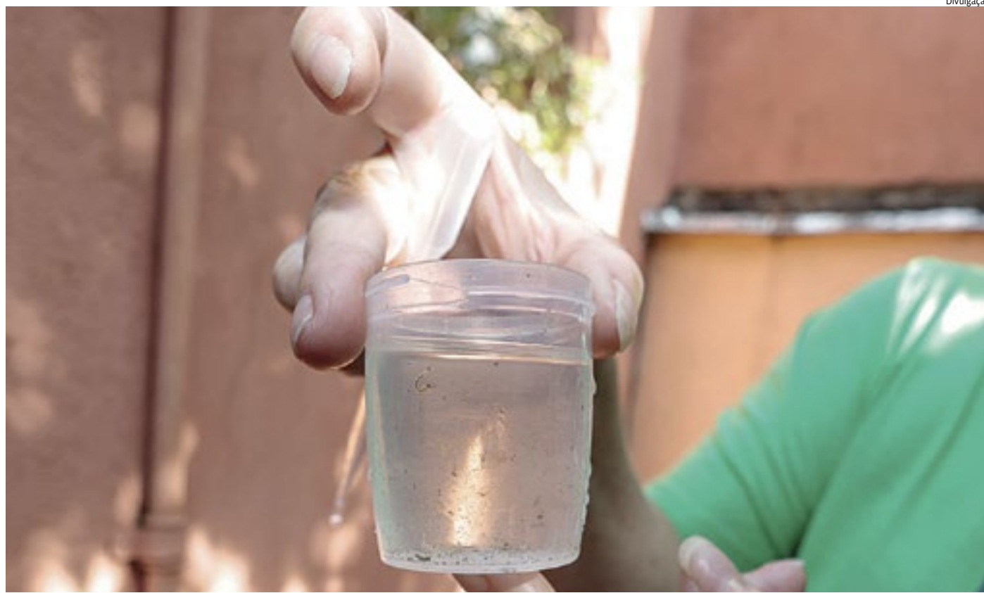
Em toda a cidade, desde o ano passado, houve reforço nas ações de prevenção e enfrentamento da dengue e das demais arboviroses

Os principais sintomas da dengue são: febre, dor de cabeça, dores no corpo e articulações, manchas na pele, dor nos olhos, fraqueza e vômito. Já os sinais de alarme que indicam uma evolução potencialmente mais grave são: dor abdominal intensa; náuseas; vômitos persistentes e sangramento de mucosas.