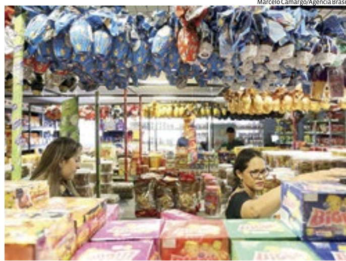
A coleta dos preços da pesquisa foi feita entre os dias 7 e 8 de março

O objetivo da pesquisa é oferecer uma referência ao consumidor através dos preços médios obtidos dentro da amostra pesquisada. Os resultados do levantamento não podem ser utilizados para fins publicitários. As variações de preços constatadas referem-se ao período em que foi realizada a coleta,