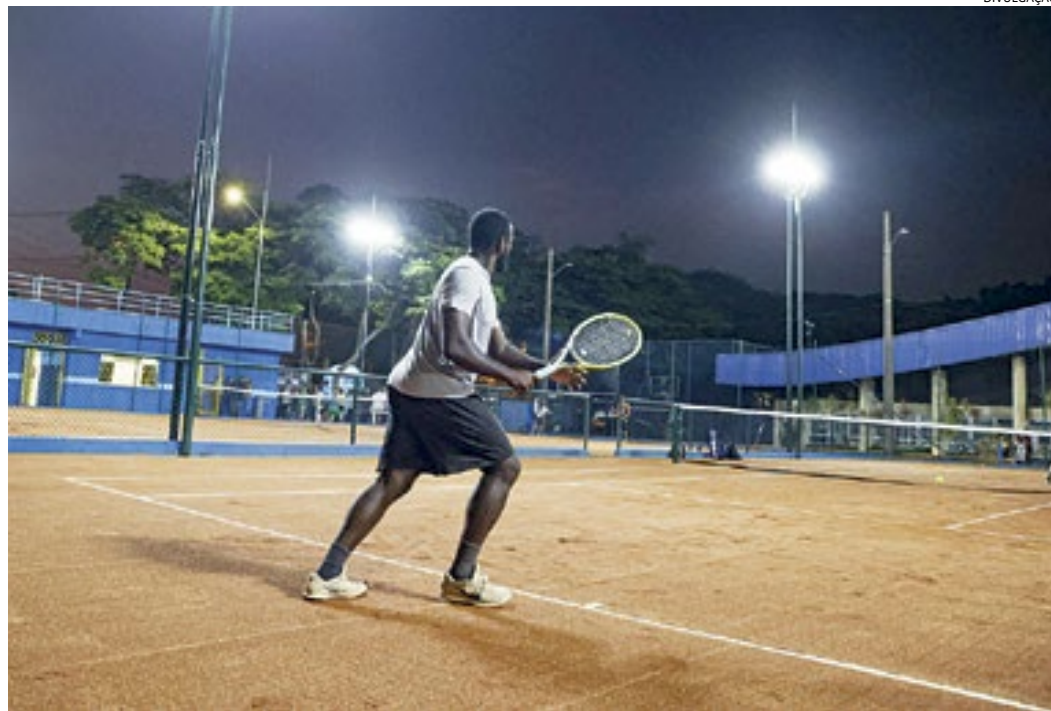
Com a reforma, o local voltou às condições para receber jogos e torneios oficiais

Outras ações no local foram três rampas com corrimão para acesso de cadeirantes, alterações no paisagismo e ainda drenagem para captação de toda a água da quadra, além da pintura e colocação de lixeiras em toda a área. A área da administração também recebeu revitalização, com pintura.