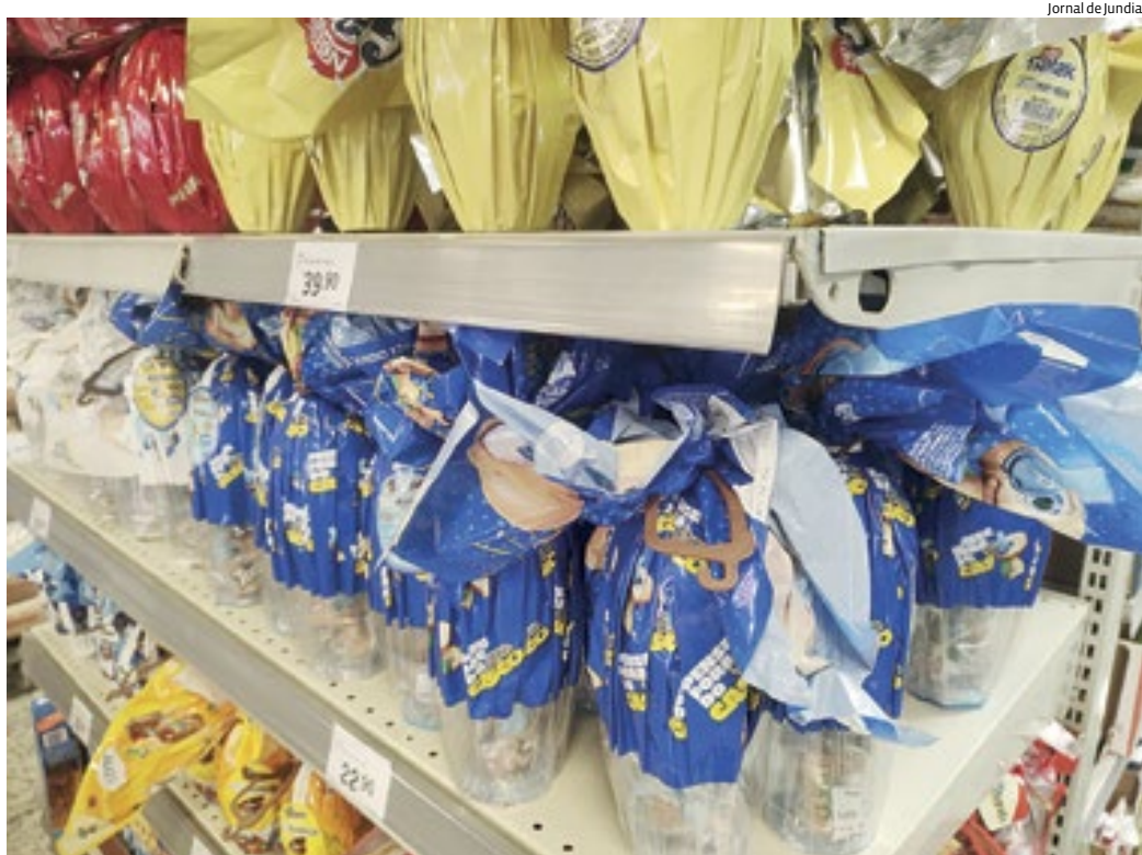
Pesquisa de preços feita pelo Procon Jundiaí identifica variação de preços; dica é pesquisar