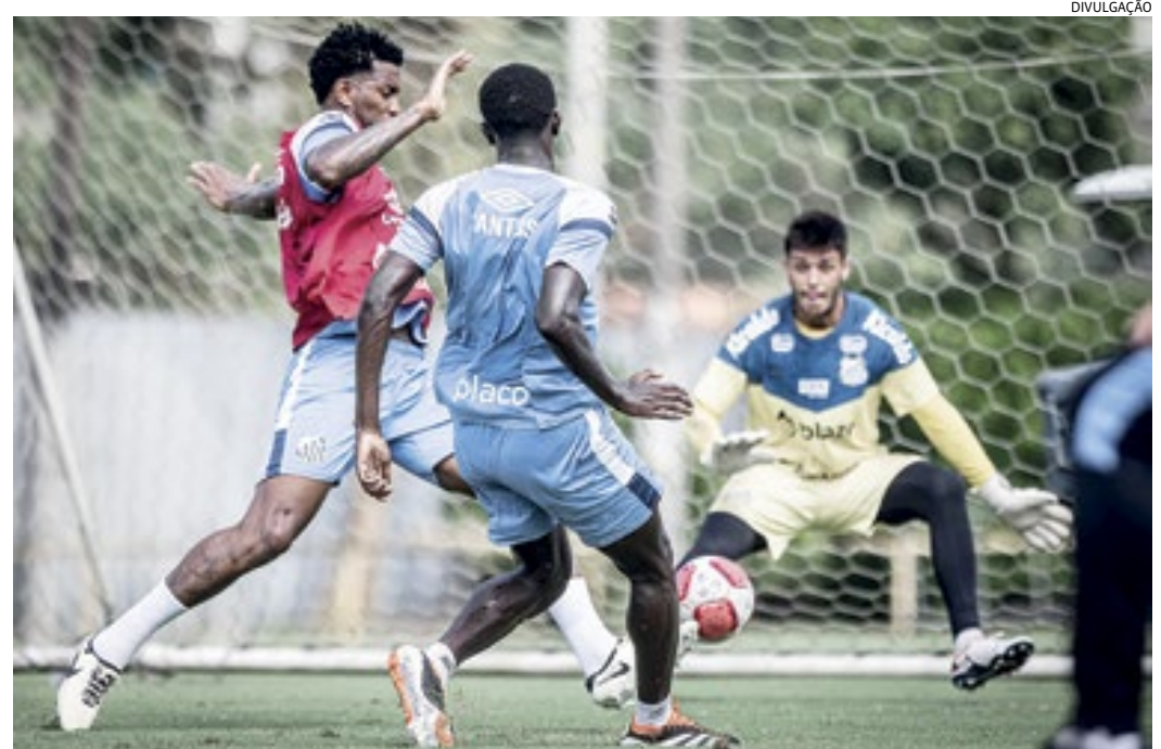
O Santos chegou à semifinal após passar pela Portuguesa nos pênaltis; Bragantino passou após golpear a Inter