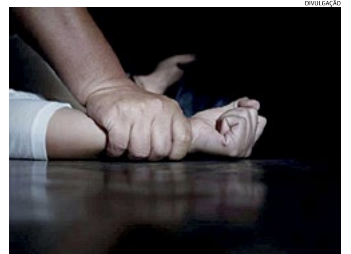
É a primeira queda desse tipo de crime registrada em sete meses

Na cidade de São Paulo, os casos passaram de