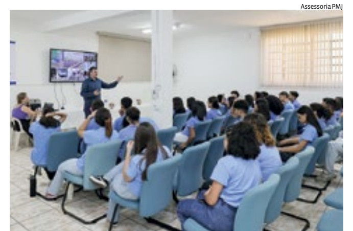
Representantes da prefeitura falam sobre Mobilidade Urbana

A Associação de Educação Homem de Amanhã, conhecida como “Guardinha”, entidade dirigida por membros do Rotary Club Jundiaí, tem a formação social como uma das bases para as atividades desenvolvidas com os jovens que participam dos programas oferecidos. Com esse viés, a mobilidade urbana é tema de uma série de encontros entre representantes da Prefeitura de Jundiaí, por meio da Unidade de Gestão de Mobilidade e Transporte (UGMT) com os estudantes, para apresentação do Plano de Mobilidade municipal e construção conjunta de propostas para a melhoria do trânsito e transporte na cidade.