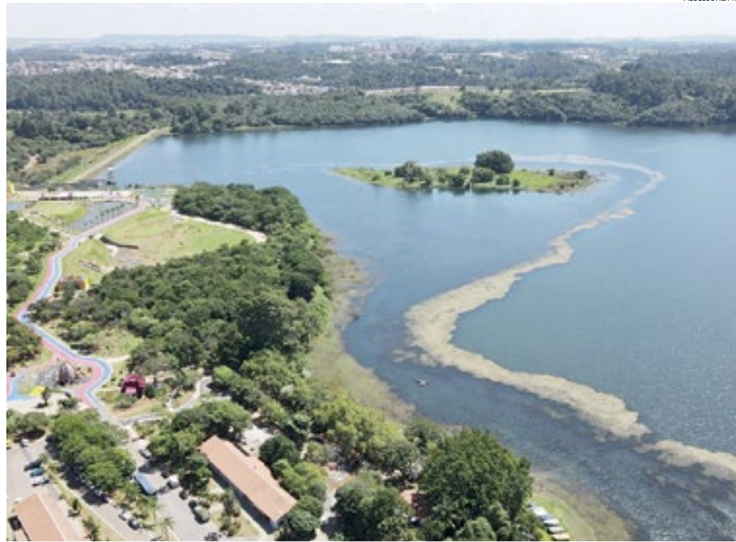
Ranking utiliza dados sobre Saneamento de 2022: 99,63% da cidade é atendida por redes de água

Jundiaí também está entre as dez melhores do Brasil em tratamento do esgoto – 100% do que é coletado passa por tratamento e retorna limpo à natureza. “Subimos 13 posições do ranking anterior para o