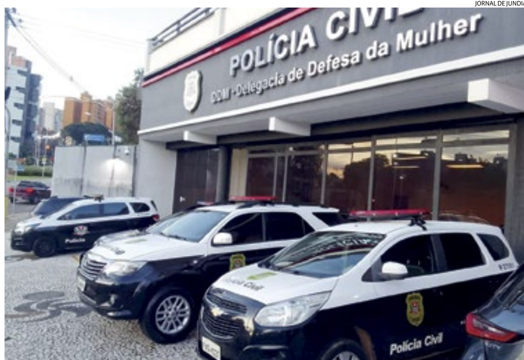
Ele foi levado para a DDM e posteriormente ficou à disposição da Justiça

A legislação atual prevê a saída temporária, conhecida como “saidinha”, para condenados no regime semiaberto. Eles podem deixar a prisão cinco vezes ao ano para visitar a família em feriados, estudar fora ou participar de atividades de ressocialização.