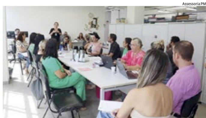
Reunião realizada na última quarta-feira (20) com o FUNDEB