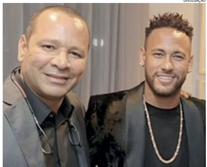
O empresário desmentiu as informações sobre o pagamento da fiança