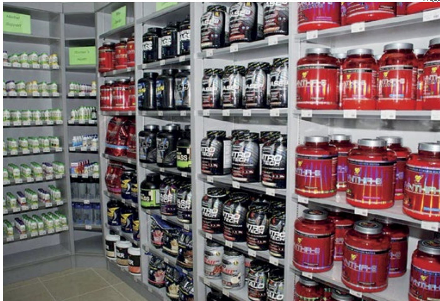
Em Jundiaí, aumento nas vendas é significativo, no entanto, é importante ter acompanhamento, pois suplementos não são milagrosos

Vendedora de uma loja de suplementos em Várzea Paulista há quase quatro