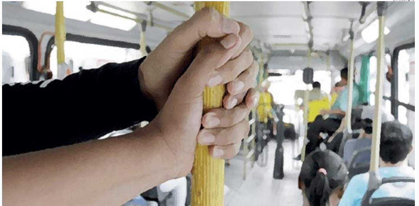
O crime, segundo as vítimas, ocorreu dentro do ônibus; um suspeito foi detido e depois liberado na delegacia

Em revista pessoal, nada de ilícito foi encontrado.