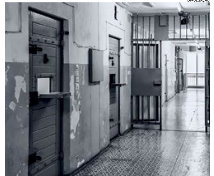
Projeto pelo fim da saidinha de criminosos foi aprovado em votação