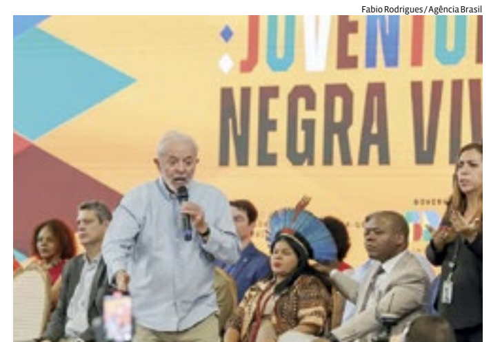
Lula assinou decreto que institui o Plano Juventude Negra Viva

O presidente destacou ainda a importância da divulgação do plano lançado ontem para que ele cumpra com seu objetivo e cobrou que seus ministros atuem nessa comunicação. “Todo mundo aqui tem a obrigação de colocar o Plano Juventude Negra