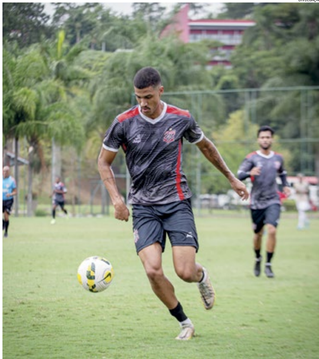
A competição tem início previsto para 20 de abril e a data da final em 29 de setembro

A FPF dividiu os grupos da 5ª Divisão e definiu o modelo de disputa do torneio, que contará com