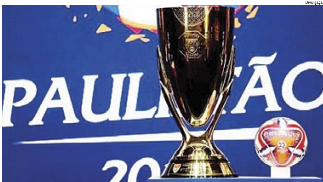
Além de São Paulo e Santos, o Red Bull Bragantino joga com a Inter de Limeira, em Bragança Paulista