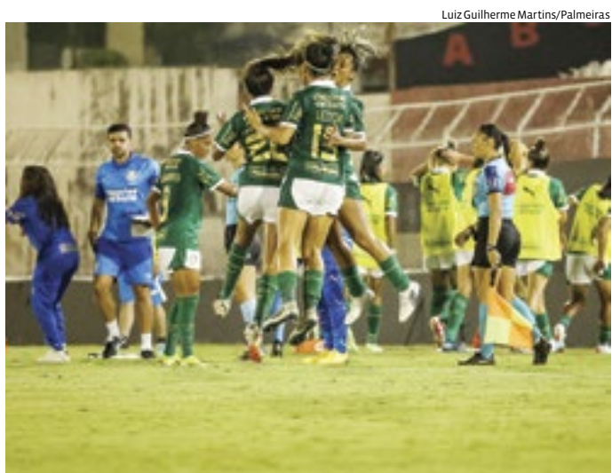
Palmeiras Feminino comemora vitória contra o Flamengo em Jundiaí