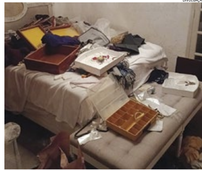
O casa da idosa foi toda revirada pelos bandidos nos dois furtos

Os PMs entraram na casa e encontraram uma das 'visitas' indesejadas, que foi preso em flagrante. Ele confirmou que não estava agindo sozinho, mas que o comparsa havia acabado de fugir pelo telhado pulando para outras residências. Não muito depois o comparsa dele também foi preso. No Plantão Policial - onde um deles, inclusive, confessou que já furtou a casa da idosa outras três vezes -, o delegado Rodrigo Carvalhaes os prendeu em flagrante e representou pela prisão preventiva de ambos.