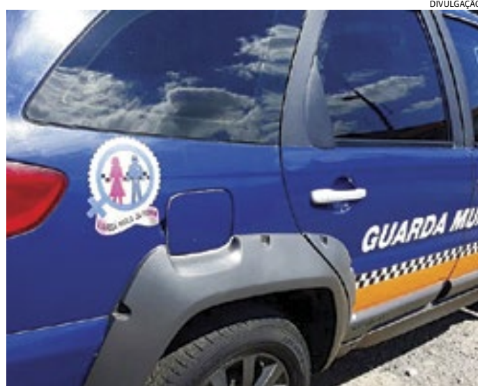
Os agentes da Patrulha Guardiã Maria da Penha o prenderam

Carvalhaes então o prendeu e o encaminhou à cadeia.