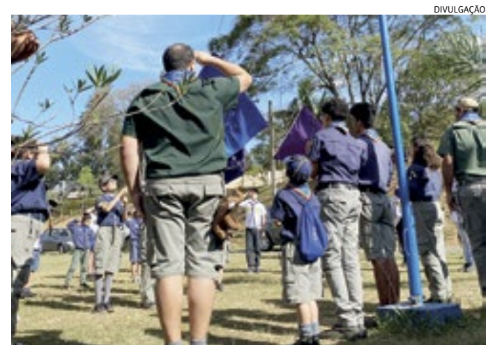
Movimento dos escoteiros foi fundado pelo inglês Baden-Powell