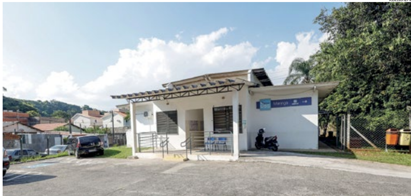
O investimento do Novo PAC servirá para melhorias na saúde, educação e cultura, incluindo construção de UBSs e creche

Ao longo dos últimos sete anos, a gestão investiu em reformas e ampliações da rede de atendimento em Saúde, com intervenções em 40% de todos os equipamentos, além de contar com construções em andamento, como a Clínica da Família e Pronto Atendimento (PA) da Ponte São João e o Ambulatório Médico de Especialidades e Diagnóstico