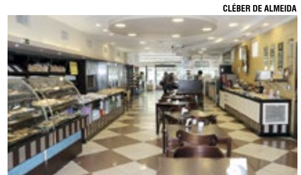
Ambiente acolhedor há mais de 40 anos