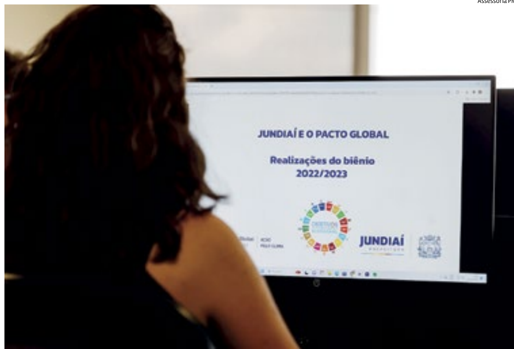
Jundiaí também adere à agenda de responsabilidade de crescimento sustentável e da cidadania

Ao integrar o bloco, Jundiaí também reforça o compromisso de contribuir para o alcance dos 17 Objetivos de Desenvolvimento Sustentável (ODS) e fortalecer a gestão eficiente, transparente e direcionada ao desenvolvimento social.