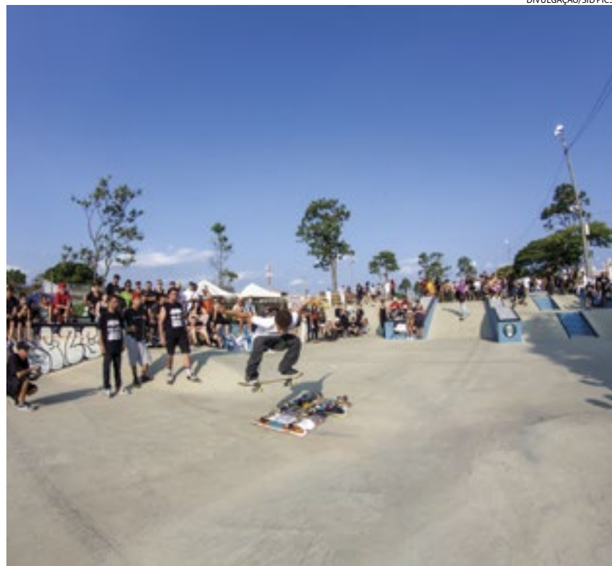
O evento é gratuito e contará com competições de skate em diferentes categorias