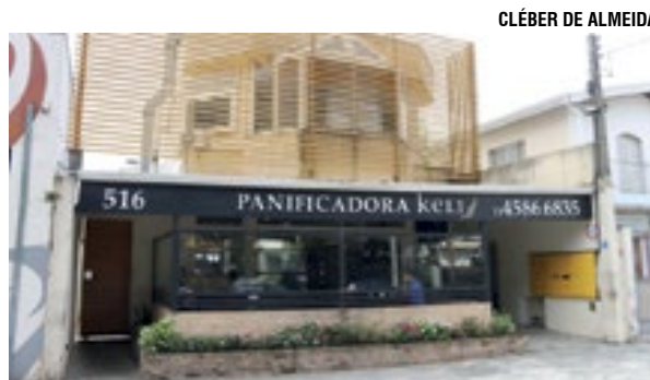
Um prédio moderno e aconchegante

Com essa conquista, a Keli agora faz parte de um guia de padarias turísticas do Estado.