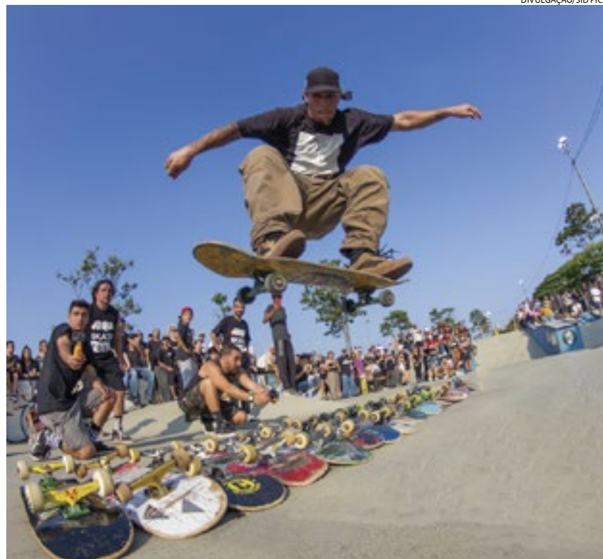
Entre as provas disputadas estão: melhor manobra, competição de salto e bowl

haverá premiação de R$ 5 mil, que será dividida entre os três primeiros colocados (R$ 3 mil para o primeiro lugar, R$ 1 mil para o segundo e R$ 1 mil para o terceiro).