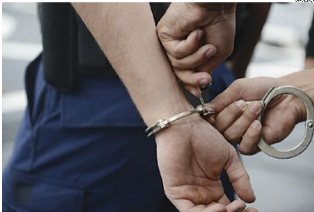
O homem, que havia sido preso por um dos crimes e é suspeito de quatro ataques, foi solto

Segundo apurou a reportagem, a decisão de conceder a liberdade provisória ao suspeito foi fundamentada pelo juiz, entre outras