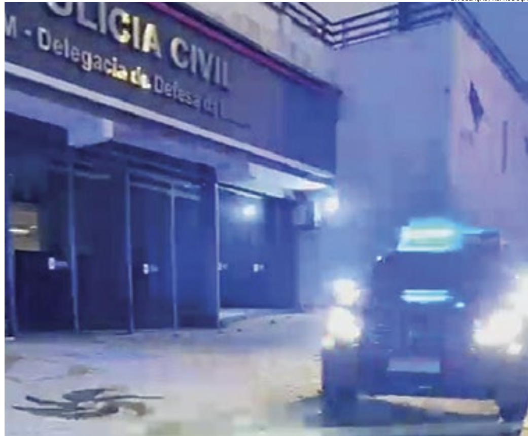
Policiais da DDM iniciaram a operação nas primeiras horas da manhã e efetuaram sete prisões

Também foram positi- vados dois mandados de