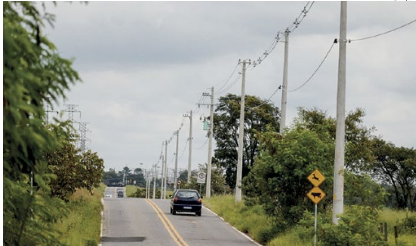
Postes de concreto fazem parte da renovação do parque de iluminação da região Oeste de Jundiaí; investimento é de R$ 547 mil

Desde 2020, 4,4 mil lâmpadas em LED já foram instaladas em vias públicas de Jundiaí, em bairros e região central, além de praças e equipamentos públicos. “A avenida Luiz Gushiken,