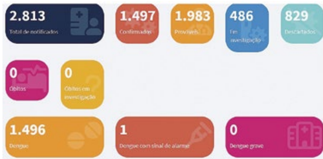
Mais de 1,9 mil casos confirmados desde o início do ano, segundo dados do Painel do Governo do Estado