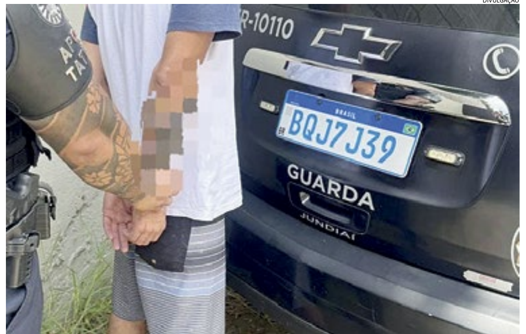
Ele foi conduzido pelos GMS à delegacia, onde ficou à disposição da Justiça