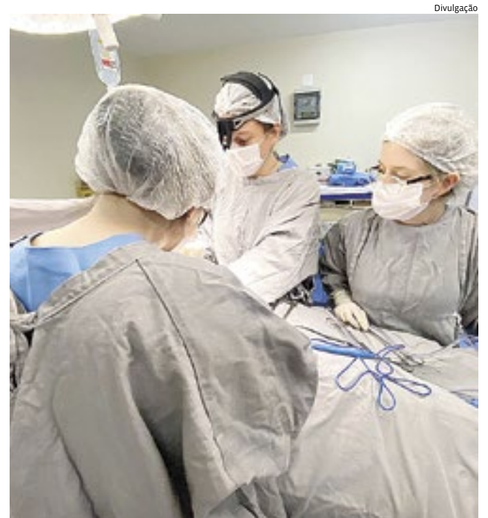
Hospital São Vicente realiza mais uma captação de órgãos

Referência em todo o Estado de São Paulo, o HSV, nas etapas que envolvem o processo de captação de órgãos, conta com o apoio de uma equipe multidisciplinar (psicólogos, assistentes sociais, fisioterapeutas, enfermeiros e médicos) que, além de atender os familiares em um momento sensível e doloroso de forma humanizada, auxilia na viagem que os órgãos e tecidos devem fazer no tempo hábil para chegar ao destino em perfeitas condições e, assim, salvar vidas.