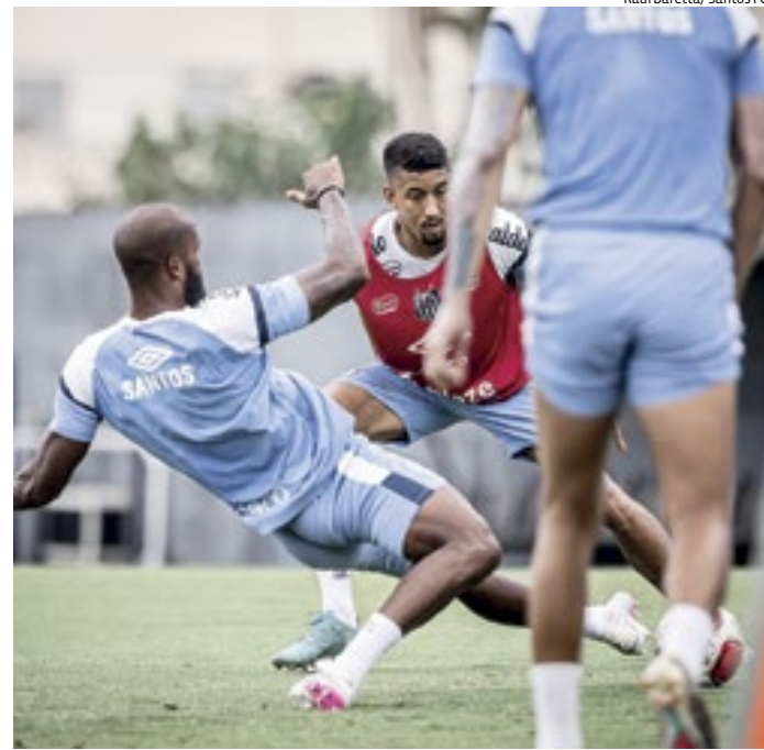
Para a partida, o técnico Abel Ferreira seguirá com alguns desfalques