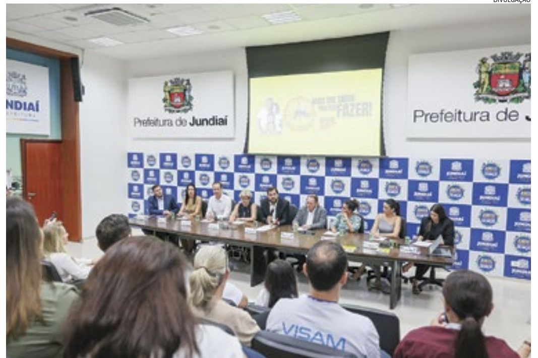
Além da força-tarefa “Dia D de Combate à Dengue”, os municípios vão ampliar as estratégias

No dia 23 de fevereiro, a RMJ realizou o “Dia D de