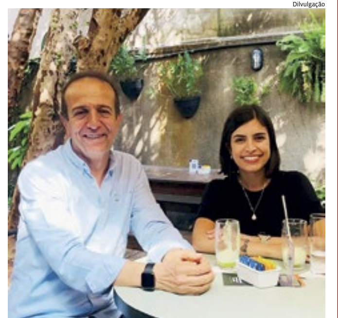
O ex-prefeito de Jundiaí, que também já foi deputado estadual e deputado federal, Miguel Haddad, anunciou em suas redes sociais que se reuniu com a deputada federal, pré-candidata à prefeitura de São Paulo, Tabata Amaral, para discutir sobre os desafios do poder executivo.

Laura Carneiro Deputada Federal (PSD-RJ)