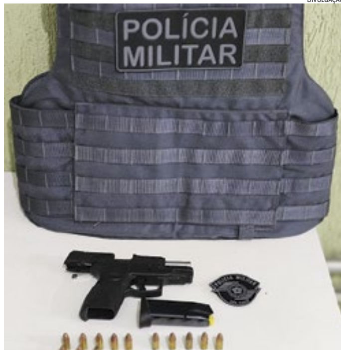
Arma e as munições localizadas e apreendidas pelos policiais militares

De acordo com os PMs, na cintura dele foi localizada uma pistola 9mm, devidamente registrada em seu nome - apesar de ser Colecionador, Atirador Desportivo e Caçador (CAC), ele não poderia estar com o armamento fora de um clube de tiro ou de sua casa, a menos que estivesse transitando diretamente de um desses lugares ao outro, munido da guia de trânsito do