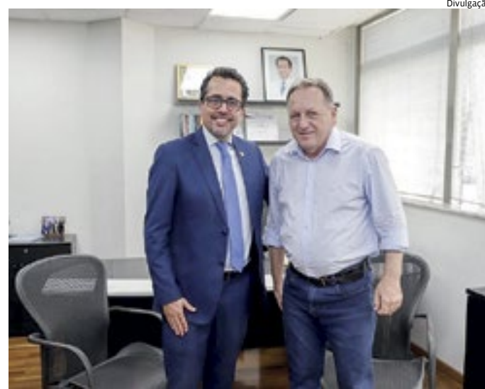
O prefeito de Louveira, Estanislaus Steck, utilizou suas redes sociais para agradecer ao deputado estadual Dr. Elton Júnior pela verba de R$ 2 milhões que foi destinada à cidade por meio de emenda parlamentar. Os recursos foram encaminhados à saúde, que enfrenta dificuldades pós-pandemia com aumento de gastos.