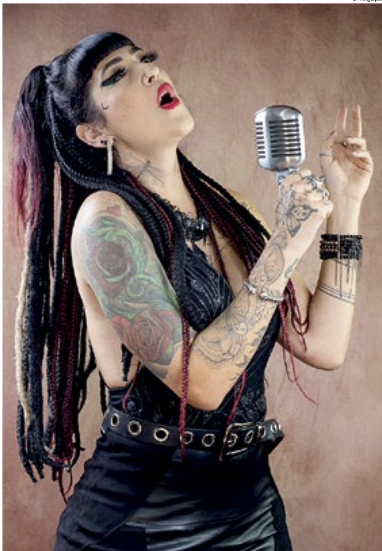
A festa se completa com um show especial com a cantora Shelly Simon

Todos podem também presentear, nesse dia, a mãe, avó, esposa, namorada, filha, amiga, enfim, aquela mulher que faz a