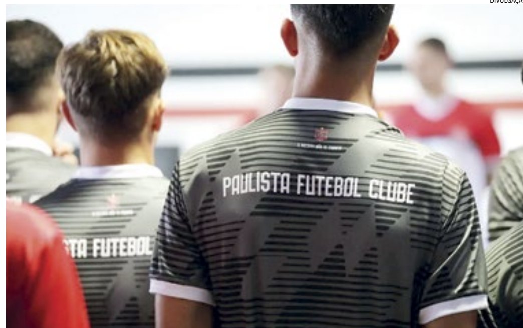
Os atletas foram submetidos a testes físicos na academia do Jayme Cintra e se reuniram com a diretoria