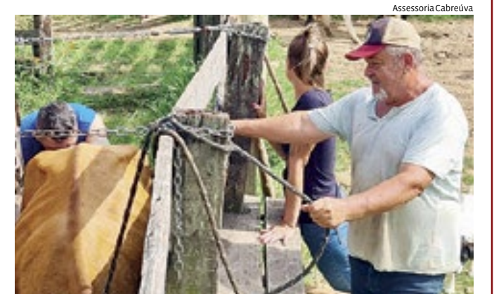
Quarta etapa do Programa ‘Mais Pecuária Brasil’ em Cabreúva

A Secretaria de Desenvolvimento Econômico, Agronegócio, Indústria e Comércio (SDE) concluiu mais uma etapa do Programa “Mais Pecuária Brasil” nesta semana, beneficiando oito propriedades e mais de 85 animais com inseminação artificial sem custos para os produtores. Além disso, 125 animais passaram por exames de ultrassom para diagnóstico do ciclo reprodutivo, visando um atendimento mais preciso. O programa, realizado desde o ano passado no campus de uma faculdade de medicina veterinária, tem despertado interesse entre os produtores locais, impulsionando geneticamente o rebanho. A próxima etapa será iniciada na semana seguinte, e os interessados em participar devem entrar em contato com a SDE para análise e cadastramento de suas propriedades e rebanhos.