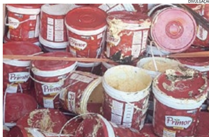
A manteiga havia sido apreendida no domingo pela manhã

A DIG e a Guarda Municipal haviam apreendido em Louveira na manhã de domingo, 27 toneladas de manteiga imprópria para o consumo, uma vez que estava sendo transportada em um caminhão comum, sem refrigeração de carga. Nesta ocorrência, o condutor do caminhão foi preso