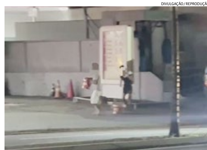
A polícia flagrou duas pessoas pegando potes de manteiga

priado. "O caminhão estava sendo levado pelo guincheiro conveniado, quando apresentou problemas mecânicos em uma avenida de Várzea Paulista. Enquanto aguardava a solução do