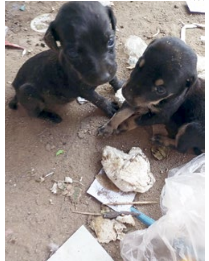
Dois dos filhotes tiveram fratura constatadas em uma clínica

Nota: Para adotar, bem como ajudar no tratamento e alimentação dos bichos, o contato é: 9 7484-8253