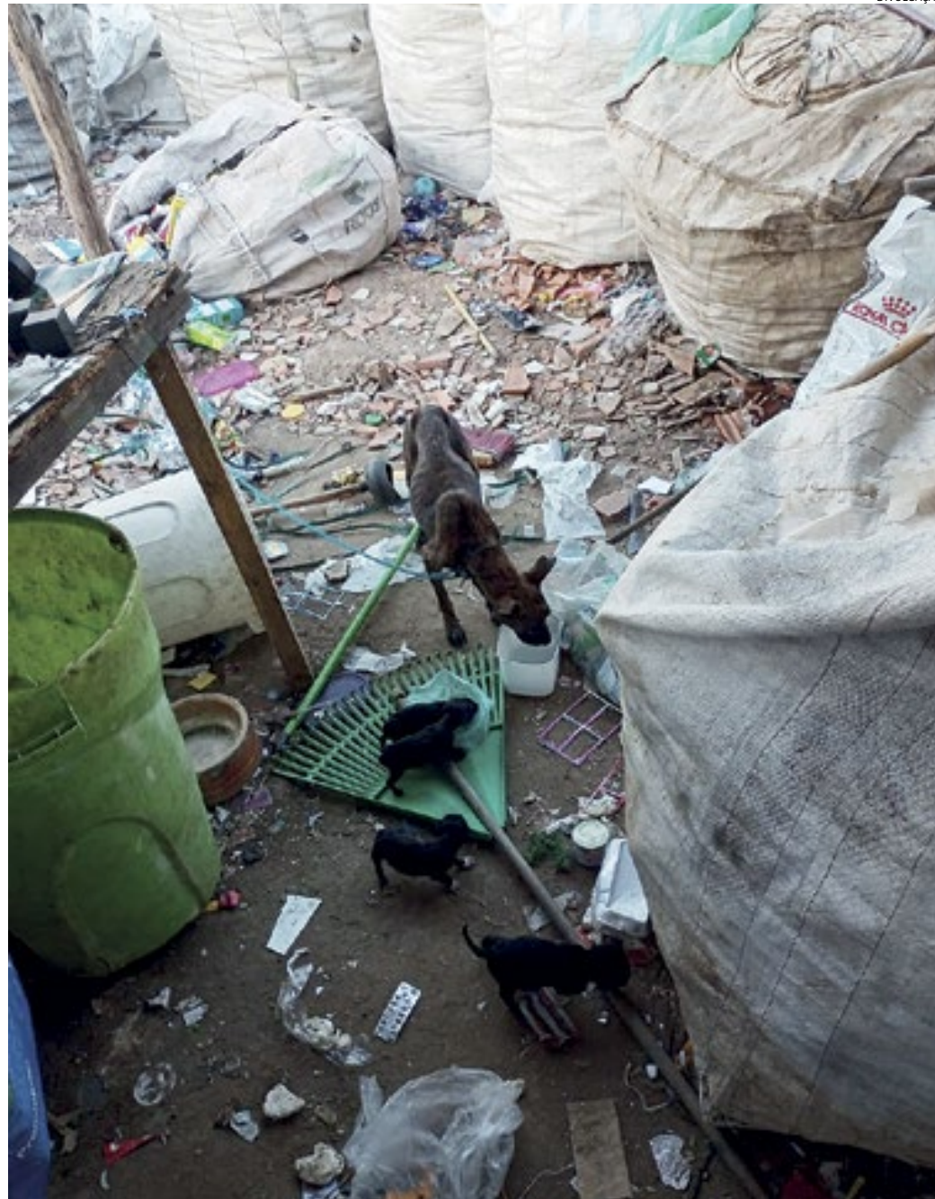
A mãe e os filhotes foram encontrados sem água e sem comida no local e extrema magreza

Foi solicitado que uma veterinária de uma clínica particular da cidade avaliasse as condições de saúde dos bichos, e a profissional atestou: "atesto para os devidos fins que os animais da espécie Canina, se raça definida, de idade variada sendo fêmea e filhotes claramente sofrendo maus-tratos com Score corporal grau 1 (muito magro) e filho-