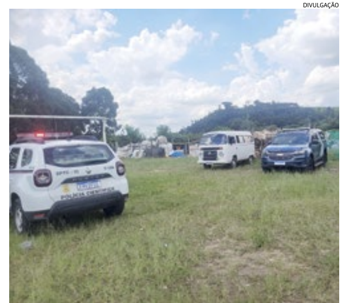
Resgate foi feito por uma ONG e GM; a Perícia Técnica esteve no local