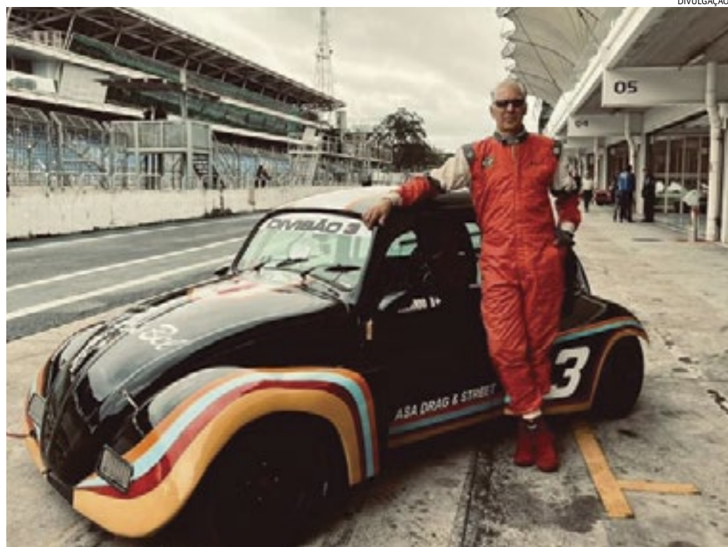
O objetivo do piloto jundiaiense é conquistar o lugar mais alto do pódio

Esta será a primeira das seis etapas da temporada 2024 e deve reunir mais de 40 pilotos do Brasil. Na final da competição do ano passado, em Monte Alegre do Sul, o jundiaiense foi surpreendido com uma batida no seu carro, antes da corrida e precisou correr contra o tempo para ter condições de entrar na pista. “Antes da corrida, eu e outros pilotos nos reunimos em um restaurante. Meu carro estava estacionado na rua e uma pessoa veio me avisar que haviam batido nele. Na hora eu não acreditei. Fui ver o que tinha acontecido e tinha entortado algumas peças da