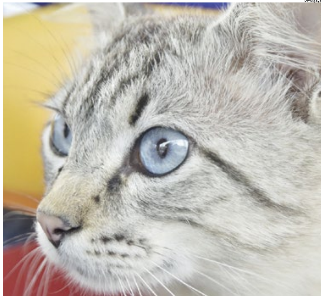
Além de trazer muitos benefícios para a saúde do animal, ainda evita a proliferação de animais nas ruas

Outro aspecto que exemplifica a importância da castração de gatos ma-