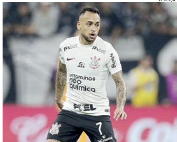
A oferta do time carioca é para um contrato de quatro anos

A competição começa em 21 de abril e será finalizada em 15 de setembro. O Paulista Futebol Clube está no Grupo 2 ao lado de São Carlos, Flamengo de Guarulhos, Colorado de Caieiras e Barcelona de Capela.