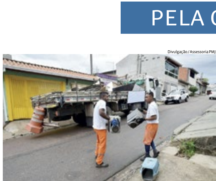
Ação será feita em toda a cidade, para minimizar os focos de dengue

Em uma reunião com o presidente da Câmara dos Deputados, Arthur Lira, e lideranças da casa, o ministro da Fazenda, Fernando Haddad, revelou que o governo está trabalhando na elaboração de um novo programa para o setor de eventos. Esse novo programa, que será encaminhado por meio de projeto de lei com urgência constitucional, substituirá o atual Programa Emergencial de Retomada do Setor de Eventos (Perse). Haddad explicou que a intenção do governo é encerrar o Perse por meio de medida provisória, enquanto o novo programa será desenvolvido com base nas discussões e sugestões feitas pelos líderes parlamentares para melhorar o controle e eficiência das medidas. A declaração