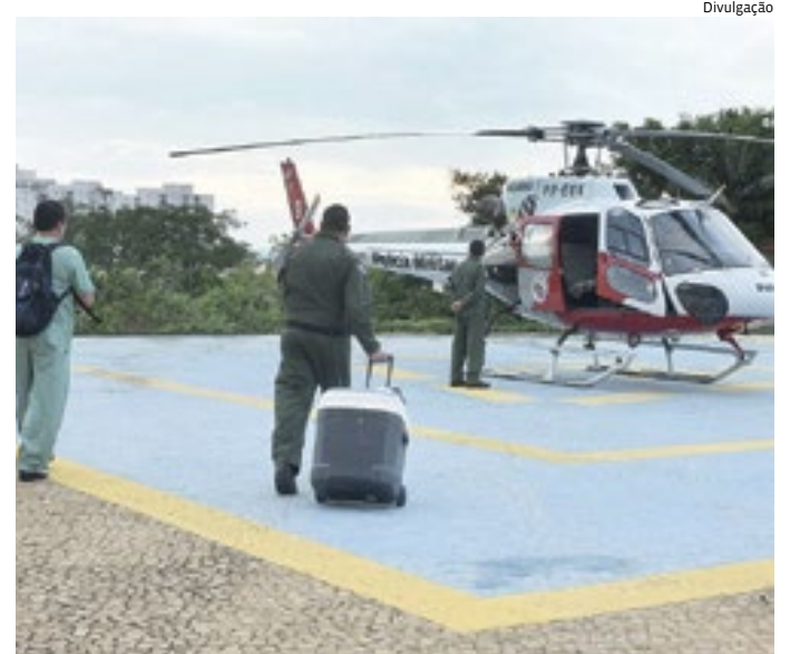
Em casos urgentes, órgãos são transportados via transporte aéreo

Casos de alcance nacional chamam atenção para o tema e colocam em pauta a importância do diálogo sobre o assunto. Vale ressaltar que, ainda que a pessoa manifeste em vida a sua vontade de ser doador, a decisão final é da família e, por isso, é preciso expor esse desejo. Conversar sobre o tema faz com que no momento delicado como o óbito, a decisão familiar se torne mais fácil com base na vontade do paciente.