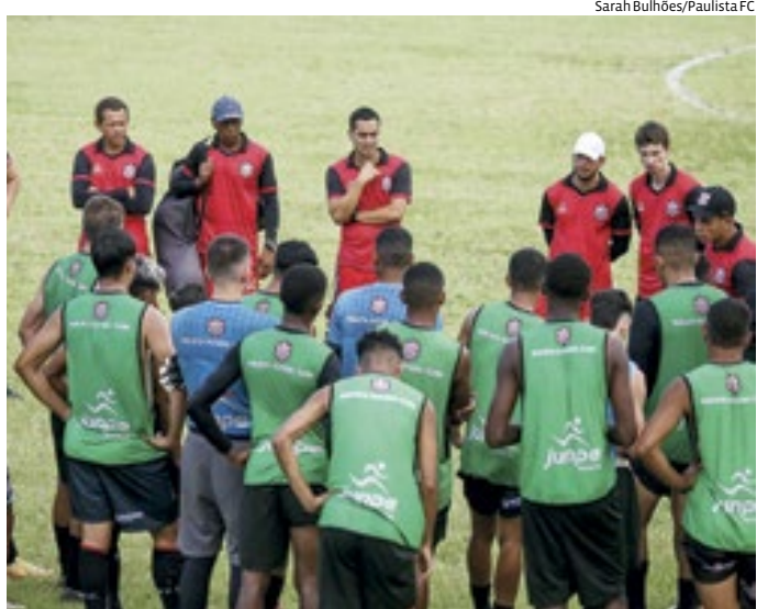
Sarah Bulhões/Paulista FC

A primeira parte do elenco profissional se apresenta na segunda-feira (4), no Estádio Dr. Jayme Cintra. 12 atletas iniciam os trabalhos junto da comissão técnica.