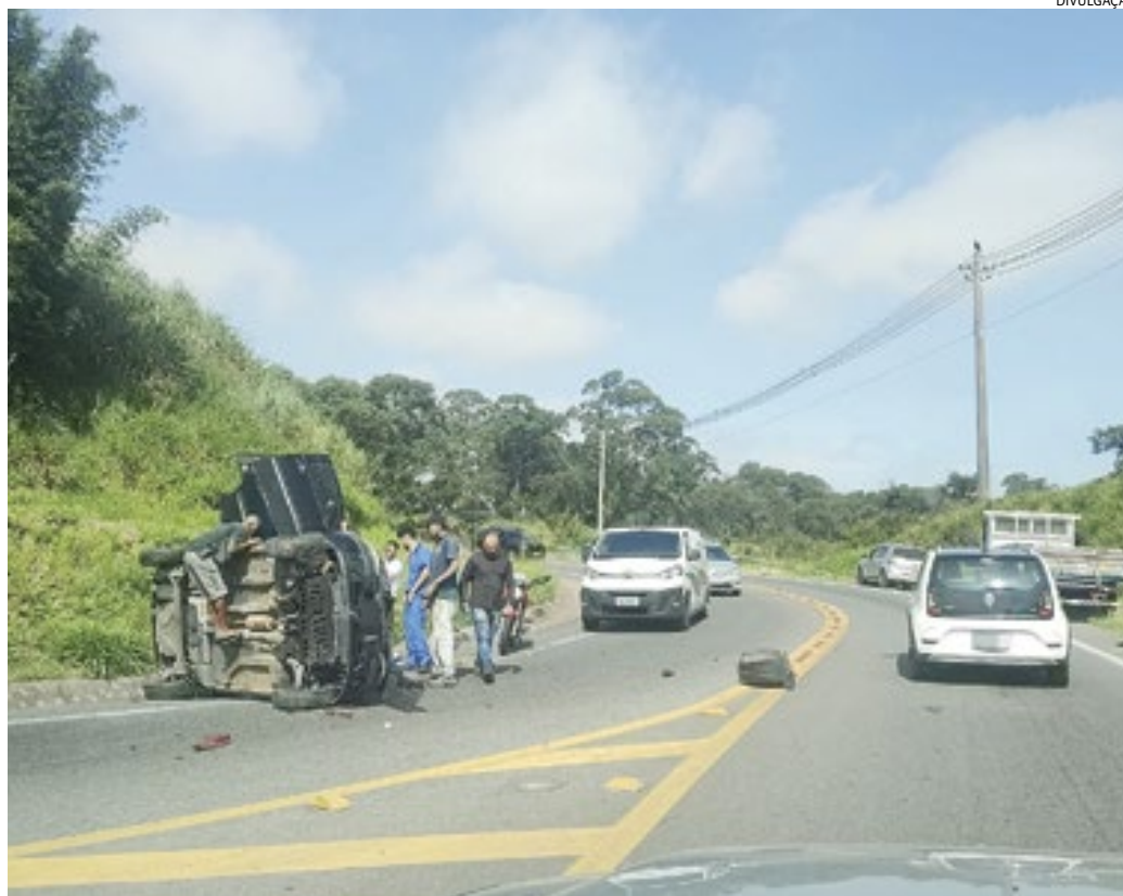
O carro apresentou problema mecânico e o condutor perdeu o controle e capotou

A criança estava devidamente presa à carteirinha de bebê, mas com o capota-