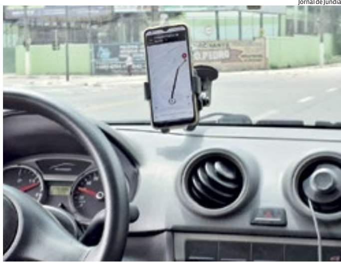
A Uber agora oferece viagens de jovens com supervisão dos pais

O novo recurso da Uber promete levar mais tran-