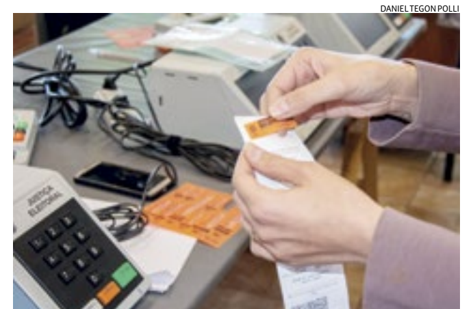
O voluntário opera urna eletrônica e impressão de boletim