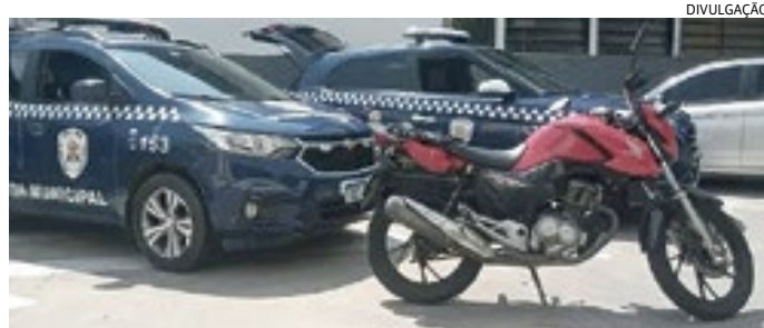
A moto será periciada para saber se é produto de roubo ou de furto

Na moto estavam dois homens, que obedeceram ordem de parada. Em revista pessoal, nada de ilícito foi encontrado. Porém, ao checkarem a motocicleta, os agentes descobriram que o chassi