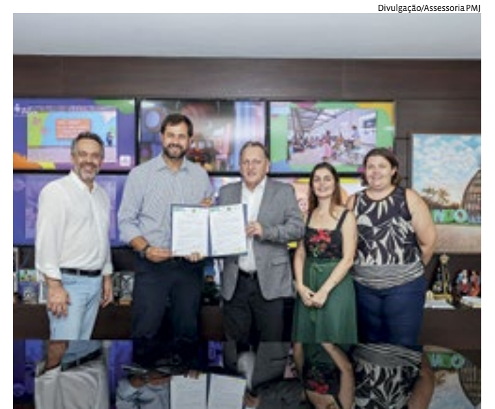
Rede encabeçada por Jundiaí chega a 14 cidades integrantes

Além de Louveira e Jundiaí, também fazem parte da Rede os municípios de Benevides (PA), Boa Vista (RR), Brasileira (AC), Fortaleza e Sobral (CE), Osório e Pelotas (RS) e Itu, Itupeva, Jarinu, Mococa e Mogi das Cruzes (SP)