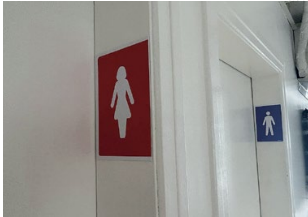
Proposta foi aprovada pela Comissão de Direitos Humanos; texto prevê multa para gestor da escola

Para virar lei, a proposta ainda terá de passar por outras votações, em comissão do Senado e na Câmara dos Deputados. Eventual desres-