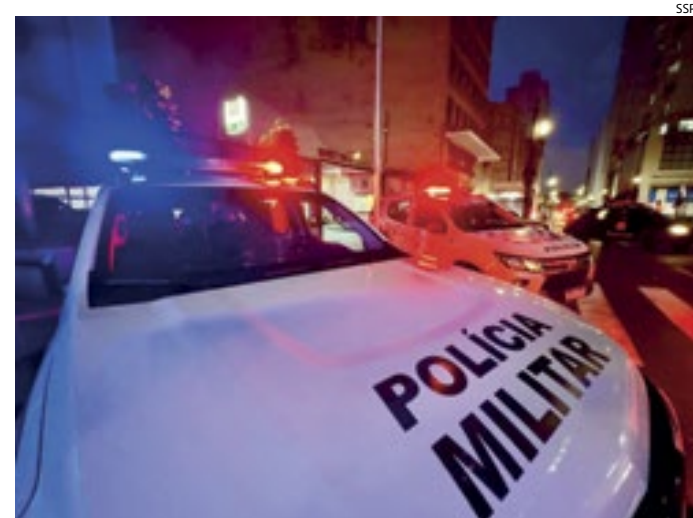
O adolescente confessou que faz parte de uma quadrilha de roubo

O menor infrator foi encaminhado à Fundação Casa e permanece à disposição do Ministério Público junto à Vara Especial da Infância e Juventude.