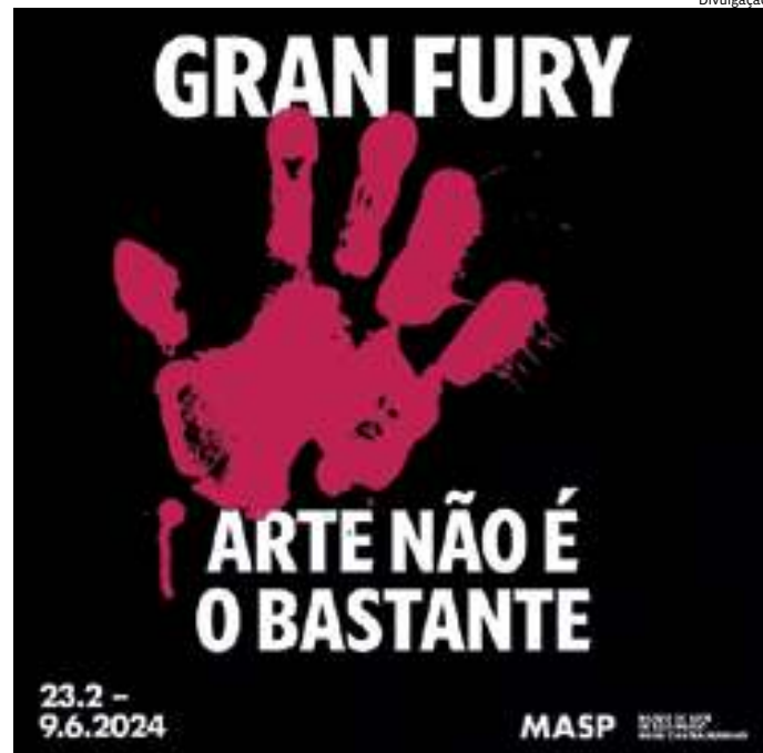
Gran Fury foi um coletivo referência para as práticas de ativismo artístico

O título da exposição, "Arte não é o bastante", se inspira na frase "With 42,000 Dead, Art Is Not Enough" [Com 42 mil