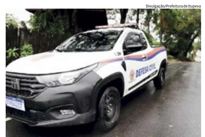
O objetivo é atender às ocorrências em caso de emergência

A Defesa Civil de Itupeva lançou o programa “Operação Chuvas” para prevenir e atender emergências causadas pelas chuvas. O plano conta com ações preventivas e atendimento emergencial, divididas em quatro níveis: Observação, Atenção, Alerta e Alerta Máximo. Em caso de emergência, os municípios podem contatar o Corpo de Bombeiros (193), a Guarda Municipal (153) ou a Defesa Civil 4591-1213 (das 8h às 17h, de segunda a sexta-feira).