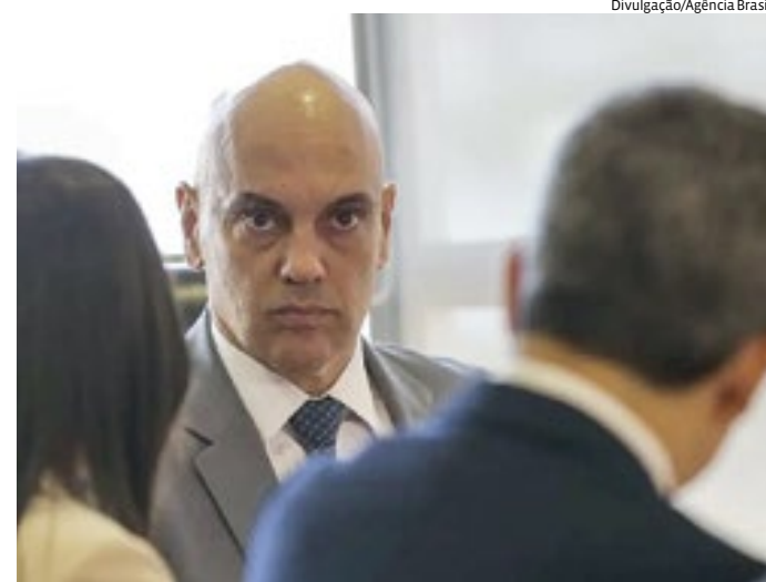
Recurso contra Moraes deverá ser apreciado pelo presidente do STF

dente do STF, ministro Luís Roberto Barroso, analisar o novo pedido da defesa de Bolsonaro. A decisão de Barroso na semana anterior foi contrária ao afastamento de Moraes, alegando falta de fundamentação legal para tal medida. Porém, com o novo recurso, a expectativa é de uma nova análise do caso.