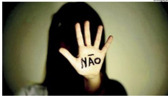
A todo momento, mulheres são assediadas sem qualquer temor

O consultório dele, por ser atrás de uma academia, fez com que ela se sentisse intimidada a reagir, por ter muitos homens lá. Depois desse episódio, a vítima não se consultou mais com aquele fisioterapeuta. Ela ficou indecisa se contava aos pais o que aconteceu (eles atuam na área jurídica), até que uma amiga a encorajou. "Não era uma atitude de moleque, era claramente uma relação de poder que ele exercia no consultório. Foi sujo e sorrateiro o suficiente para me fazer sentir maluca. Falei com a minha mãe e abri um boletim de ocorrência contra ele, que foi julgado culpado, foi uma vitória para mim", conclui.