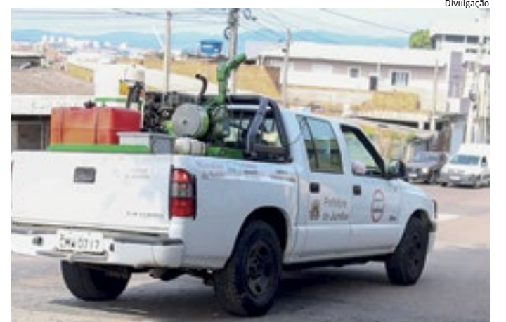
Equipamento utiliza baixo volume de inseticida e elimina mosquito

Em todo o município, ações para combate e en-