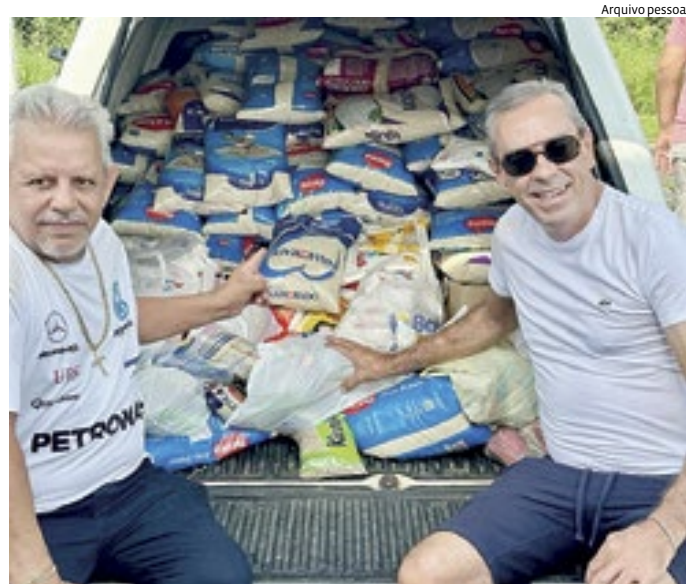
Mais de uma tonelada de alimentos foram arrecadados na festa