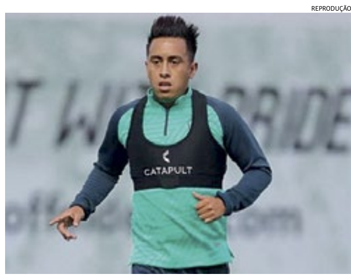
O Santos foi punido por dívidas da contratação do peruano Cueva

A provável escalação do Palmeiras tem: Weverton, Marcos Rocha, Luan, Murilo, Joaquín Piquerez, Aníbal Moreno, Richard Ríos, Zé Rafael e Raphael Veiga, Endrick e Flaco López.