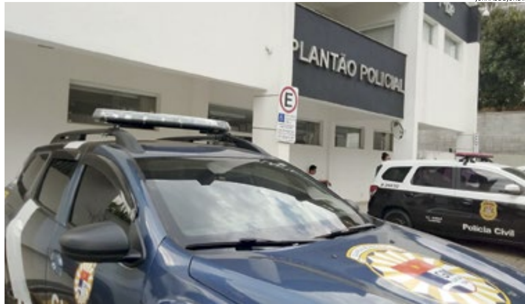
Os seguranças detiveram o suspeito e acionaram a GM para auxílio na condução da ocorrência

Era por volta das 15h quando uma cliente do supermercado foi até um segurança e um fiscal de vendas, informando um ato suspeito de um homem que havia colocado alguns produtos em uma mochila, e depois a depositado em