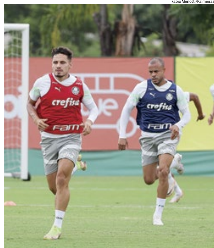
Com 21 pontos e na liderança, a equipe comandada por Abel está invicta

Do outro lado, a Portuguesa foi derrotada pelo Botafogo-SP, por 2 a 1, no Estádio Santa Cruz. A Lusa tem sete pontos e é a segunda colocada do Grupo A, atrás do Santos, que tem 22. Assim, a equipe comandada pelo técnico Pintado ainda