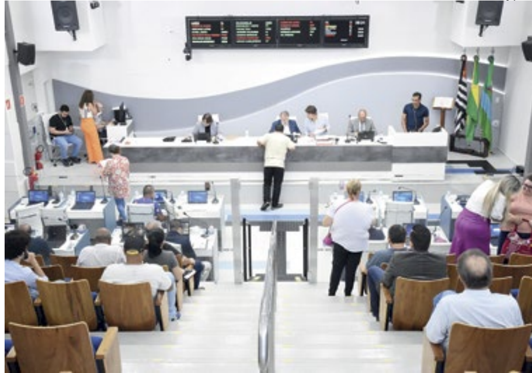
Sessão ordinária desta terça-feira (27) teve discussão de projetos que promovem melhorias na cidade

O Projeto de Lei nº 14.287: foi aprovada a instituição do Plano de Arborização Urbana, proposto pelo Prefeito Municipal, vi-