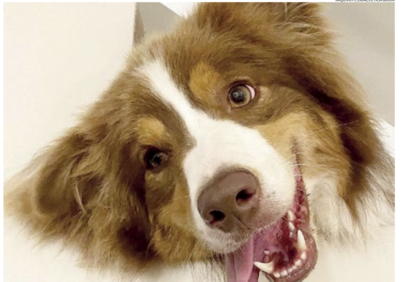
Aperol, 2, é um cão da raça border collie que chama atenção pela simpatia e ‘audora’ fazer caras e bocas para os seguidores