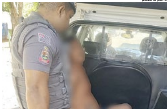
Policiais militares realizavam abordagem e prenderam indivíduo

Diante da constatação da situação legal do indivíduo, os policiais conduziram o detido à delegacia local. Lá,