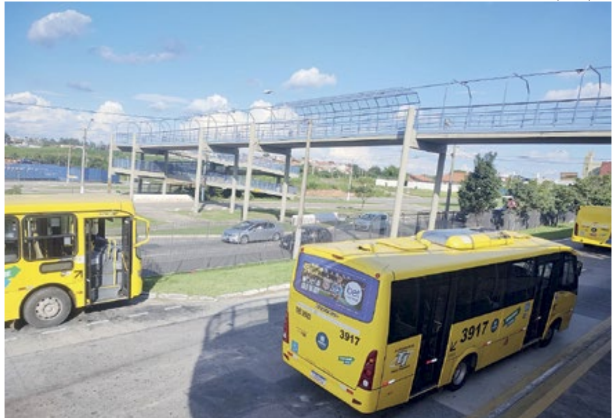
Atualmente há, na cidade, 20 micro-ônibus, formato que, segundo a prefeitura, é mais econômico e sustentável