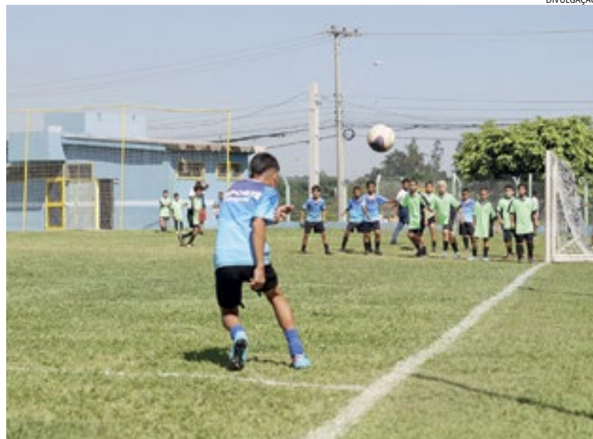
Várias modalidades tiveram crescimento no número de vagas

Várias outras modalidades também tiveram cresci-