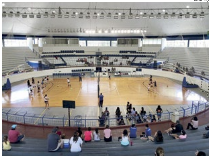
Todas as vagas ofertadas são mediante disponibilidade para este ano

Numa parceria com o Sesi, pelo Programa Atleta do Futuro (PAF), algumas modalidades também são oferecidas, como vôlei de praia, beach tennis, handebol e basquete. As inscrições são diretamente na secretaria na unidade do Sesi na Avenida Dr. Antonio Segre (Sesão).