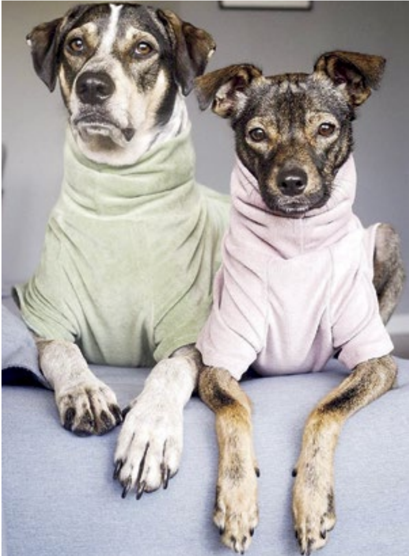
Os irmãos vira-latas Chico e Cora, de 3 anos, são o puro charme com roupinhas

Não são apenas os humanos que se destacam como influenciadores digitais. Em Jundiáí, uma tendência curiosa tem conquistado o coração dos internautas: