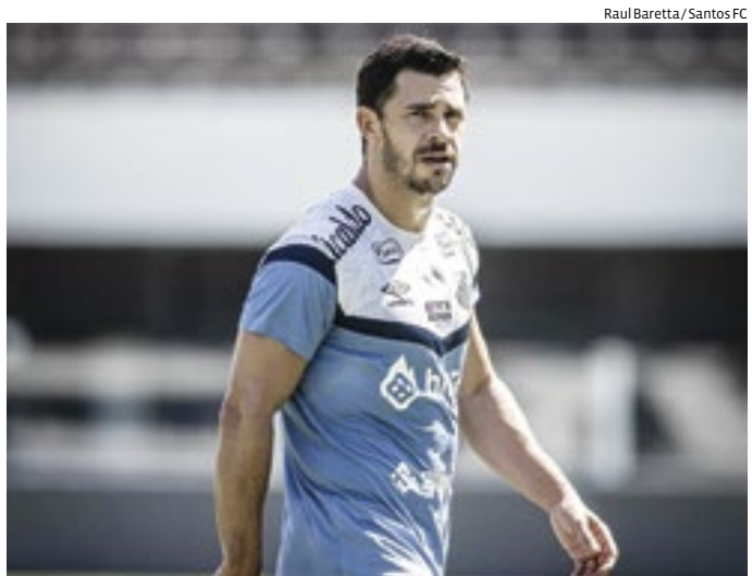
O Santos chega bem à reta final da fase de grupos do Paulistão