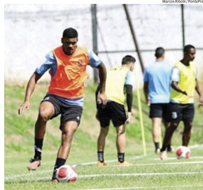
Páreo será duro, pois a Ponte promete força total para a partida

Do outro lado, a Ponte também tem a permanência ameaçada na competição e promete entrar em