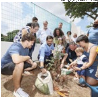
Na escola, crianças e membros do legislativo, plantaram uma árvore