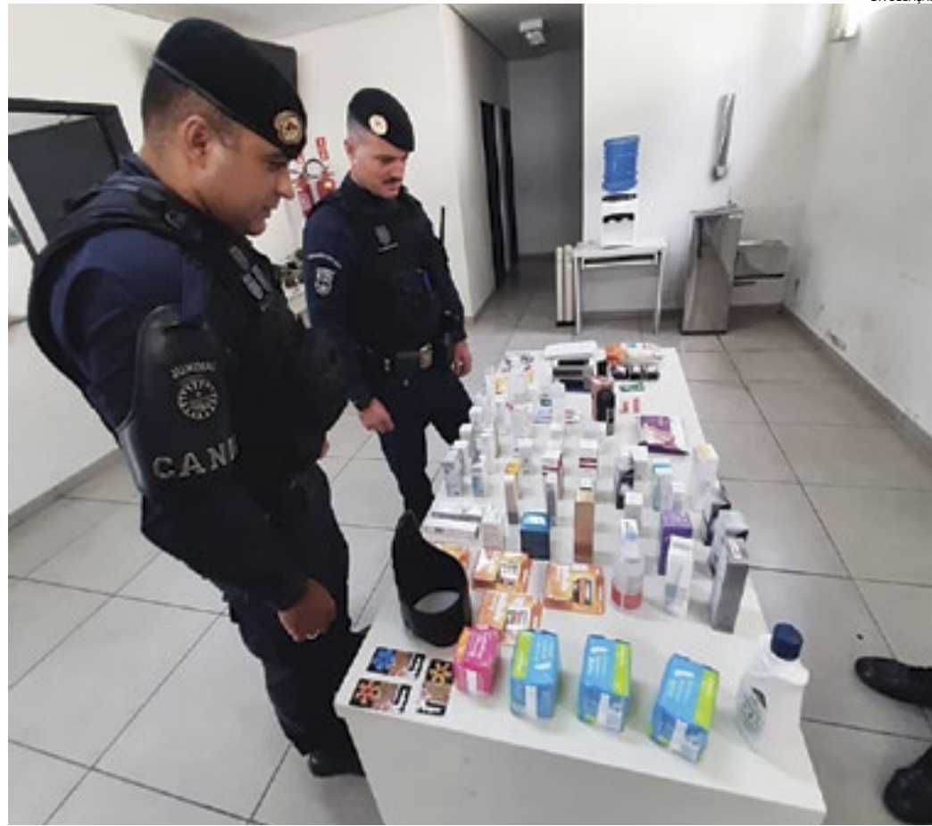
Produtos furtados, de cosméticos a remédios, foram recuperados pelos guardas e devolvidos às vítimas