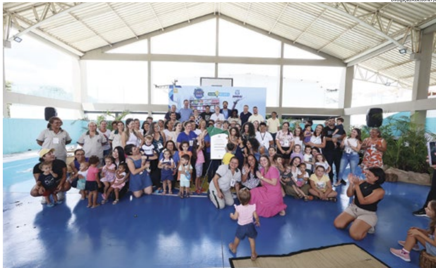
A solenidade de reinauguração contou com a participação de todos os servidores da unidade, gestores, autoridades e famílias presentes

Com a reabertura, a escola irá atender crianças de até dois anos (Educação Infantil I – creche) e conta com capacidade de aten-