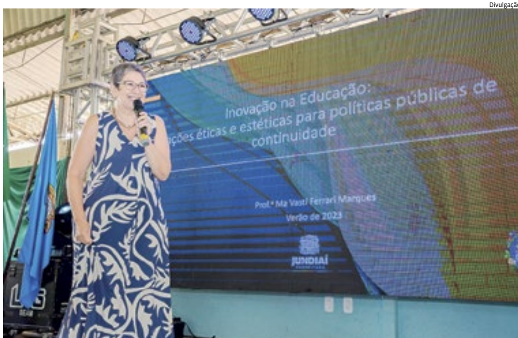
“Trouxemos a metodologia do ‘Desemparedamento da Escola’, pelo programa Escola Inovadora”, comentou Vastí

A série de atividades contou com uma palestra para