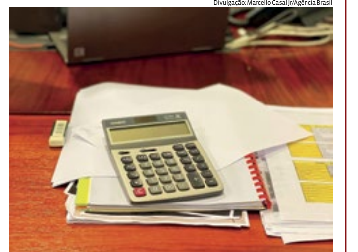
O programa beneficiou cerca de 12 milhões de pessoas

O Ministério da Fazenda firmou parceria com a Serasa para ampliar acesso ao Desenrola Brasil. Clientes da Serasa podem ser direcionados ao site do programa de renegociação de dívidas do governo federal. Usuários podem clicar em "Negociar Dívidas" para ver propostas de renegociação. A parceria busca ampliar o acesso ao programa, já que a plataforma da Serasa tem 88 milhões de brasileiros cadastrados.