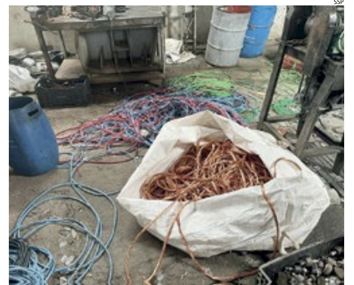
Ação foi realizada para combater o mercado ilegal

Ao todo, 16 policiais civis e cinco viaturas foram utilizadas para fazer as vis-