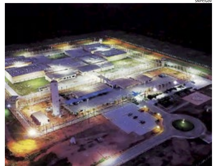
Penitenciária federal de Mossoró (RN), onde dois detentos fugiram