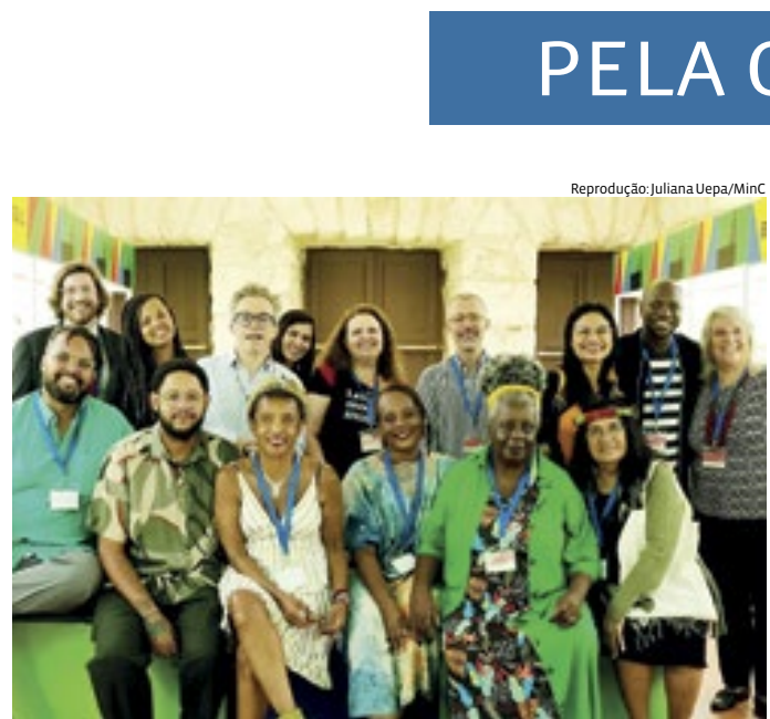
A Feira é um dos principais eventos do calendário cultural de Cuba

Em Itatiba, 27 escolas municipais receberam um avanço tecnológico em seus laboratórios de informática neste ano. Com um investimento superior a R$ 4 milhões, a Prefeitura adquiriu 613 novos computadores, impulsionando o aprendizado de crianças e jovens do Ensino Fundamental. As salas dos laboratórios passaram por readequa-