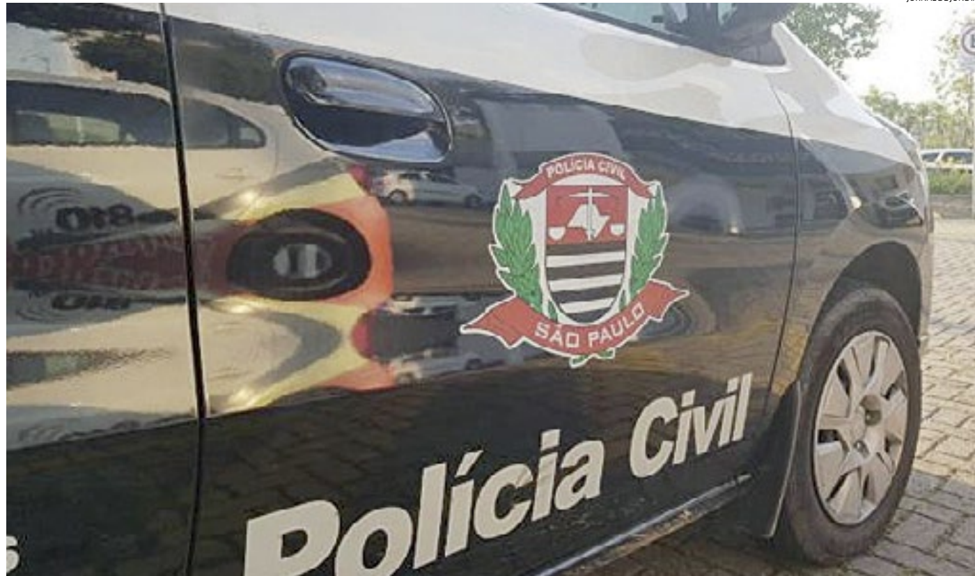
Policiais da DIG, de Jundiaí, e da delegacia de Campo Limpo, conseguiram prender um suspeito do crime