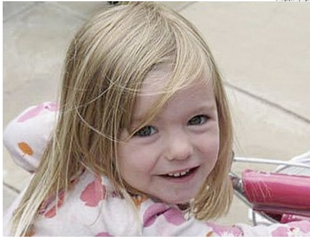
Madeleine tinha três anos quando foi sequestrada em um resort no Algarve, em Portugal

ração se a juíza, que não teve seu nome divulgado, será retirada do caso. A nova data do julgamento