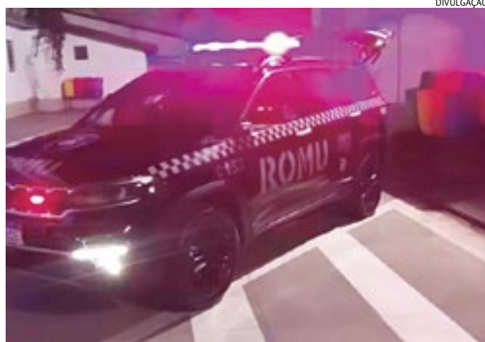
'Eu dou a vocês R$ 4 mil, se me soltarem agora', ofertou ele aos GMs

Os GMs aceleraram para pegar ambos, mas, como eles foram para direções opostas, em fuga, os agentes optaram por deter o suspeito de tráfico - o cliente fugiu.