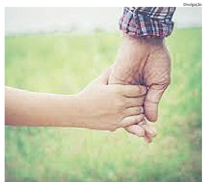
Em todo o Brasil, 172,2 mil crianças não receberam o nome do pai

Em caso de dúvidas, os munícipes podem entrar em contato com a Central de Relacionamento da DAE, pelo telefone 0800 0133 155. A ligação é gratuita e o atendimento 24 horas.