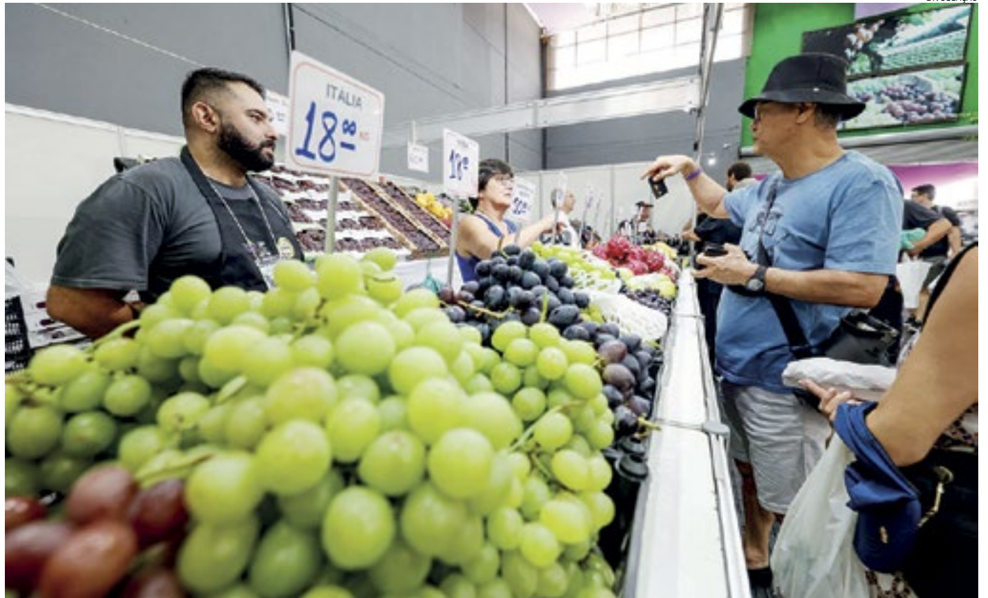
Segundo os produtores, os visitantes da Festa da Uva também encontram diferentes variedades de uvas e não só a Niágara, a mais conhecida