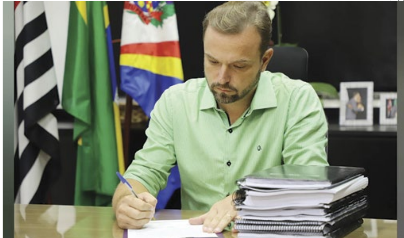
“Nós temos uma Prefeitura numa situação fiscal gravíssima e medidas serão tomadas e anunciadas”, disse em live o prefeito Cavalin

“Nós temos uma Prefeitura numa situação fiscal gravíssima e medidas serão tomadas e anunciadas para que a gente possa cuidar desse orçamento público e da Prefeitura. Cuidar para que nenhum serviço seja afetado e