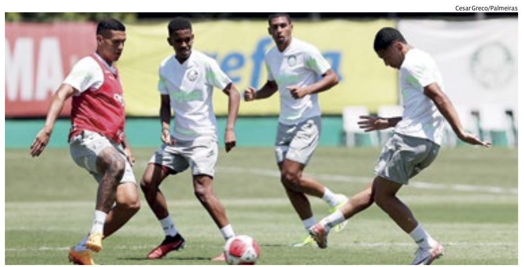
O Palmeiras deve poupar titulares pensando na Supercopa, contra o São Paulo, neste domingo