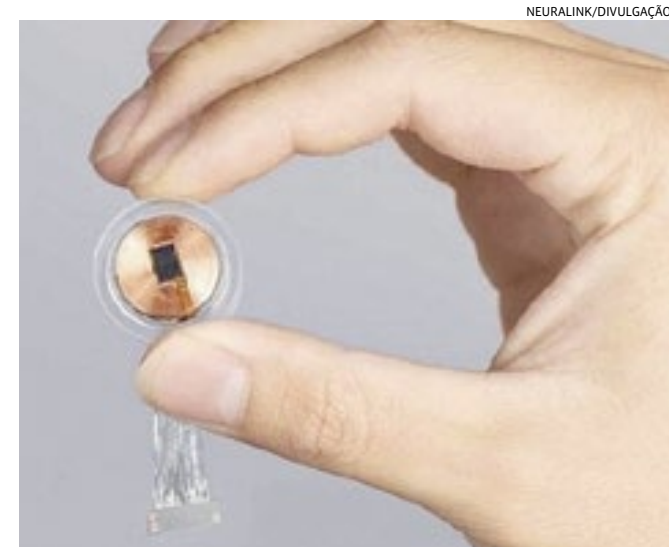
Dispositivo se chama Telepathy e processa sinais cerebrais

É possível “mexer” no celular ou no computador sem usar as mãos, apenas com o pensamento? Ainda não, mas em breve talvez seja. A empresa Neuralink, do bilionário Elon Musk, realizou no domingo (28) o seu primeiro implante de chip em um cérebro humano. Ele se chama Telepathy (“Telepatia”), processa sinais cerebrais que são decodificados por um aplicativo que, por sua vez, consegue transformá-los em ações para controlar aparelhos eletrônicos.