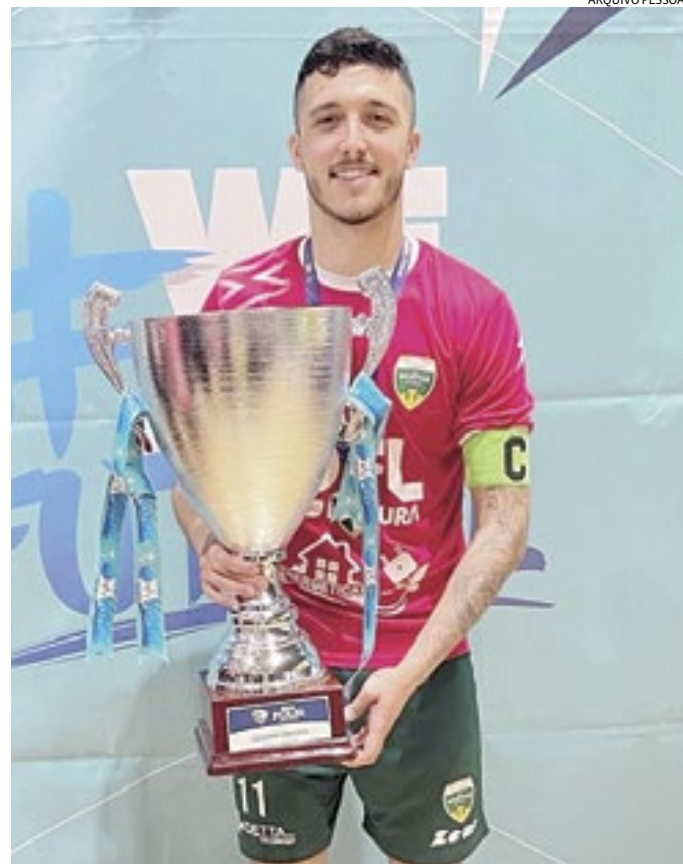
O jogador comemorou as conquistas recentes no futsal italiano

bro de 2018. Para falar a verdade, não tinha muito essa ambição grande de jogar na Europa, mas depois do convite eu passei a abrir mais a minha cabeça e me veio esse sonho de jogar em uma liga