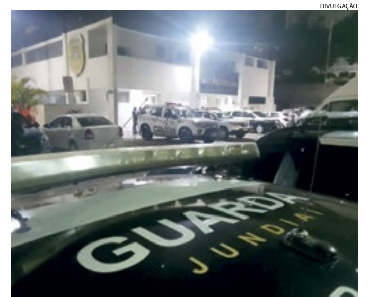
Os GMs prenderam um deles carregando uma gaveta com mais de R$ 500