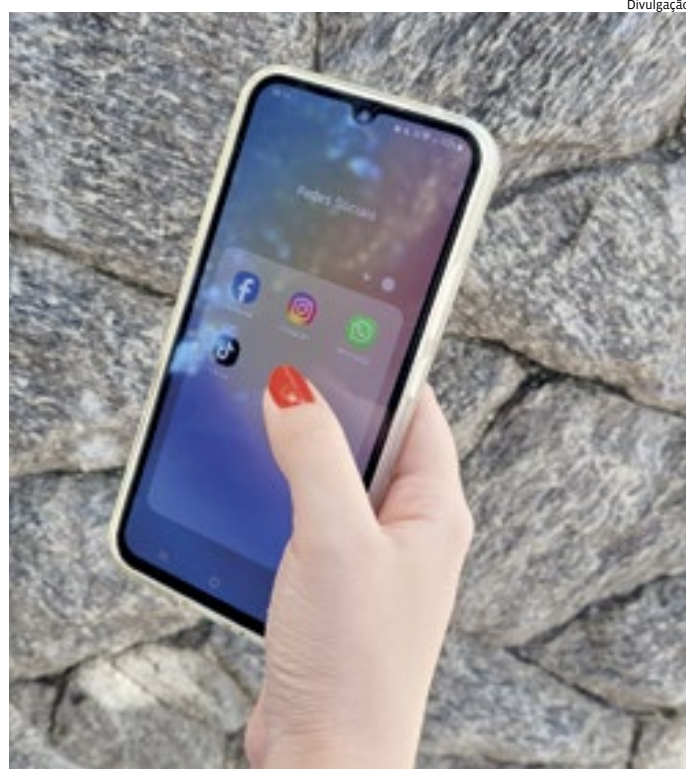
Uso excessivo de celular e redes sociais é prejudicial à saúde mental

nos dias atuais, a necessidade de buscar informações na internet é grande. “Procurar qualquer informação na internet antes de tentar se lembrar sozinho, seja para trabalho ou lazer, já é um hábito prejudicial. Estamos deixando de exercitar nossa memória e passando muito tempo em frente aos aparelhos”, aponta a profissional.