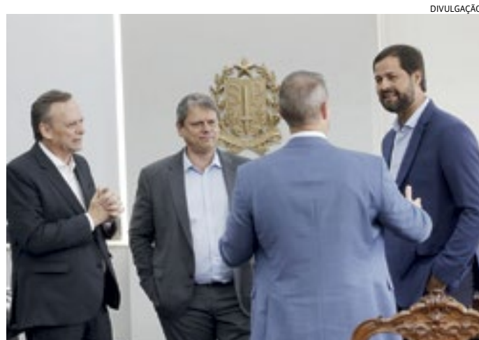
Chefe de Executivo e autoridades em reunião com governador

A Polícia Federal tem intensificado as investigações para buscar elos entre a “Abin paralela” e a organização dos atos de 8 de janeiro. Até o momento, a PF realizou três operações para investigar o uso político da estrutura da Agência Brasileira de Inteligência e do software israelense First Mile. O aplicativo – desenvolvido pela empresa israelense Cognyte – foi adquirido ainda no governo Michel Temer por 5,7 milhões de reais. A expectativa dos agentes é que, em outros desdobramentos da operação, esse vínculo entre a “Abin paralela” e os atos de 8 de janeiro fique mais claro.