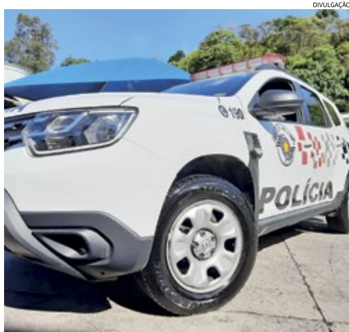
Os PMs encontraram um homem todo molhado e o abordaram

No apoio à ocorrência estiveram as equipes: 1º tenente Iuri e cabo Ludilaine; 2º sargento Israel e soldados Dopfer e Cristina; e cabo Jardas e soldado Muller.