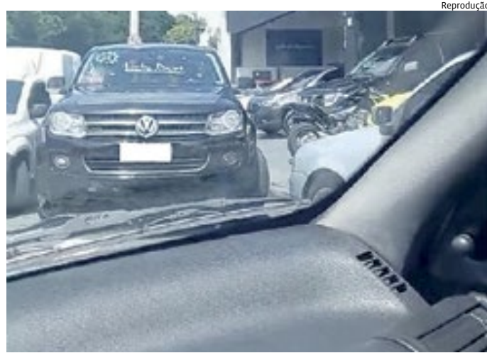
A justificativa para os veículos na calçada era manobrar na loja

outra acontece é estabelecimentos que vendem carros estacionarem na calçada e na rua. É sobre isso uma reclamação que o JJ recebeu. Preferindo não se identificar, uma leitora do Jornal de Jundiá reclamou de uma revenda de veículos no Jardim do Lago. “Essa revenda entrou nesse ponto no ano passado e a gente reclama. Estão há dois dias sem estacionar errado, mas antes paravam um carro do lado do outro na rua. Faz um tempo que a gente reclama, mas deixam só uma