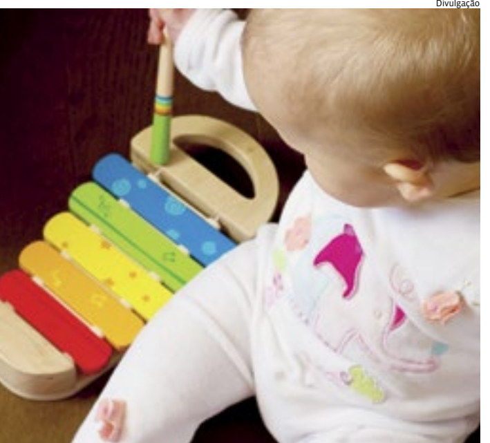
As vagas são destinadas às crianças de 06 meses a 1 ano e 11 meses

A Prefeitura ressalta que a informação de que a disponibilidade das vagas não