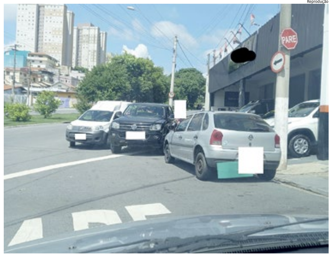
A leitora, que preferiu não se identificar, registrou estacionamento irregular, em fila dupla

mão para quem vai entrar na Samuel Martins.”