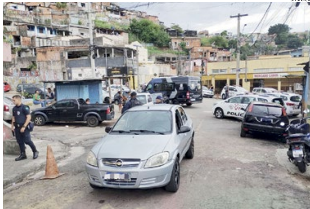
Vários 'comandos' foram montados no bairro e arredores pela PM e GM, durante operação saturação

Em outro, a Paróquia São João Batista também foi invadida e furtada, du-