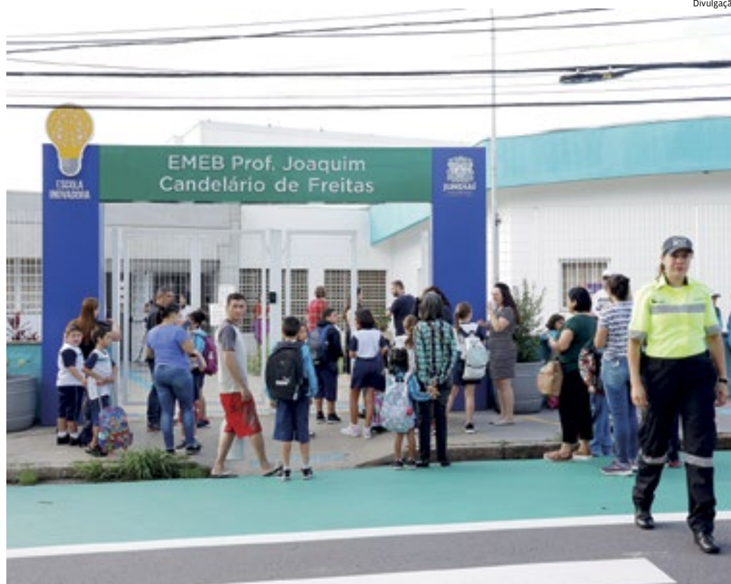
Retorno da crianças às aulas está marcado para a próxima terça-feira, dia 6 de fevereiro

Parte dessas atividades irá compor a programação do “Voa Pé”, vivências e aprendizagens realizadas fora do contexto escolar, em praças, jardins, centros esportivos, parques e outros espaços da cidade. A programação será realizada nos dias 08 e 09 de fevereiro –