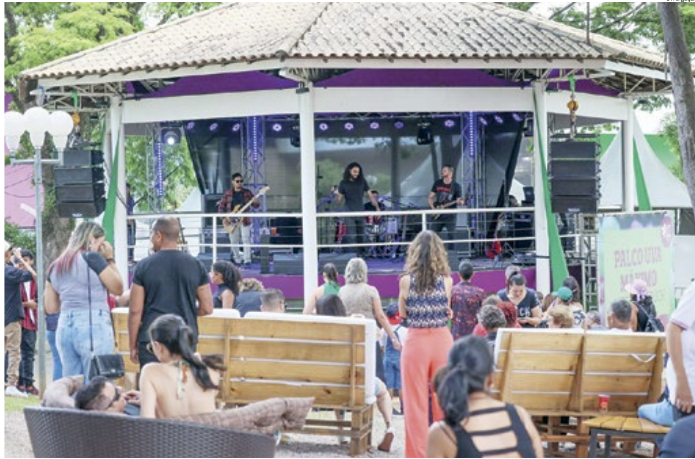
A 39ª Festa da Uva e 10ª Expo Vinhos chega ao último final de semana com muitas atrações culturais e gastronômicas

“Esse recorde de público reforça o sucesso da Festa da Uva como o principal evento do Agronegócio, Turismo e da Cultura de Jundiaí. E gostaríamos