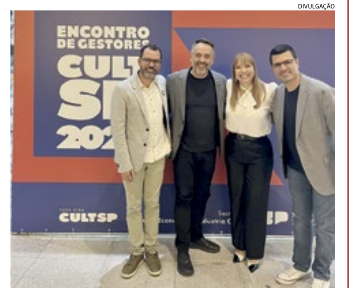
Membros da Cultura de Jundiaí em registro durante reunião