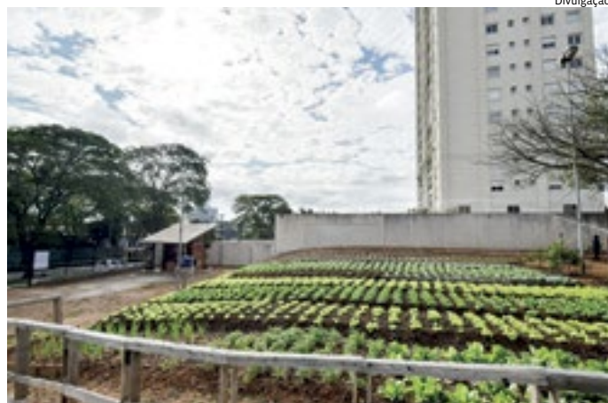
O encontro teve como objetivo mostrar a horta aos representantes