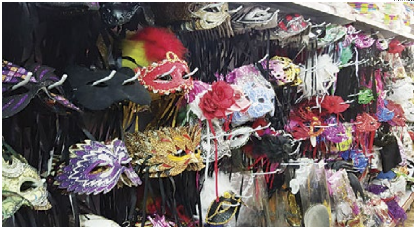
Além das fantasias, acessórios como máscaras, adereços, perucas coloridas e outros itens, são cruciais para as combinações carnavalescas

A proprietária conta que adereços de diabinho, gato, coelho, bombeiro, além de saias de tule, são as opções mais procuradas. “Os adereços são vendidos a partir de R$ 9,90. Tem opções para to-