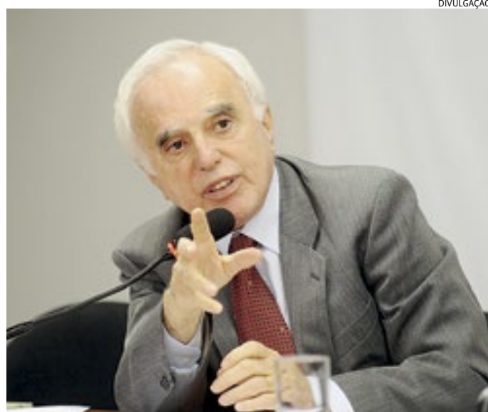
Embaixador faleceu na manhã de ontem (29), em Brasília, aos 84 anos