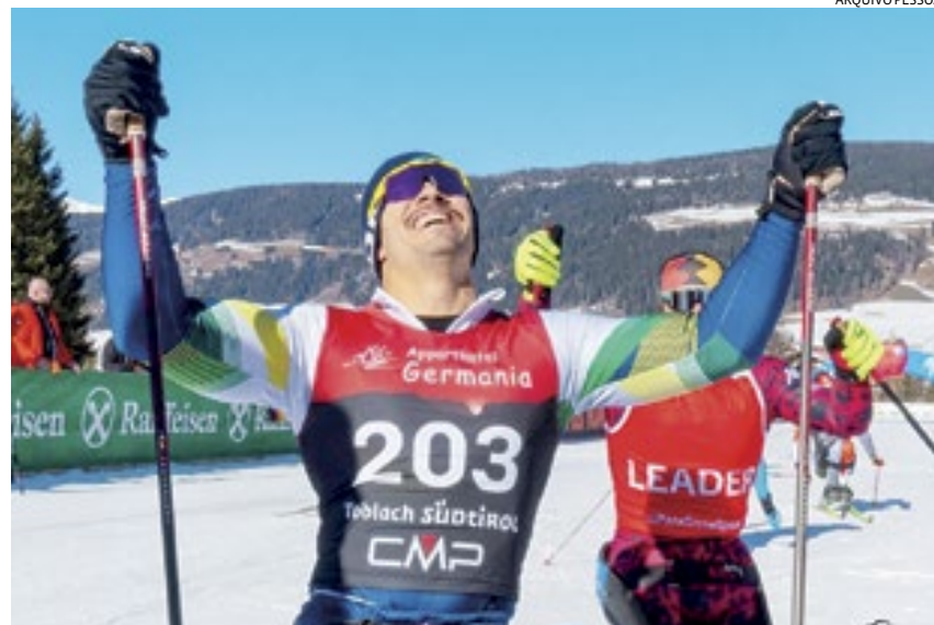
O atleta do Peama comemorou a conquista após bater na trave duas vezes

completar a corrida em 14 minutos e 15 segundos.