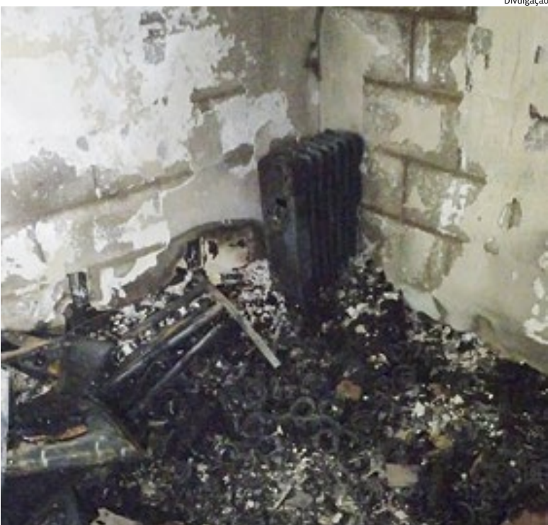
O incêndio, na madrugada, causou danos em pelo menos dois apartamentos

ta segunda-feira (29). O Corpo de Bombeiros foi acionado e concluiu o combate ao fogo. Nenhuma pessoa se feriu. Polícia 6