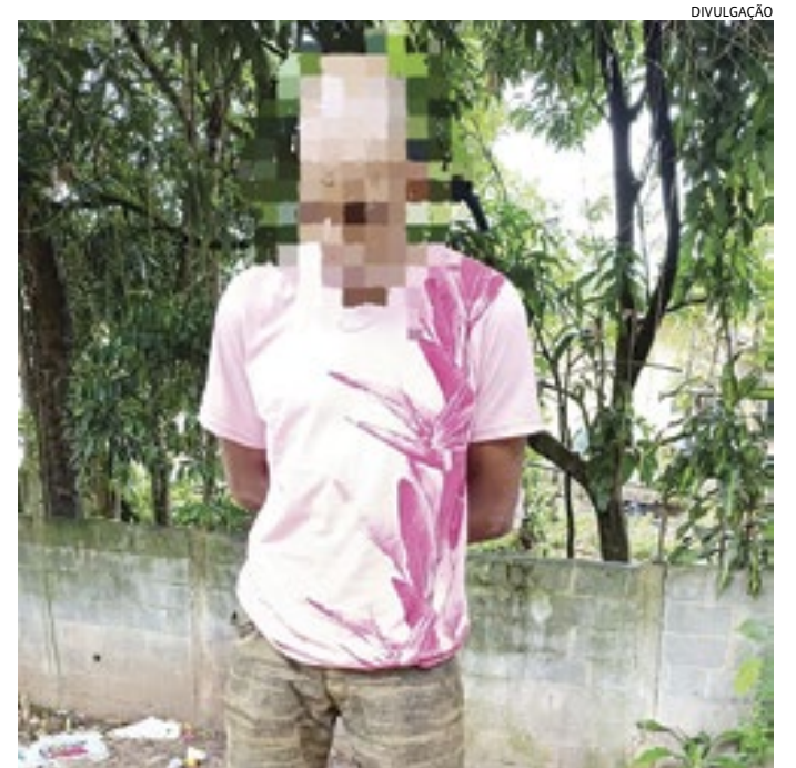
O traficante foi abordado junto com um grupo de usuários de drogas