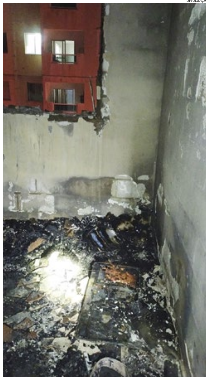
Além do que pegou fogo, outros dois também sofreram danos

Ainda de acordo com os Bombeiros, no imóvel foram encontrados dois gatos mortos - o fogo começou em um dos quartos, que ficou totalmente destruído. Não se sabe ainda as causas, uma vez que somente a perícia técnica poderá apontar com precisão. O dono do apartamento não estava no local e não houve feridos.