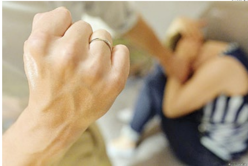
A mulher se recusou a entregar o aparelho e eles entraram em luta corporal; após isso, ela acionou a PM

Era por volta das 18h30, quando, segundo a vítima, o ex-marido foi até a casa dela e entrou no local, procurando pelo celular dela, pois queria conferir, para saber se ela estava se relacionando com outro homem. Ela se recusou a entregar e eles