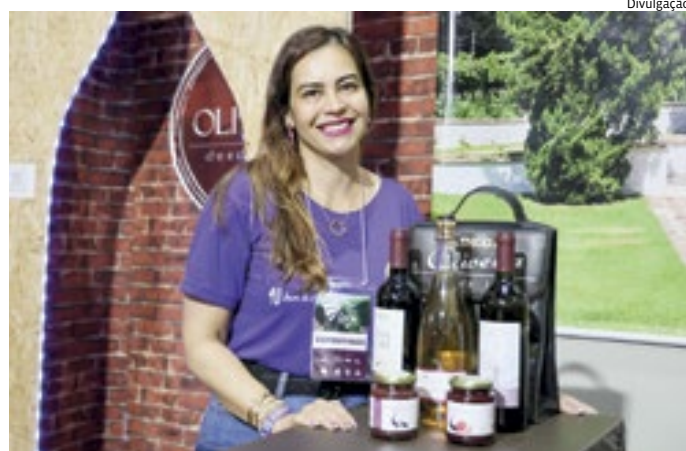
Espumantes de uva niágara rosada são novidades nesta edição

Os produtos de uva que já fazem parte do cardápio nesses 90 anos de festa. Neste ano é possível encontrar o pão de uva, geleia, bolos, sorvete de uva e vinho, brigadeiro de uva e de vinho, bombom de uva, pão de mel com ganache de vinho, crepe de uva, cervejas de uva e a coxinha de uva.