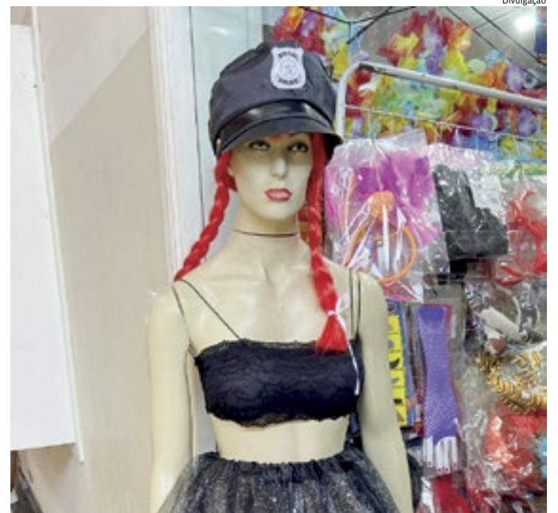
Comércios começaram as vendas em 15 de janeiro e estão repondo estoques

vendas de fantasias. Em uma delas, na Vila Arens, fantasias de personagens clássicos são as mais procuradas. Cidades 5