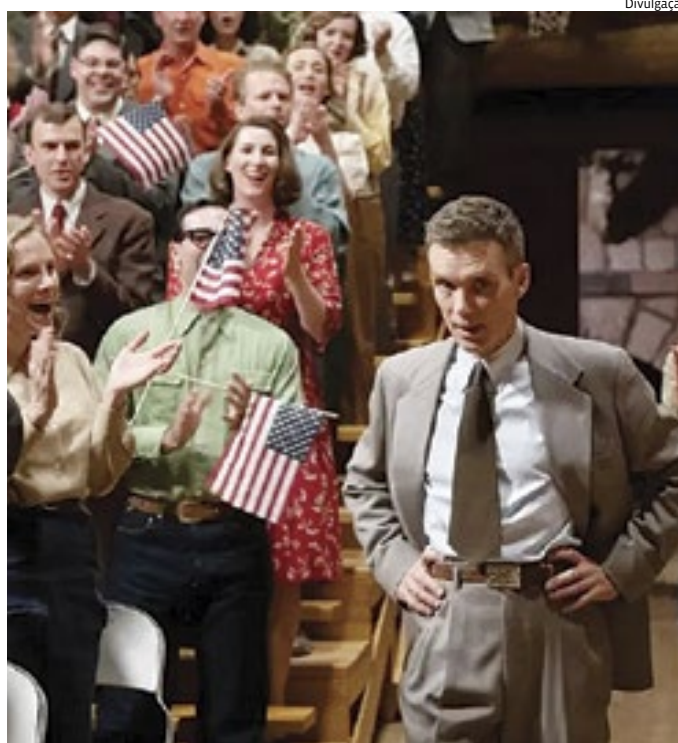
O filme "Oppenheimer" lidera a lista com 13 indicações; Barbie teve 8

No que diz respeito aos melhores filmes animados temos, dentre eles, o sucesso "Homem-Aranha Através do Aranhaverso", além do emocionante "O Menino e a Garça" e o "Nimona". Na categoria Melhor Curta de Animação temos, dentre