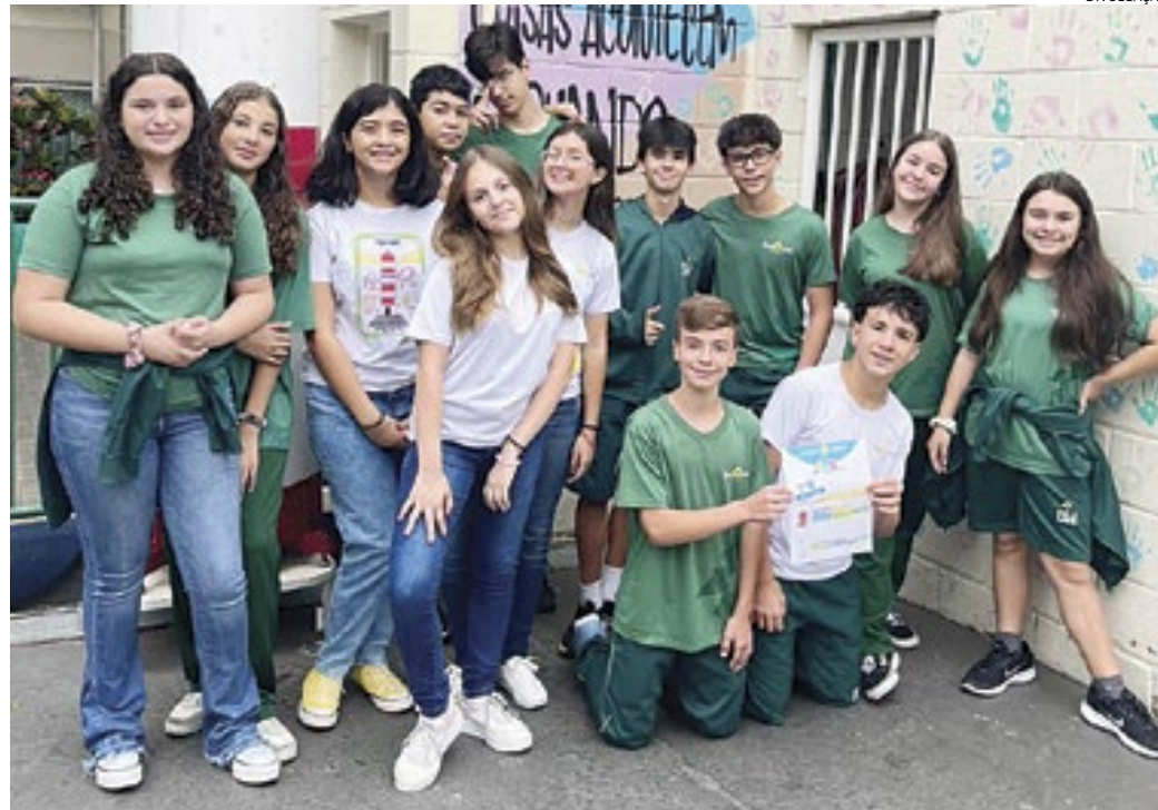
Uma série de fatores - geográficos, pedagógicos, tecnológicos e religiosos - permeiam a escolha

O método de ensino e o material didático são outros pontos relevantes diante da nova escolha. A família deve estar ciente de como será o processo de aprendizagem em cada faixa etária e a metodologia que será utilizada, pois, ain-