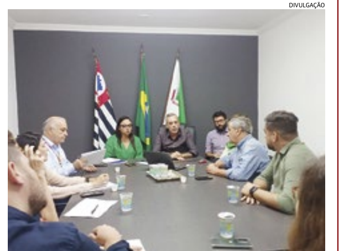
Prefeito fez reunião com empresa para discutir sobre o projeto