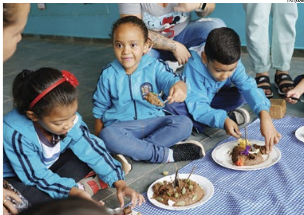
Segundo dia contará com apresentação de práticas, como projeto “Comidinhas com elementos da natureza”