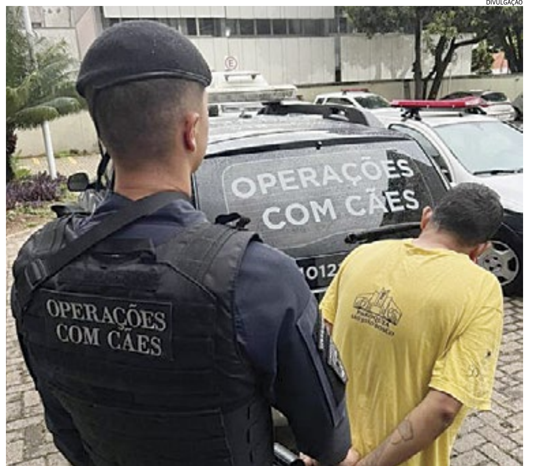
Ele foi levado para o Plantão Policial e, depois, para o sistema prisional, para continuar sua pena