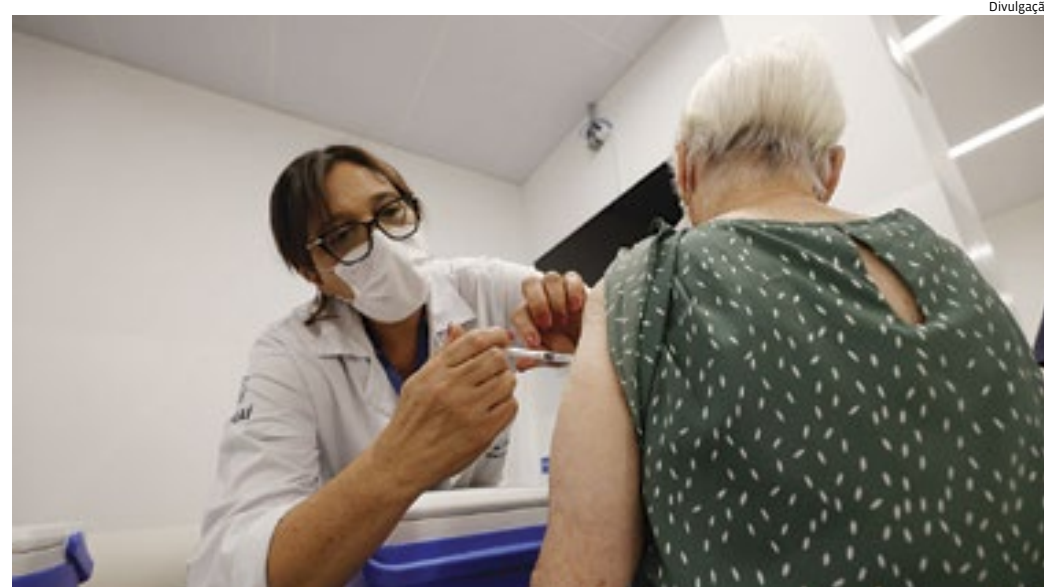
Considerando que a doença ainda é um problema de saúde pública, vacinação entra para o calendário