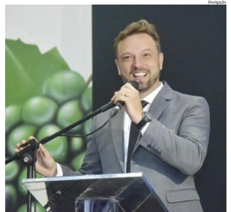
Divulgação Cavalin na posse: questões prioritárias, como Orçamento e Saúde, em pauta

NUBLADO Mínima 20° Máxima 25° RODÍZIO NA CAPITAL Placas finais 5 e 6