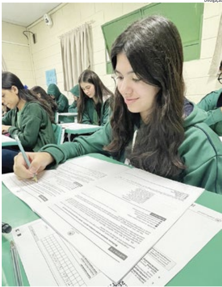
No Brasil há quase 180 mil escolas de educação básica, segundo Censo Escolar