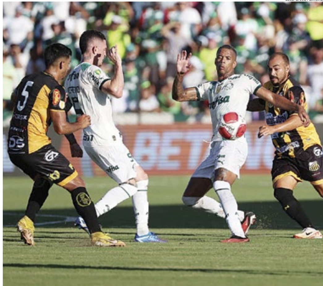
No Grupo B, o Palmeiras é o segundo colocado, com um ponto, atrás do Água Santa, que somou três

O atacante Endrick, que está com a seleção brasi-