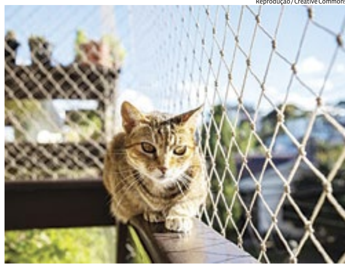
É importante ter telas em residências com gatos para impedir saídas

Os cães são curiosos e isso os estimula a conhecer novos espaços, por isso, a bióloga diz que passeios diários são importantes, bem como atividades com cheiros e cognitivas. “Eles buscam novos estímulos para interagir, outros cães, cheiros novos. Muita gente acha que, por ter um quintal grande, não precisa passe-