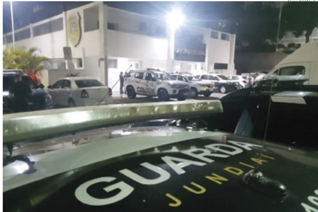
Os guardas municipais passavam pelo local logo após o crime e foram acionados pela vítima

Ao descer da moto, o rapaz percebeu que na verdade os ladrões não estavam armados e então empurrou os dois que já haviam mon-