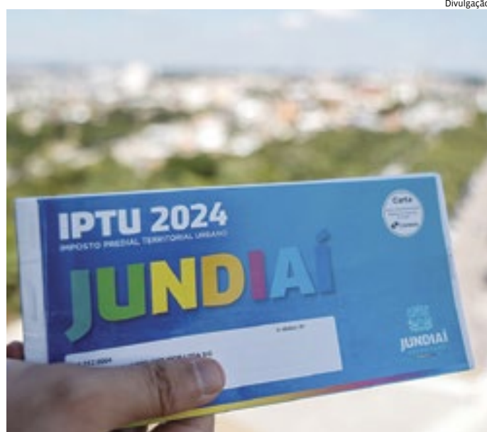
Carnê físico do IPTU já começou a ser distribuído na cidade

“O IPTU contribui para o financiamento e qualidade da prestação do serviço público na cidade. Reforço a todos os jundiáenses, ainda, a oportunidade de aderir ao IPTU Digital, para que recebam o carnê por e-mail. Fortalecer essa prática proporciona mais recurso no caixa da Prefeitura para investir em outras áreas, além de ser muito mais sustentável para o