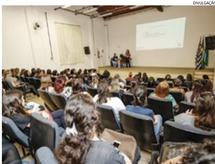
Profissionais que atuam com crianças com deficiências em encontro

A Prefeitura de Jundiá informou ontem (23) que uma falha no sistema do Governo Federal “gov.br” gerou instabilidade em alguns serviços prestados pelo Espaço Jundiá Empreendedora, no Maxi Shopping. A emissão de DAS (Documento de Arrecadação do Simples Nacional) e da Carteira de Trabalho Digital, além da abertura de MEI (Microempreendedor Individual), foram afetadas.