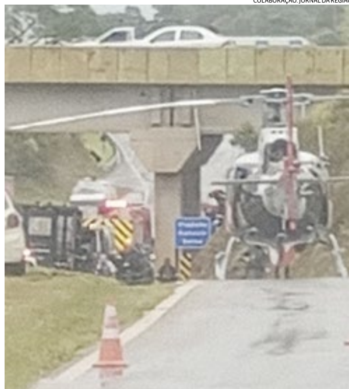
Até mesmo o helicóptero Águia, da Polícia Militar, foi acionado

Também foram enviadas viaturas do Corpo de Bombeiros e ambulâncias