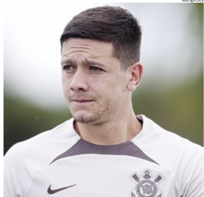
O clube enfrenta dificuldade para efetuar o pagamento por Garro

Dos reforços que ainda não estrearam, Rodrigo Garro ainda precisa aparecer no Boletim Informativo Diário (BID) da CBF para poder estreiar pelo Corinthians. Mano Menezes esperava contar