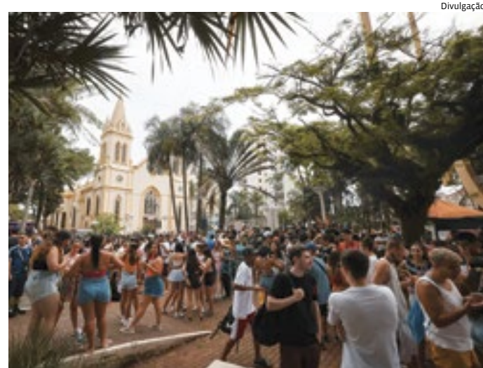
Programação completa pode ser consultada no site da Cultura

Com ordem a ser definida, o desfile inicia-se com a Corte da Alegria, seguida das seis escolas credenciadas e habilitadas – duas do grupo de Acesso e quatro do grupo Especial.