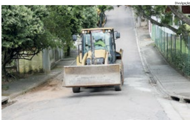
O investimento busca solucionar um problema trazido pela comunidade

Com investimento de R$ 2,2 milhões, as obras do novo sistema de drenagem no Traviú serão iniciadas nos próximos dias. O anúncio foi feito na segunda-feira (15). Cidades 4