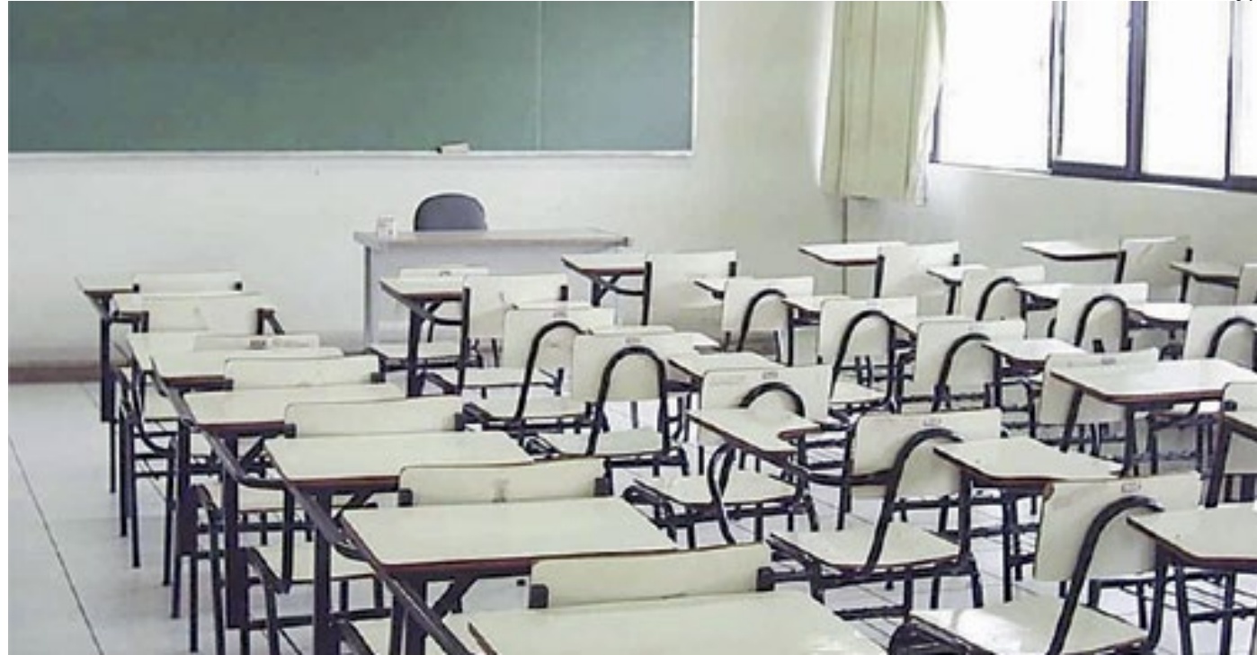
Segundo Ministério da Educação, evasão no ensino médio chega a 16%; primeiro ano é o que tem maior registro

Para ter acesso ao benefício, o aluno precisará ter frequência mínima, garantir a aprovação ao fim do ano letivo e fazer a matrícula no ano seguinte, quando for o caso.