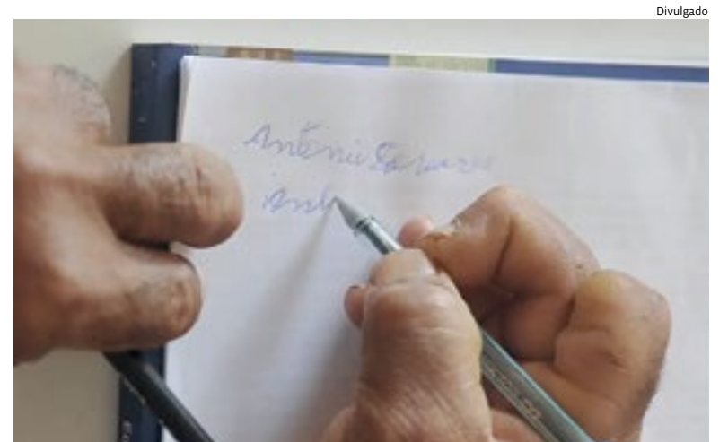
Ideia é levar conclusão da Educação Básica para quem não teve oportunidade

O Sesi de Jundiaí e Itu estão com 1.250 vagas gratuitas para a Nova Educação de Jovens e Adultos (Nova EJA) e EJA Profissionalizante, sendo 1 mil delas para Jundiaí. Cidades 5