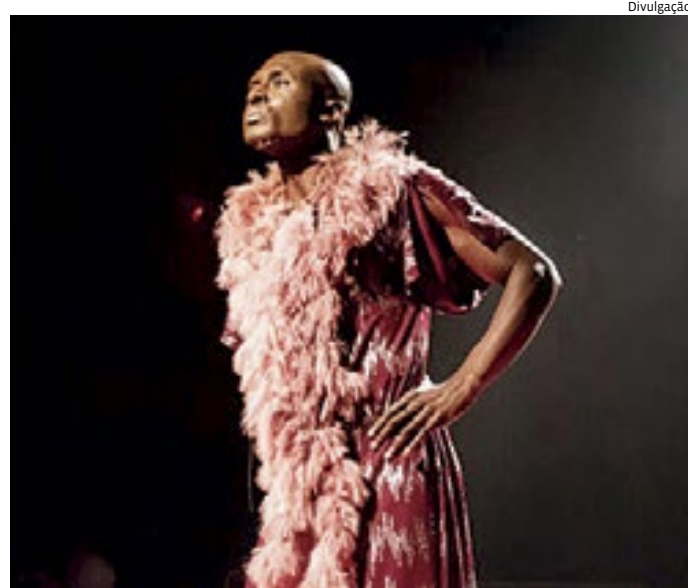
O espetáculo fala sobre família, sociedade e preconceito

SERVIÇO Os ingressos variam de R$ 12 a R$ 40 e podem ser adquiridos nas bilheterias do Sesc. Horário: 20h Duração: 75 minutos O espetáculo será do teatro do Sesc Jundiaí, localizado na Av. Antonio Frederico Ozanam, 6600 - Jardim Botânico.