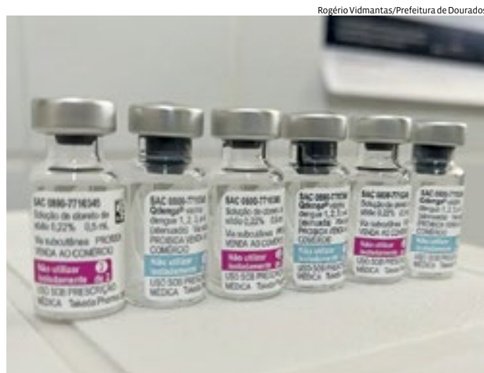
A vacina contra a dengue (Qdenga) começou a ser aplicada no Brasil

Neste ano, a combinação entre o fator climático, mais quente, e o ressurgimento dos sorotipos 3 e 4 da doença fazem com que o país estime, no pior cenário, chegar a 5 milhões de casos de dengue.