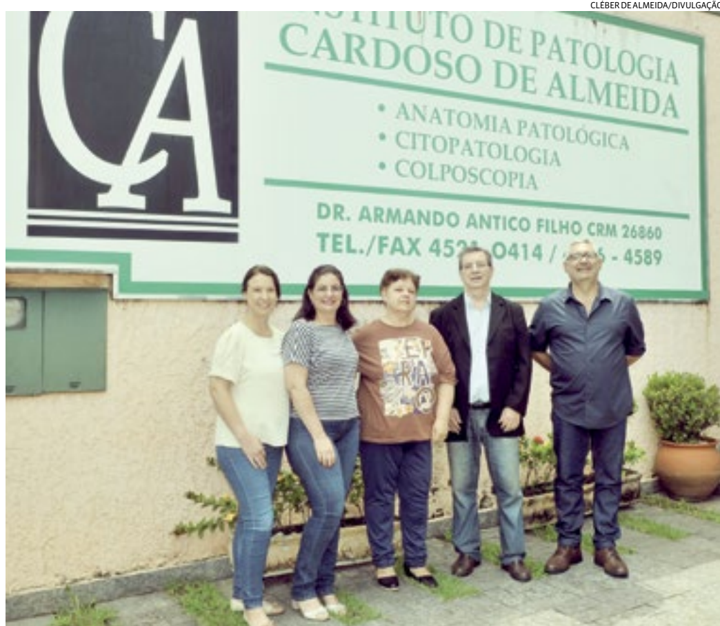
O laboratório Cardoso de Almeida é um dos maiores de Jundiaí e do estado de São Paulo