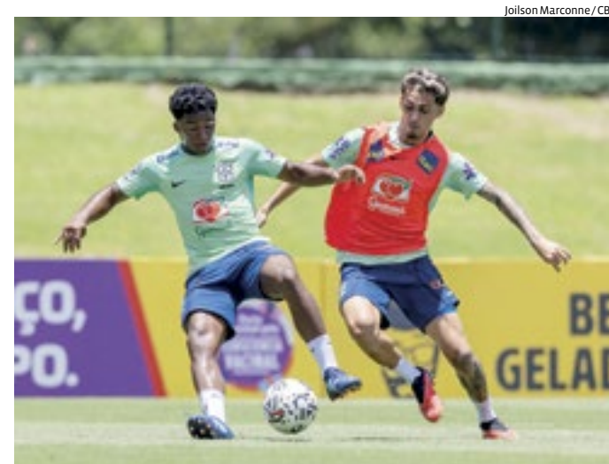
Atividade desta terça foi a última da seleção em solo brasileiro