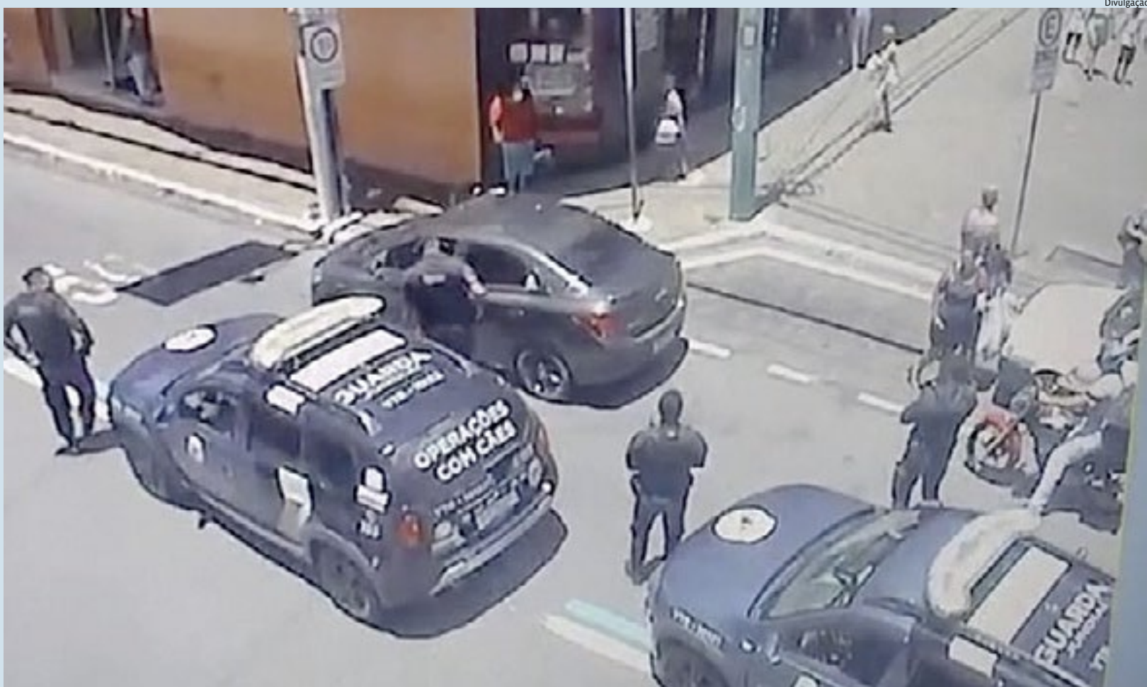
Com diferentes viaturas, os guardas municipais fizeram a abordagem no Centro de Jundiaí após suspeita de que o veículo transitava com suas placas clonadas

que se tratava de um clone. Aos guardas o homem disse que havia adquirido o carro há três meses, em Campinas. Polícia 6