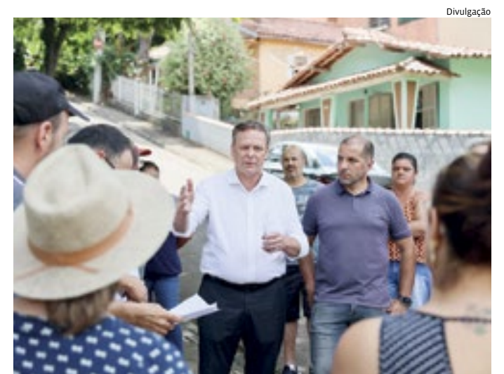
Gestores anunciaram o início das obras nos próximos dias