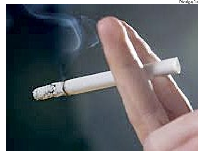
OMS apela à necessidade de combater 'interferência do tabaco'

Sônia Guajajara ministra dos Povos Indígenas, ontem (16), sobre crise humanitária na Terra Indígena Yanomami