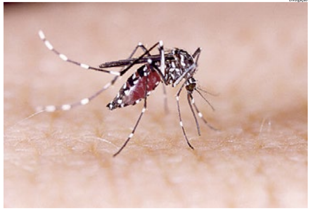
A vacina Qdenga abrange os quatro sorotipos da doença, transmitida pelo mosquito Aedes aegypti