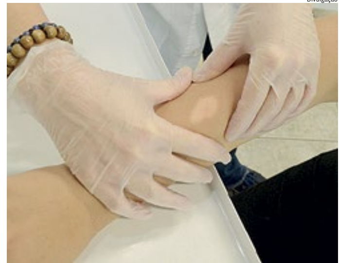
Avaliação de mancha branca na pele, que está entre os sintomas

A transmissão ocorre por meio de contato próximo e contínuo com o paciente não tratado – principalmente vias