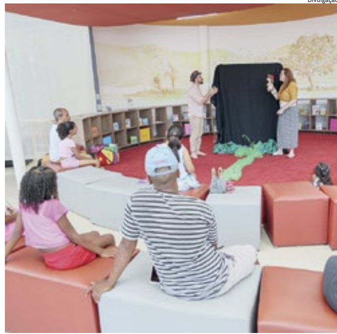
"Bambino e a Uva" estreou a programação de férias na Biblioteca

E na Fábrica das Infâncias Japy (rua Lacerda Franco, 175 – Vila Arens), a programação de oficinas gratuitas vai de terça a sexta-feira, até o dia 26 de janeiro. São oficinas de torres de bambu, contação de