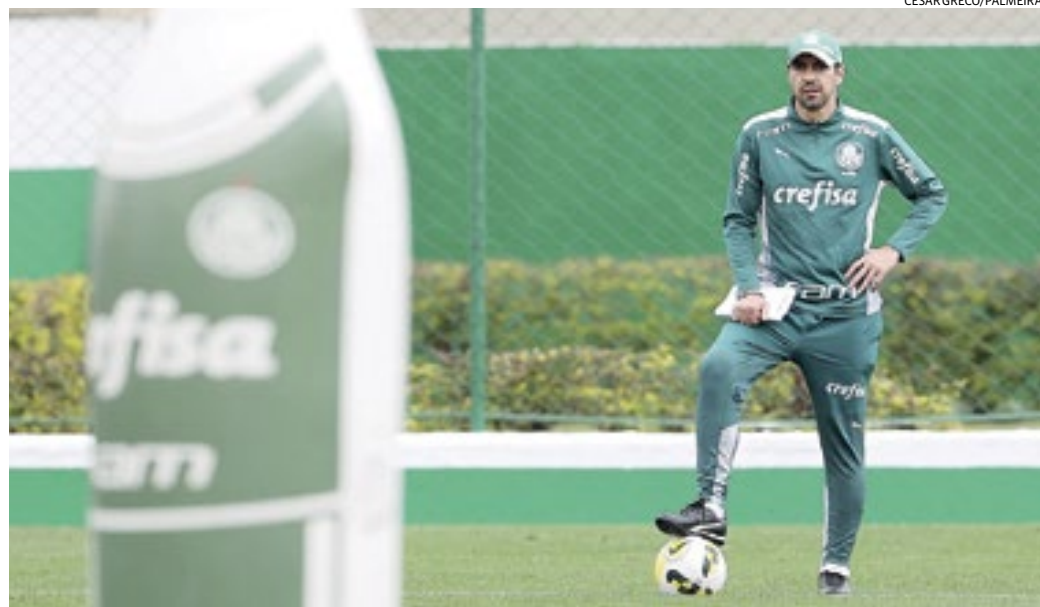
Abel Ferreira chegou ao Verdão em 2020 e se tornou um dos maiores treinadores da sua história

Abel Ferreira chegou ao Verdão em novembro de 2020 e rapidamente se tornou um dos maiores treinadores de sua história. São nove títulos em pouco mais de três anos, uma lista que inclui dois triunfos