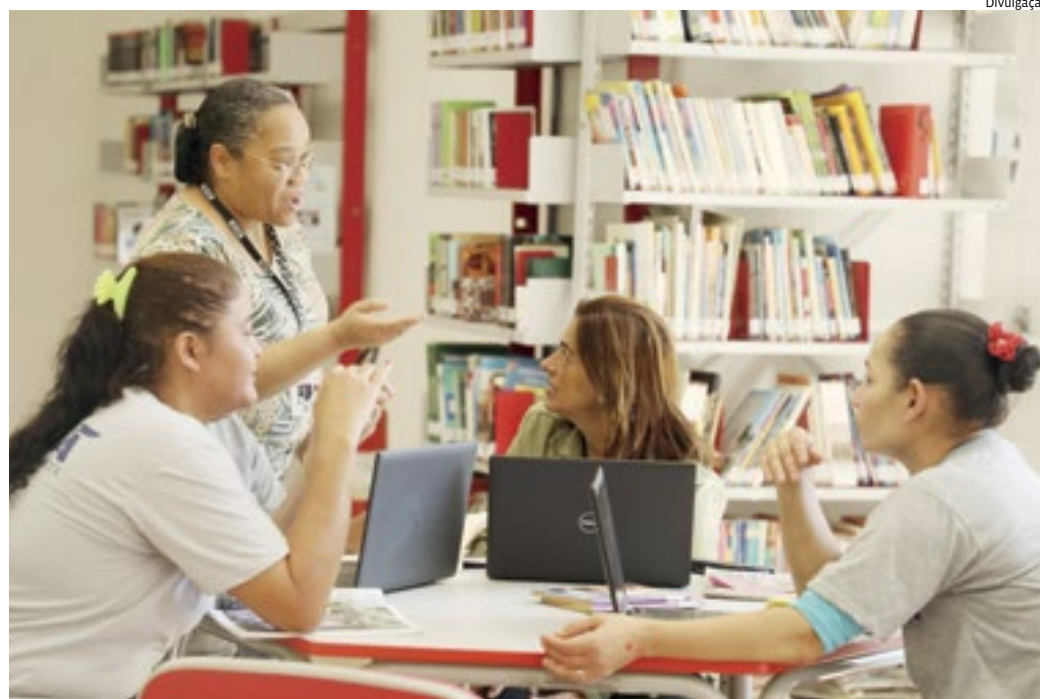
Objetivo é proporcionar a conclusão da Educação Básica para quem não teve oportunidade de finalizá-la

Um dos diferenciais da Nova EJA e da EJA Profissionalizante é o Reconhe-