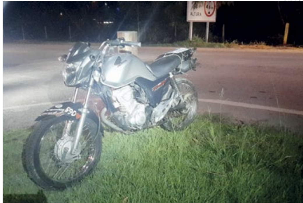
A moto utilizada pelo adolescente, que confessou a tentativa de roubo ao motorista

Era por volta de 22h, quando o motorista de transporte coletivo estava se preparando para iniciar seu percurso diário. Neste momento o adolescente emparelhou sua motocicleta ao