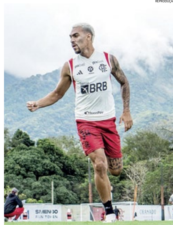
Timão alinha empréstimo de lateral para concorrer com Fagner