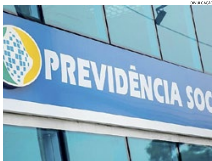
Categoria reivindica reajuste salarial de 23% e outras melhorias