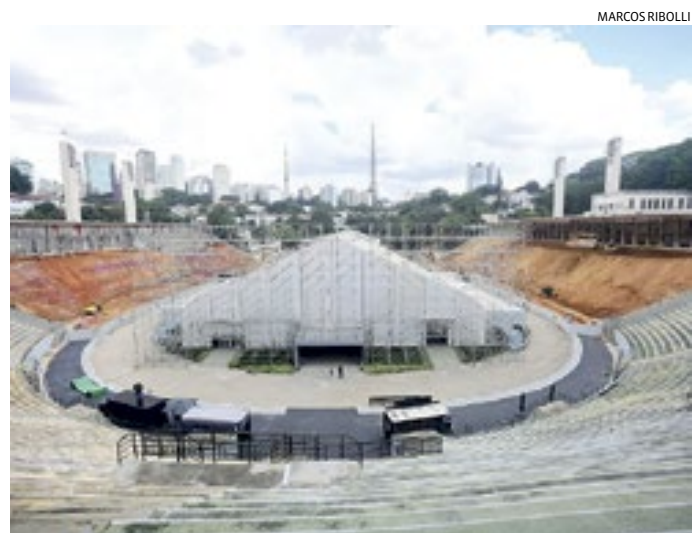
O estádio segue em obras e não terá condições de receber a partida

A concessionária informou que as obras de modernização e restauro “seguem em ritmo acelerado” e que a reabertura do Pacaembu se dará em fases ao longo do primeiro semestre de 2024.