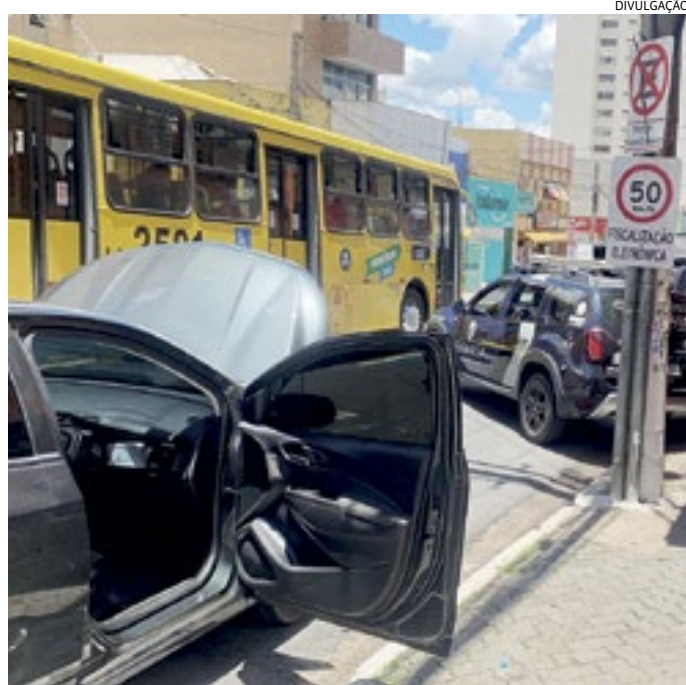
O Prisma foi apreendido na delegacia e será periciado

O caso foi registrado na Central de Flagrantes, onde ele foi ouvido e liberado na condição de investigado.