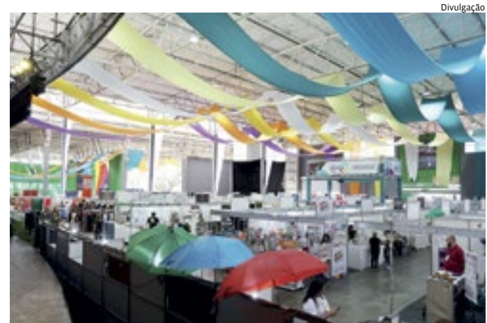
Em 2024, a Prefeitura de Jundiaí vai realizar mais duas edições da FENS

LINK PARA PRÉ-INScrição: https://negocios.jundiaisp.gov.br/