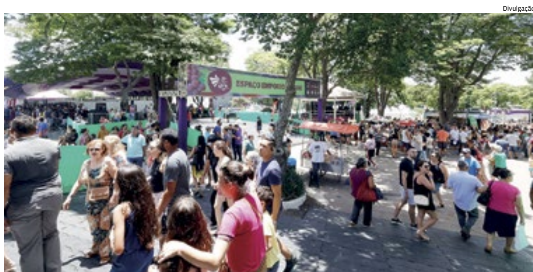
Foram registrados visitantes de 196 cidades, 22 estados e Distrito Federal, reforça potência do evento