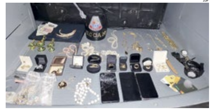
Os objetos de valor, furtados da residência, foram recuperados

Os quatro suspeitos foram conduzidos ao 30º D.P. (Tatuapé), onde o caso foi registrado como captura de procurado, localização/apreensão de veículo e objeto e furto.