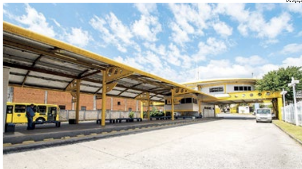
As três empresas que operam em Jundiaí apresentaram melhor preço para a extensão do contrato

Os tutores de cães e gatos interessados em castrear seus animais de estimação gratuitamente podem fazer o cadastro pelo site do DEBEA ou pelo aplicativo APP Jundiaí, no serviço Cadastro de Animais para Castração. Podem ser inscritos fêmeas e machos de cães e gatos, com idades entre três meses e oito anos, e peso acima de um quilo e meio. Para o serviço, serão chamados os tutores que estão