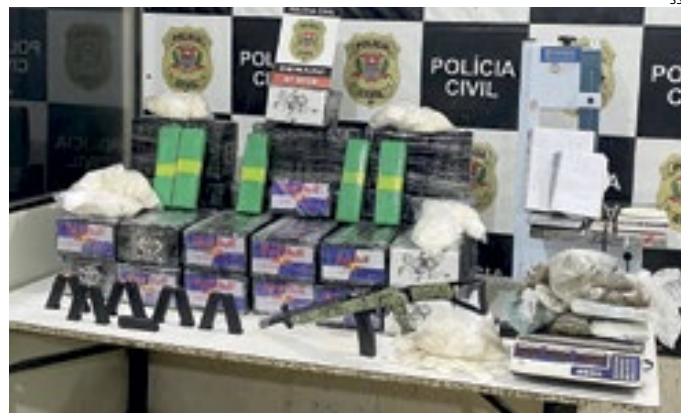
A droga seria distribuídas a traficantes da zona sul de São Paulo

Durante vistoria, foram encontrados dentro do carro 125 tijolos de cocaína. O suspeito disse aos policiais que tinha sido contratado para realizar o transporte