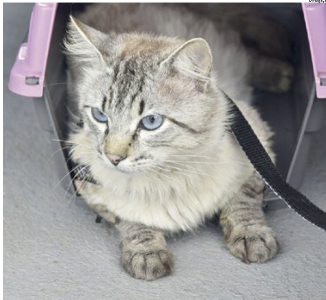
Dois mutirões de castração de cães e gatos estão programados para este mês

cadastrados no sistema do Departamento, de acordo com o número de vagas disponíveis. Depois do cadastro, as pessoas devem aguardar o contato do órgão.