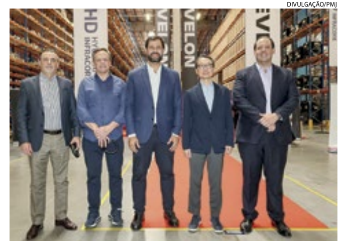
Prefeito e gestores com CEO global da Hyundai Infracore