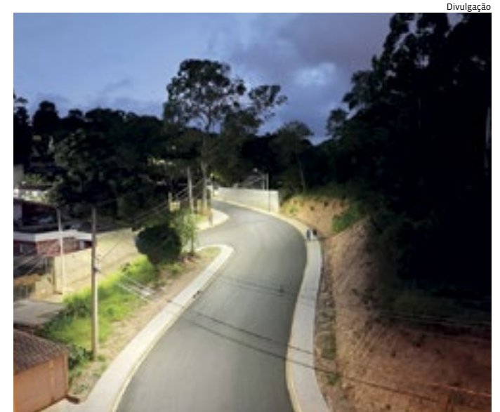
Estrada da Boiada após instalação da iluminação em LED

Travessa da avenida Nami Azém, que foi pavimentada em 2023, a rua Ideal Padrão está com 70% de execução. Os investimentos são de R$ 981 mil, também com recursos próprios. O aporte contempla a implantação de 680 metros de redes de galeria, que irão auxiliar no escoamento da água em períodos mais críticos de chuva, além da aplicação de 4.168 m v.13 de asfalto ecológico.