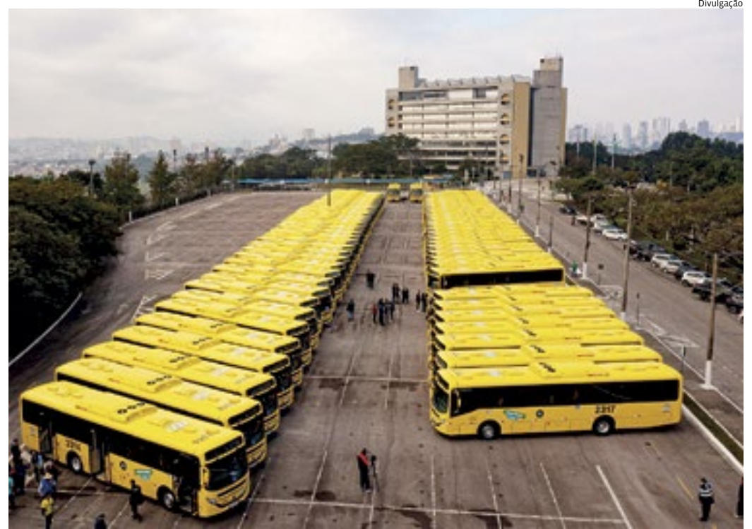
A operação do transporte público de Jundiaí segue até o meio do ano, mesmo com o término do contrato

Adiantando um dos pontos que a nova concessão deve cumprir, o gestor de Mobilidade e Transporte informa que os atrasos devem ser sanados. "Temos espaços, entre uma viagem e outra, muito grandes. Tem pessoas que ficam no pon-