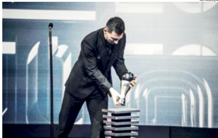
Lionel Messi superou os craques Haaland e Mbappé e levou o troféu pela oitava vez

A pintura ocorreu no fim do primeiro tempo da partida em questão. Após