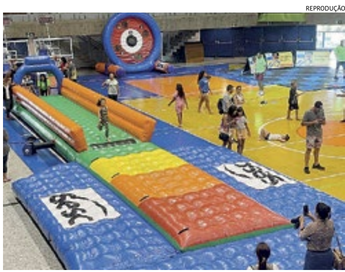
As atividades são gratuitas e para pessoas de todas as idades

Scarpa pediu na Justiça para penhorar os bens de Willian Bigode e bloquear 30% de seu salário duas vezes, mas teve as solicitações negadas. O meia, agora jogador do Atlético-MG, tem como objetivo reaver ao menos parte do valor investido.