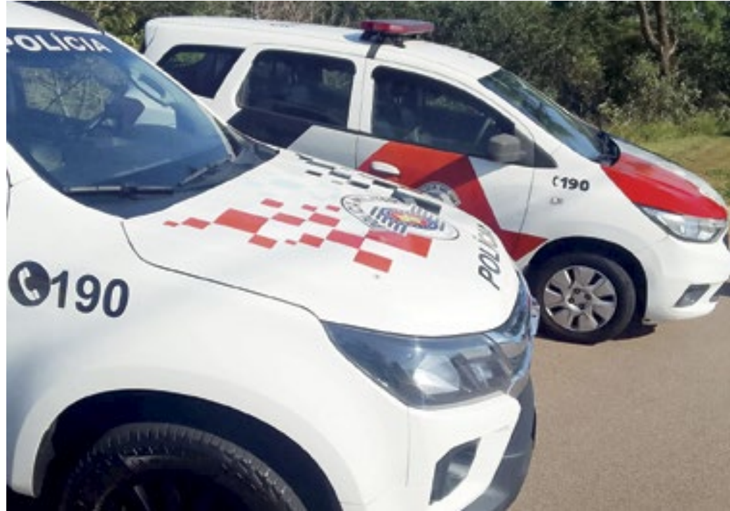
Os PMs precisaram entrar na mata para prender o homem, que confessou o crime de tráfico de drogas

Os policiais desembarcaram da viatura, recolheram sacola e se embre-