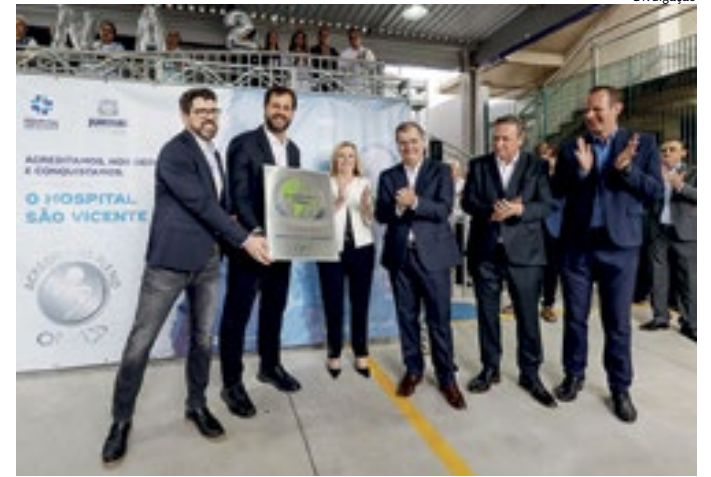
Evento reuniu autoridades, colaboradores e parceiros do Hospital São Vicente