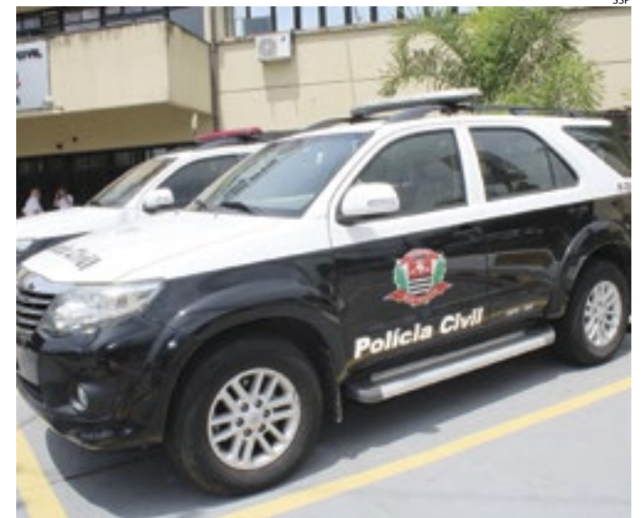
Policiais do Deic conseguiram prender um dos líderes da facção

Durante as investigações realizadas por um ano e meio, os agentes apuraram que o indiciado criava perfis fakes em redes sociais para atrair seus alvos, e em seguida mandava menores atrás das vítimas. Esses menores também eram