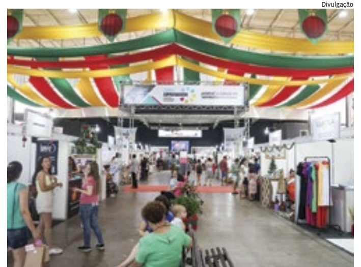
Dois edições serão realizadas neste ano: em abril e outra em agosto

A quinta edição da FENS será nos dias 5, 6, 7, 12, 13 e 14 de abril. Já a sexta edição acontecerá nos dias 23, 24, 25, 30, 31 de agosto e 01 de setembro. Às sextas, a feira funcionará das 12h às 22h; aos sábados, das 10h às 22h; e nos domingos, das 10h às 20h. O local é o Parque Comendador Antônio Carbonari, o "Parque da Uva", que também conta com atrações musicais e artísticas, praça de alimentação, recreação e brincadeiras para as crianças.