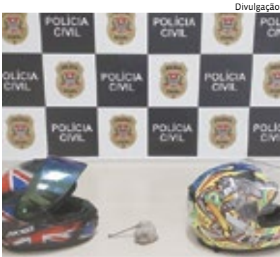
Uma grande onda de furtos no último mês chamou a atenção da delegacia

Dois homens moradores na região de Perus, em São Paulo, foram detidos por guardas municipais em Jundiáí, a pedido da Delegacia de Investigações Gerais (DIG), após a moto em que eles estavam ter sido identificada anteriormente, durante investigações, sendo usada durante alguns furtos e moto na cidade. Na sede da DIG eles confessaram que cometeram alguns furtos em Jundiáí e região durante o mês de dezembro. Polícia 4