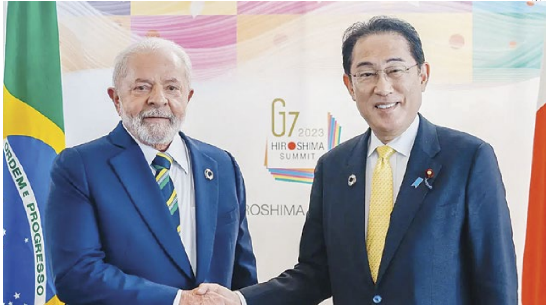
O presidente Luiz Inácio Lula da Silva conversou com o primeiro-ministro do Japão, Fumio Kishida sobre a possibilidade de um acordo comercial entre o Mercosul e o Japão

“O presidente Lula agradeceu o convite que recebeu de Kishida no ano passado para participar [como convidado] da cúpula do G7 [grupo de sete das maiores economias do mundo], em Hiroshima, e manifestou vontade de que o Japão esteja envolvido em todas as instâncias de discussão do G20 este ano”, disse a Presidência, em comunicado.