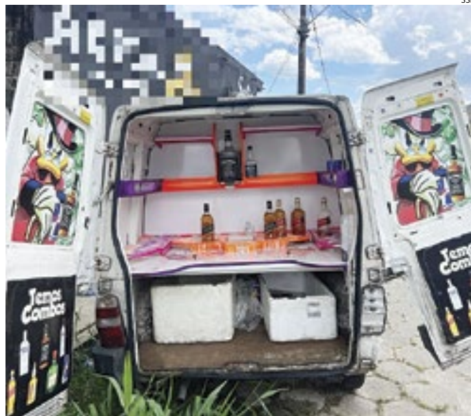
O veículo identificado pela polícia funcionava como 'biqueira' móvel

Os investigadores apuraram informações que um veículo era usado pelo trio como uma adega ambulante e que os produtos eram armazenados no interior do automóvel. Assim que localizaram o veículo, os policiais civis o abordaram e nele apreenderam 19 garrafas de destilados falsificados, oito garrafas de uísque vazias, um galão com 20 litros de