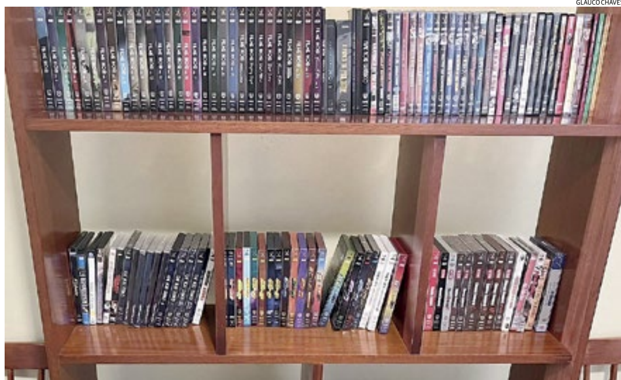
A coleção de DVDs e Blu-Rays de Arabaci Sciamarelli, que mora em Jundiáí e compra mídias físicas há 20 anos

tar aparelhos leitores desse tipo de mídia, não mais fabricados no Brasil. Cultura & Théo 7