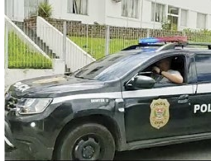
A DIG identificou a moto usada pelos criminosos e pediu ajuda à GM

Ainda de acordo com o delegado, "pelo menos cin-