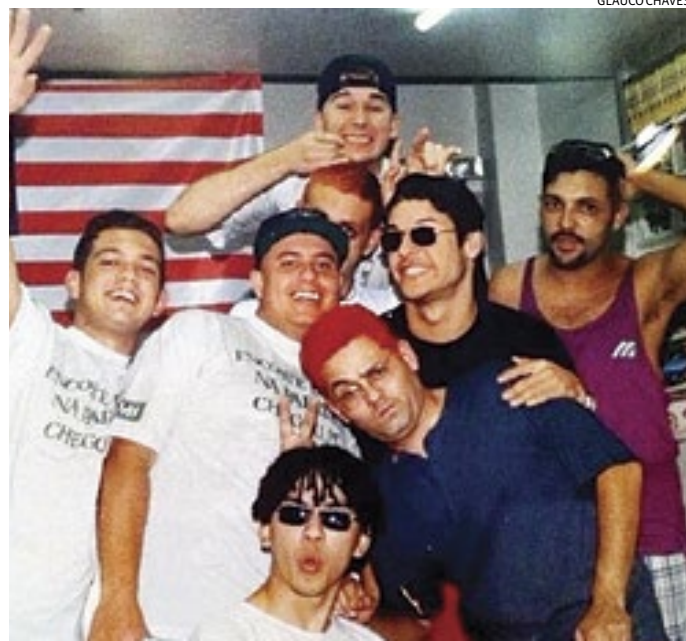
Funcionários da Studio 13 com membros dos Mamonas Assassinas

Segundo o vocalista, a interação com os Mamonas durante a organização da tarde de autógrafos foi incrível. Apesar da fama recente, eles eram acessíveis e descontraídos. "Eles foram todos simpáticos, alegres e divertidos. Nesse dia, o Maxi parou porque ninguém esperava tamanho sucesso de uma tarde de autógrafos. Além disso, os meios de comunicação da