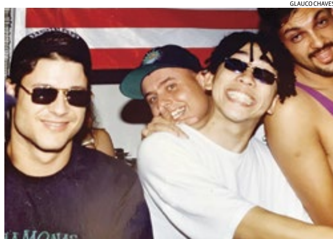
Os Mamonas Assassinas lotaram o Maxi Shopping para autógrafos