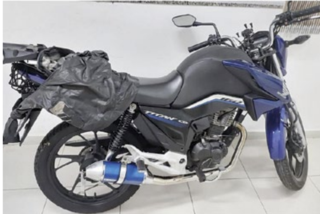
A moto utilizada pelos suspeitos foi apreendida pela Polícia Civil; as investigações continuam

Segundo o delegado, uma grande onda de furtos no último mês na região chamou a atenção da delegacia especializada, que passou a investigar. Através de imagens a polícia conseguiu identificar