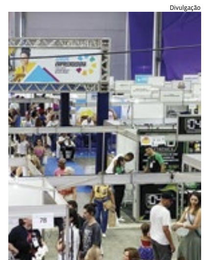
Dois edições serão realizadas neste ano: uma em abril e a outra em agosto