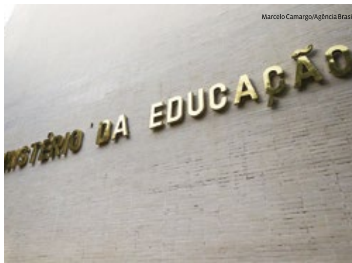
Em 2022, o caso levou à exoneração do então ministro Milton Ribeiro

Segundo o processo disciplinar da CGU, o indiciado recebeu R$ 20 mil por indicação de um dos pastores. Além da exoneração do cargo de confiança, Musse fica proibido de ser indica-