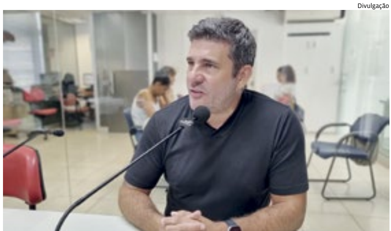
Basson no programa Difusora 360, onde também falou de facções no Equador

ção prevista pelo Código Penal, que, segundo ele, tem feito a impunidade aumentar. Política 3