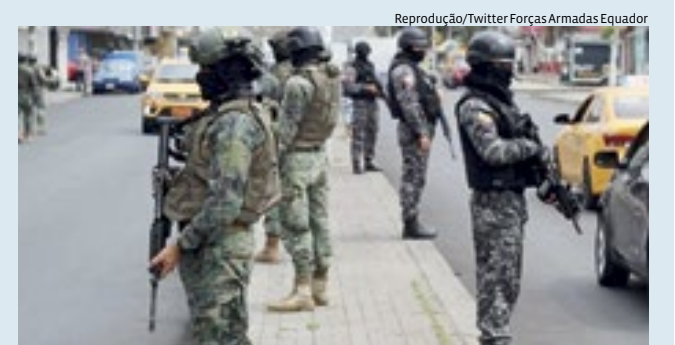
País está em ‘conflito armado interno’ com onda de violência

O Equador pretende cortar gastos em cerca de 2% do Produto Interno Bruto (PIB) enquanto o país enfrenta crises fiscais, de dívida e de segurança.