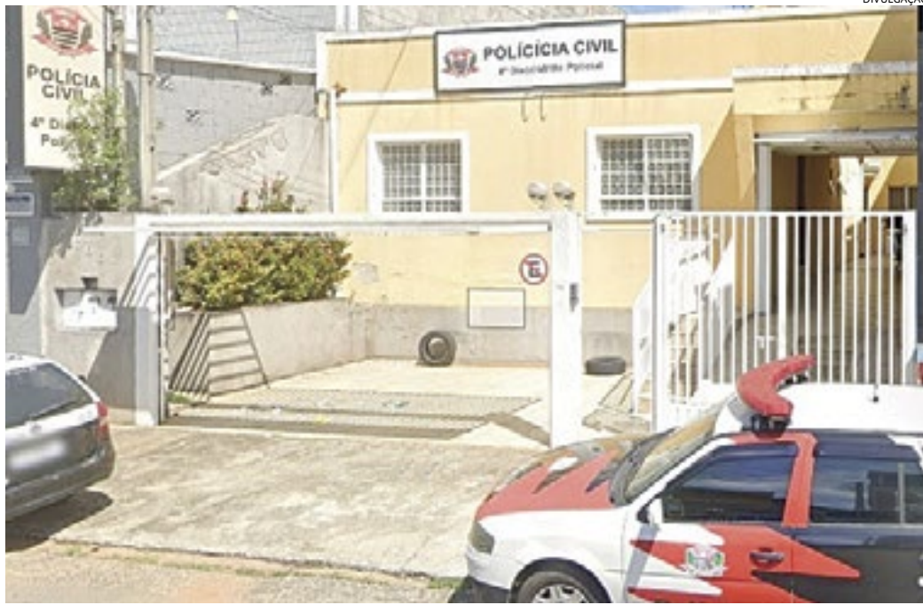
O caso possivelmente será investigado pelo 4º DP de Jundiaí, área onde ocorreu o roubo