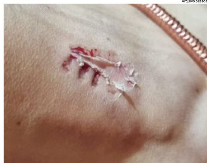
É possível ver a marca dos dentes do cão no pé da mulher atacada

tral funciona em um prédio alugado na avenida Antonio Segre, com valor mensal de R$ 6.720. Em junho do ano passado, o JJ questionou a prefeitura sobre o uso de um prédio alugado para abrigar a UBS, enquanto o prédio que foi anunciado para receber o equipamento de saúde, na rua Barão, permanecia fechado.