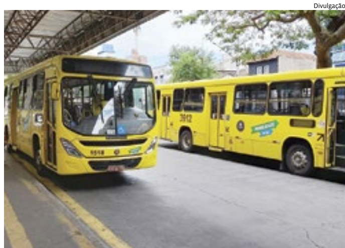
Ônibus urbanos sairão do Terminal Central para o Parque da Uva

A Festa da Uva terá mais de 800 atrações e cerca de 500 artistas locais. O evento marca ainda a primeira safra após certificação de Indicação Geográfica (IG), na categoria Indicação de Procedência, expedido pelo Instituto Nacional de Propriedade Industrial (INPI).