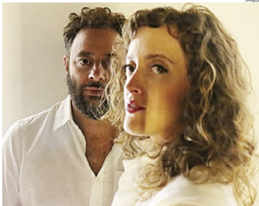
Eles apresentam as canções do álbum “João Gilberto” (1973) no show “Melhor do que Silêncio”

Os ingressos estão à venda no site e nas bilheterias da rede Sesc e custam de R$ 12 a R$ 40.