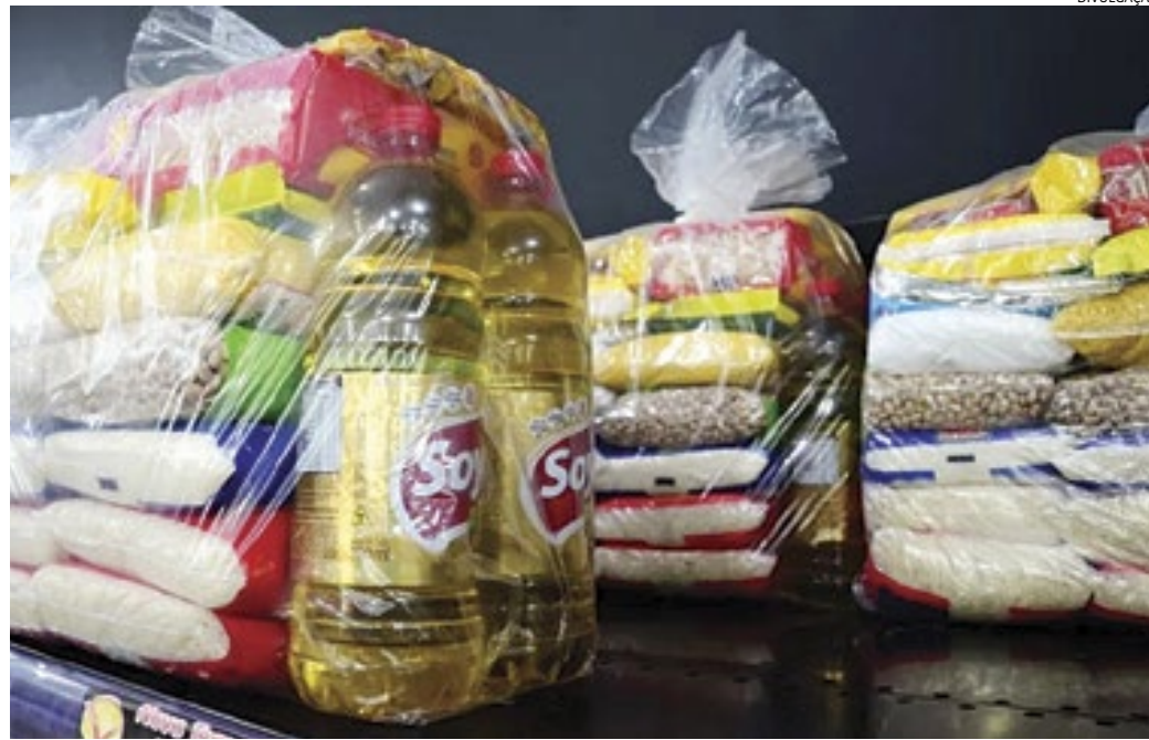
Em distribuidoras especializadas no fornecimento de cestas básicas, o valor médio do item é R$ 130

Normalmente, a cesta básica em Jundiaí é composta por 19 itens, entre eles: arroz, feijão, farinha