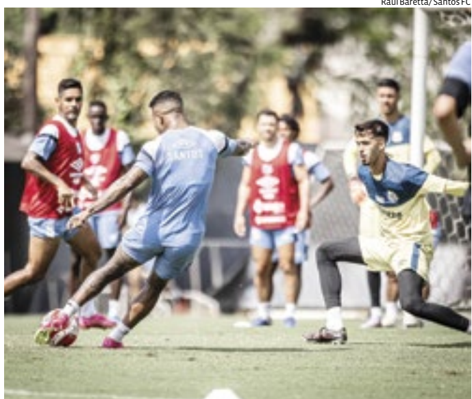
O treinador esboçou o time com sete reforços entre os titulares