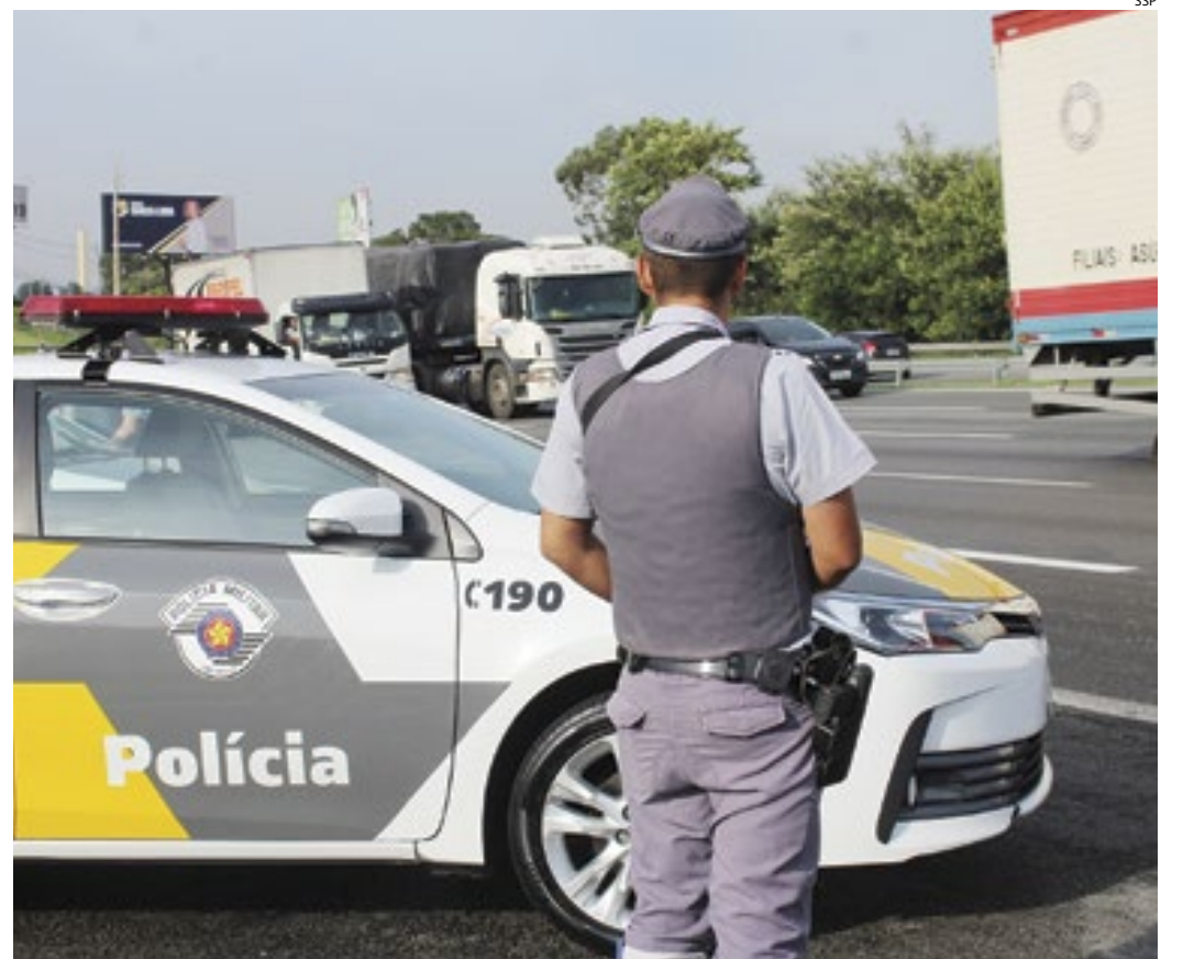
As ações ocorreram nas rodovias estaduais e também resultaram em centenas de prisões

Também foram aplicadas 4 milhões de multas e aplicados 1,5 milhão de testes com etilômetro, sendo 68 mil autuações a motoristas por ingerir bebida alcoólica. No total, foram 53,2 mil ocorrências atendidas pela Polícia Militar Rodoviária em 2023.