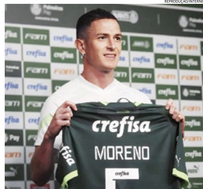
O meio-campista de 24 anos projetou uma parceria com Zé Rafael

O jogador de 24 anos assinou contrato com o Palmeiras até dezembro de 2028. O Alverde pagará 7 milhões de dólares (cerca de R$ 34 milhões na cotação atual) de forma parcelada ao Racing, com mais 1 milhão de dólares (R$ 4,9