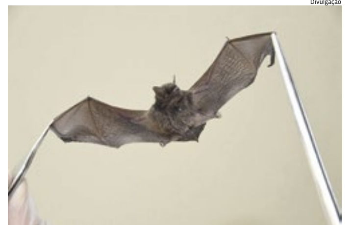
Morcegos são animais protegidos por lei, devendo ser preservados

Outra medida necessária é que os tutores de cães e gatos atualizem, anualmente, a vacina antirrábica dos seus animais.