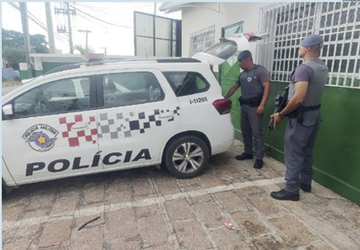
Segundo a Polícia Militar, o bandido foi preso por acaso, quando seus dados foram consultados em uma ocorrência

(9). De acordo com a PM, as decapitações ocorreram durante uma ou mais rebeliões, dentro de um presídio. Polícia 4