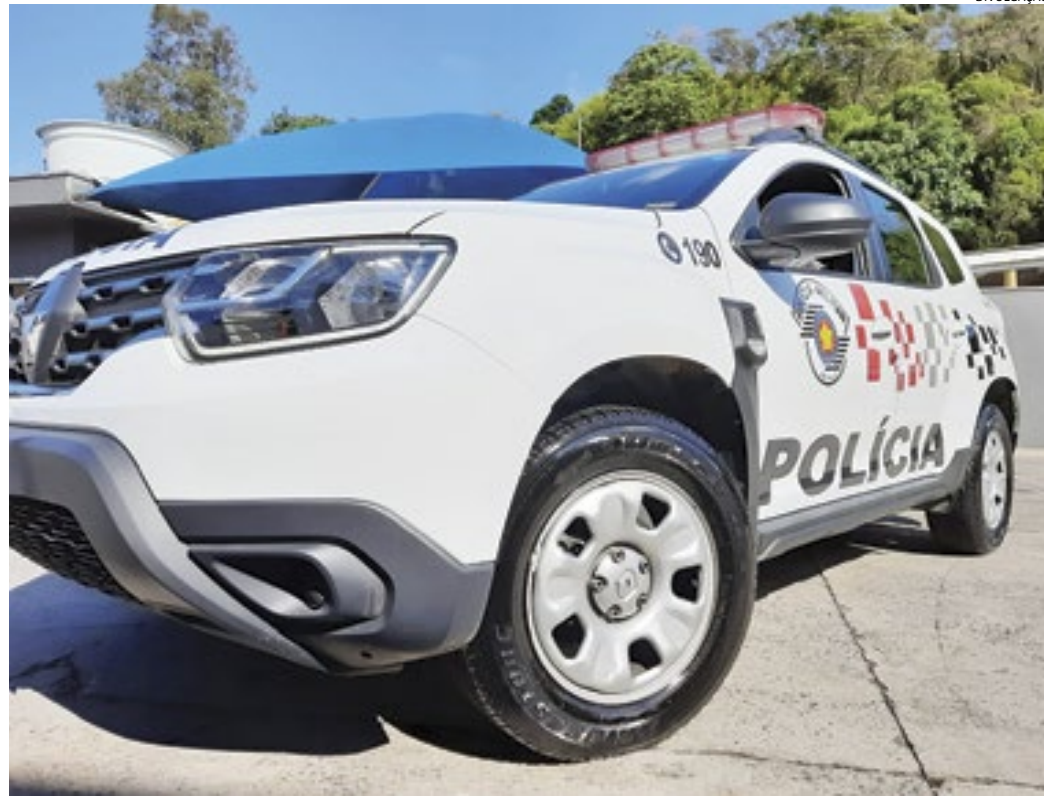
O criminoso estava observando atendimento a uma ocorrência, quando foi solicitado para qualificação

Segundo a Corporação, o bandido foi preso nesta terça-feira, por acaso, ao ser solicitado para qualifica-