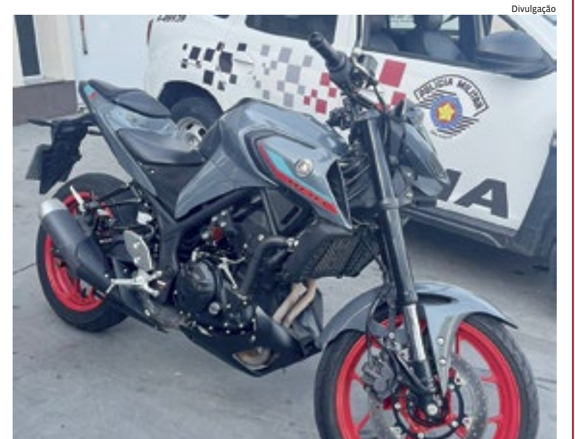
Após a detenção do adolescente, a moto foi devolvida ao proprietário

via sido roubada pouco tempo antes, em Jundiáí. Ele foi identificado pela vítima como um dos autores do crime. Polícia 4