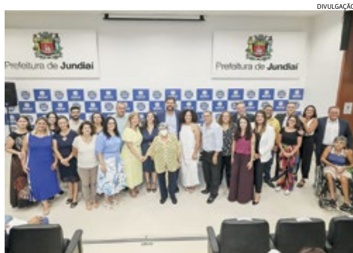
Cerimônia de posse contou com presença do prefeito e autoridades