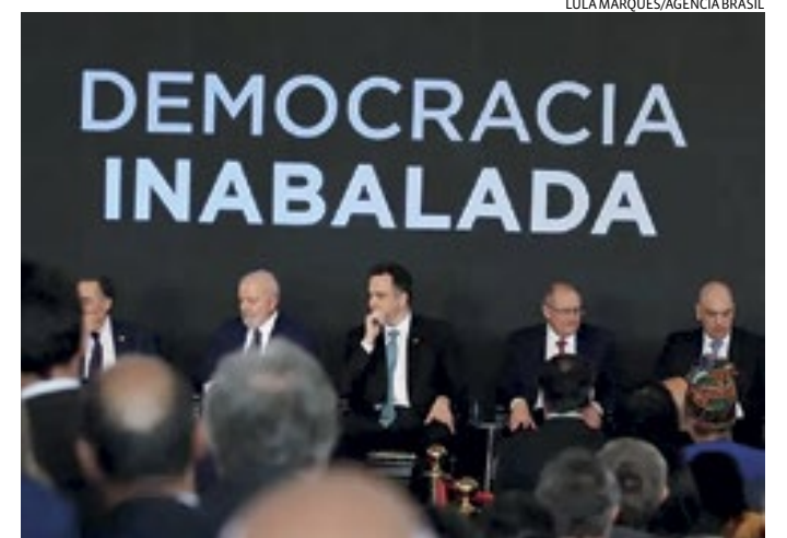
Ministro esteve presente em evento em defesa da democracia