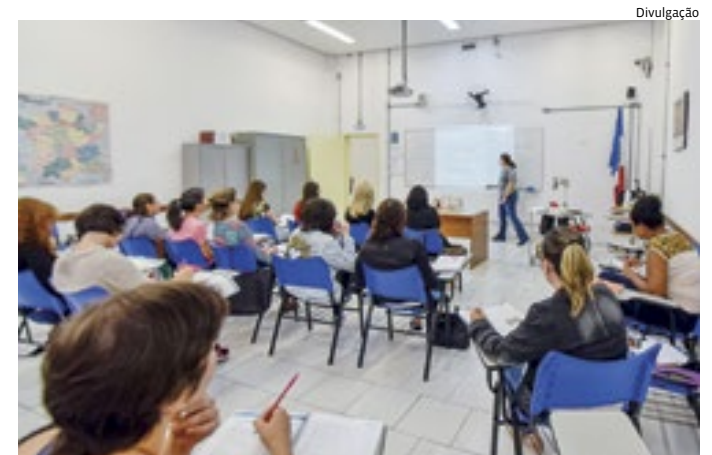
Mais de mil vagas em cursos de espanhol, francês, inglês e italiano

Os cursos têm duração de quatro semestres, com dois encontros semanais – às segundas e quartas-feiras ou às terças e quintas-feiras. Para o Francês e Inglês, há vagas para os períodos matutino, vespertino e noturno; para Espanhol e Italiano, as turmas serão nos períodos matutino e noturno.