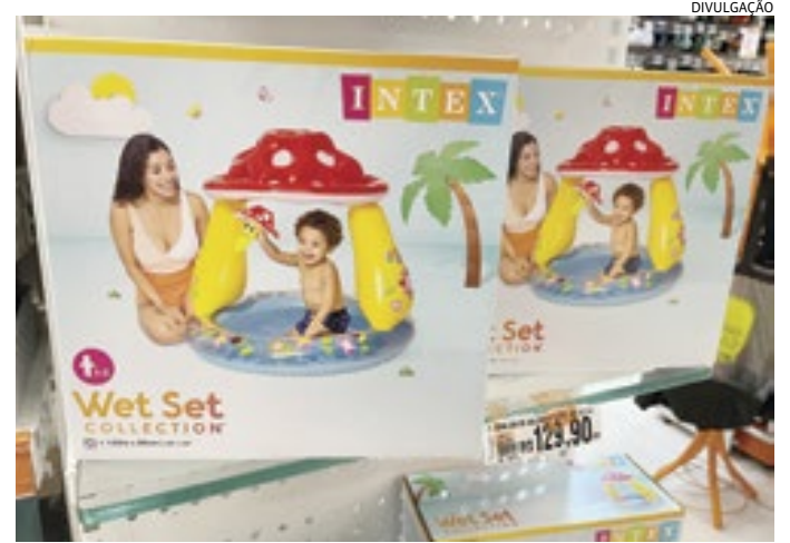
As piscinas infláveis, principalmente infantis, são opções viáveis