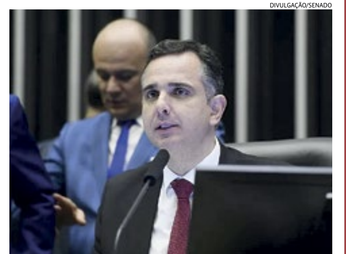
Rodrigo Pacheco (PSD-MG) se reúne hoje (9) com líderes partidários

O presidente do Congresso Nacional, Rodrigo Pacheco (PSD-MG), se reúne nesta terça-feira (9) com líderes partidários, às 10h. A expectativa é que eles discutam a medida provisória do governo que reonera a folha de pagamento de 17 setores da economia. Parlamentares e entidades têm pedido a Pacheco que devolva a MP, que reúne um pacote de iniciativas do governo para tentar zerar o déficit das contas públicas federais nos próximos anos. Entre elas, está o retorno gradual da cobrança de impostos sobre a folha de pagamentos de 17 setores intensivos em mão de obra, que empregam mais de 9 milhões de pessoas.