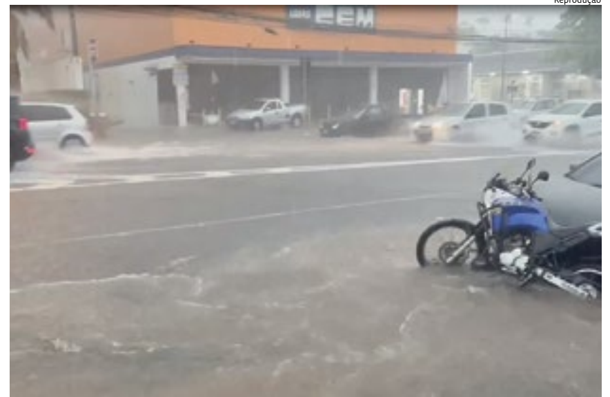
A Vila Arens também ficou com água alta, que chegou a arrastar motos na rua