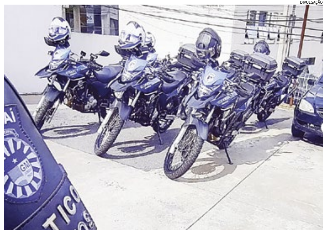
Os GMs foram atrás do suspeito, que perdeu o controle da direção e caiu durante a fuga