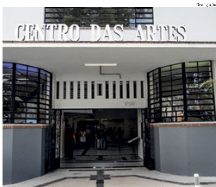
Café será instalado no andar térreo do Centro das Artes, no saguão

Mais informações podem ser obtidas na concorrência nº 002/2023 e no edital nº 34/2023, publicados na Imprensa Oficial do Município, no site da Cultura ou ainda pelo telefone 4806-0514.