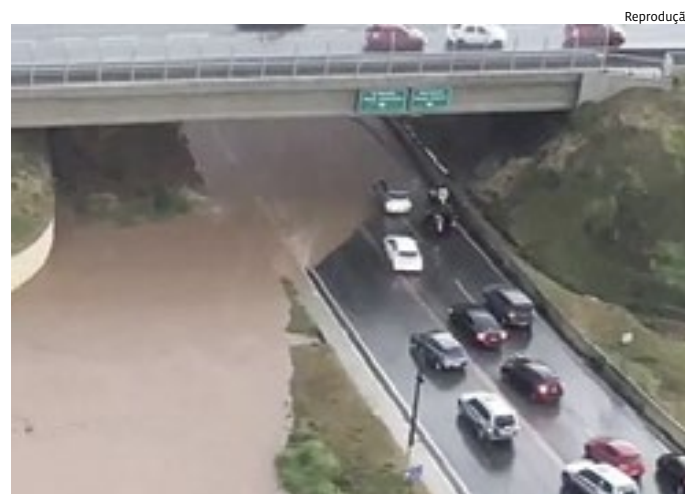
Avenida Jundiaí ficou alagada embaixo da rodovia Anhanguera

vemos nenhuma vítima em Jundiaí e não interditamos nenhuma casa ainda”, diz