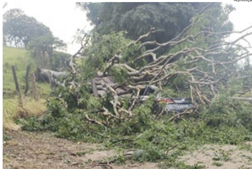
A árvore caiu sobre o homem e sobre o carro em que estavam a esposa e filha dele