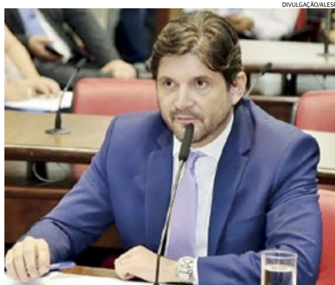
Presidente da Alesp assume posto durante viagem de Tarcísio de Freitas