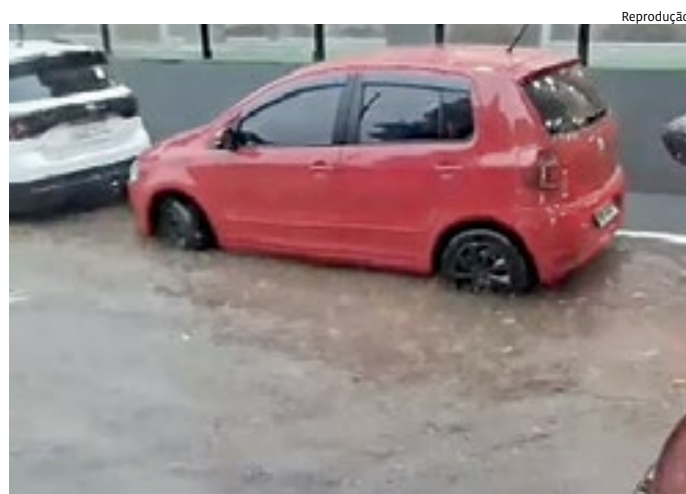
Avenida União dos Ferroviários ficou parcialmente interditada