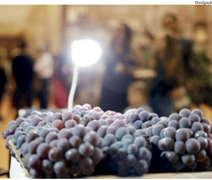
Para Niagara Rosada de Jundiáhy são cinco prêmios em cada categoria

Para a variedade Niagara Rosada de Jundiáhy, o agricultor concorre a cinco prêmios em cada categoria. Para a variedade Niagara Branca e Caixa Mista, o agricultor concorre a três prêmios em cada categoria. Também serão premiadas a uva mais doce e o maior cacho das uvas Niagara Rosada de Jundiáhy e Branca. Além das Uvas, os agricultores poderão participar da exposição levando frutas diversas, por exemplo, acaqui, laranja, pêssego, ameixa, atemóia, goiaba, pitaya,