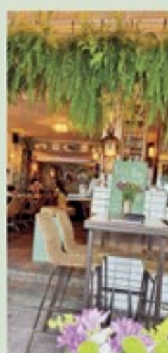
O aconchego do francês Le Pouliê

@barkalango - Rua Arnaldo Quintela, 44 - Botafogo @pulerestaurante - Rua dos Jangadeiros, 10 - Ipanema