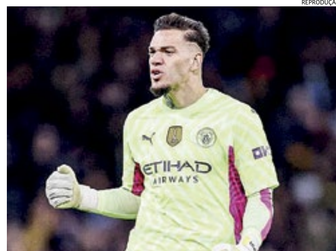
Os vencedores serão anunciados no dia 15, durante o The Best

Goleiros: Thibaut Courtois (Real Madrid/Bélgica) Ederson (Manchester City/Brasil) Emiliano Martínez (Aston Villa/Argentina)