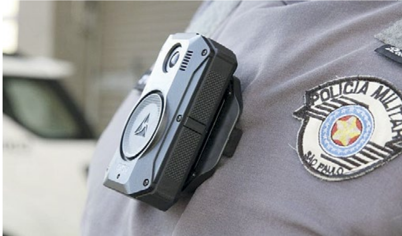
Atualmente, seis estados usam a ferramenta: MG, PA, RJ, RN, RO, SC e SP; outros fazem testes e pesquisas

“Vamos publicar em fevereiro as Diretrizes Nacionais para Utilização de Câmeras Corporais pelas polícias. Processo com consulta pública e construído com a participação das polícias de todos os estados, sem exceção. Ideologizar o debate sobre segurança pública não faz bem ao Brasil”, disse a pasta.