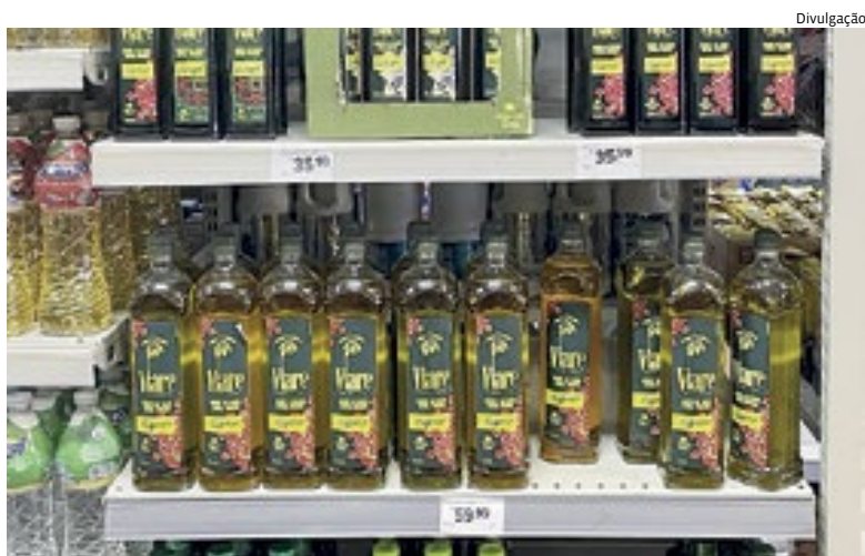
Com o aumento do preço do azeite, os consumidores buscam alternativas

é atribuído a uma série de fatores, incluindo as condições climáticas adversas em algumas regiões produtoras. Cidades 5