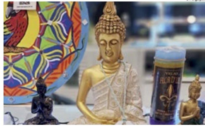
Artesanatos feitos por uma equipe profissional, a partir de R$ 15

A instituição tem por finalidade atender Pessoas em Situação de Rua da cidade de Jundiaí/SP e Região, bem como migrantes, oferecendo refeições, roupas, local para acolhimento, itens de higiene pessoal, atendimento psicossocial, suporte ao acesso a medicamentos e documentação, além de encaminhamentos para rede de saúde e socioassistencial do município.