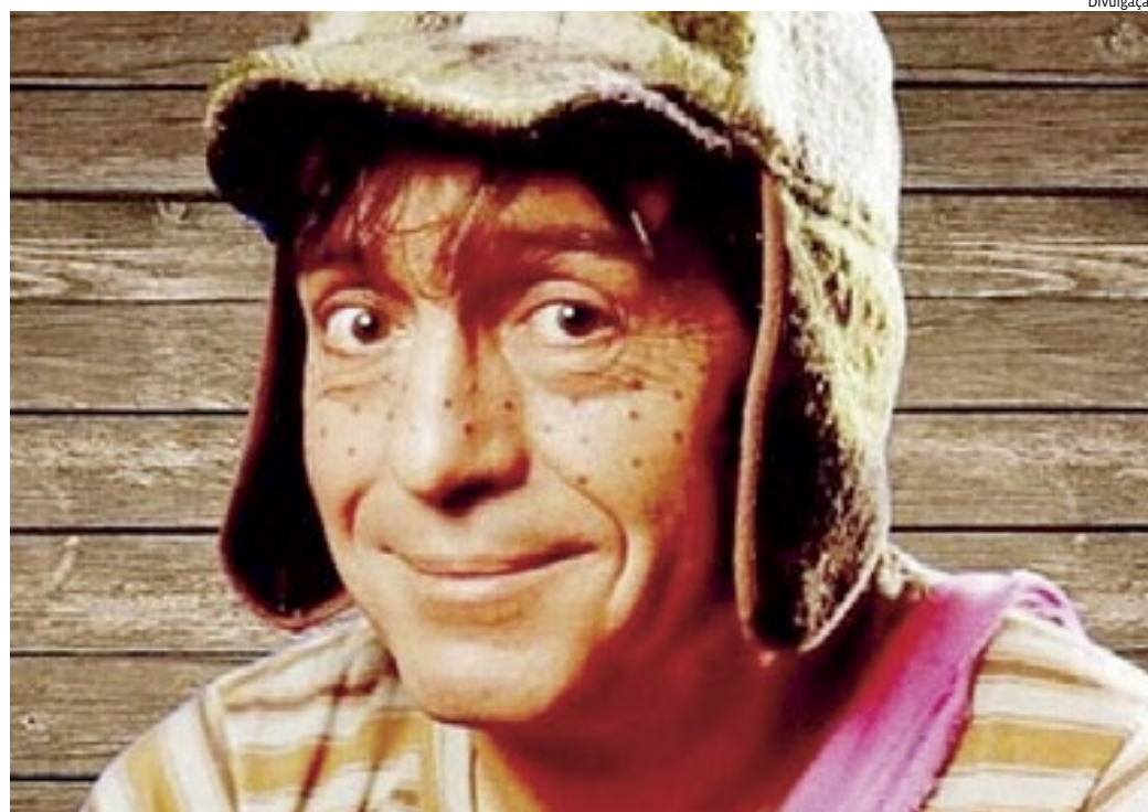
Exposição em homenagem aos 40 anos de estreia de um dos seriados de TV mais queridos do Brasil

Além de transportar os visitantes para dentro das séries “Chaves” e do herói “Chapolin Colorado”, a exposição – inédita no mundo – vai reunir um acervo exclusivo de figurinos, itens e roteiros originais trazidos do México exclusivamente para a mostra em São Paulo. A vida e obra de seu criador, o escritor Roberto Gómez Bolaños, conhecido como Chespirito, também será contemplada. Já os cenários serão detalhadamente recriados para oferecer uma experiência única. Será possível “entrar em cena” na tradicional Vila do Chaves, Casa do Seu Madruga, no golpino Pátio da Vila