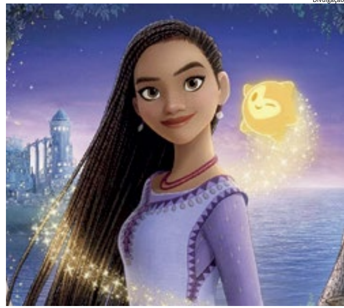
Trama entre a jovem Asha e uma força cósmica chamada Estrela

"Conseguimos trazer um visual e ponto de vista únicos para Wish, algo que realmente vai conseguir capturar o público e se sustentar por conta própria", apontou Reyes, que finalizou de forma categórica: "Por isso convidamos a todos para assistir a Wish nos cinemas. Ele foi feito para