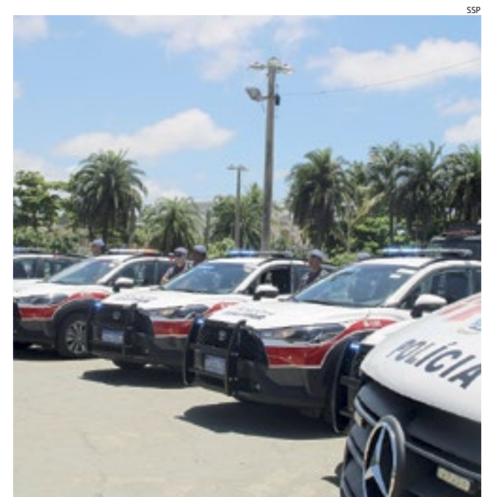
O homem preso é suspeito de participação no homicídio