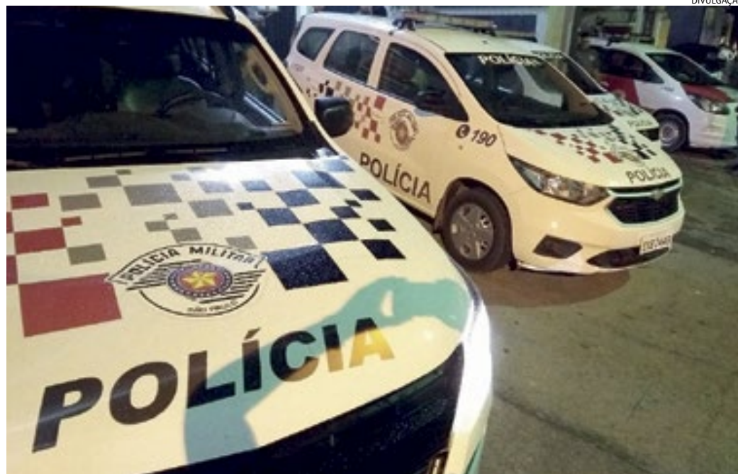
Os policiais militares conduziram o procurado para o Plantão Policial, onde ele ficou preso

Uma equipe da PM passava pela avenida Alceu Damião Peixoto, retornando de apoio a uma ocorrência, quando estranhou um homem olhando por cima do muro de uma empresa que vem sofren-