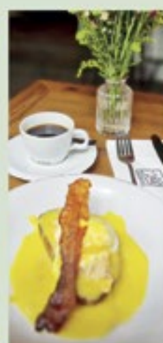
Ovo Benedict do Le Pouliê