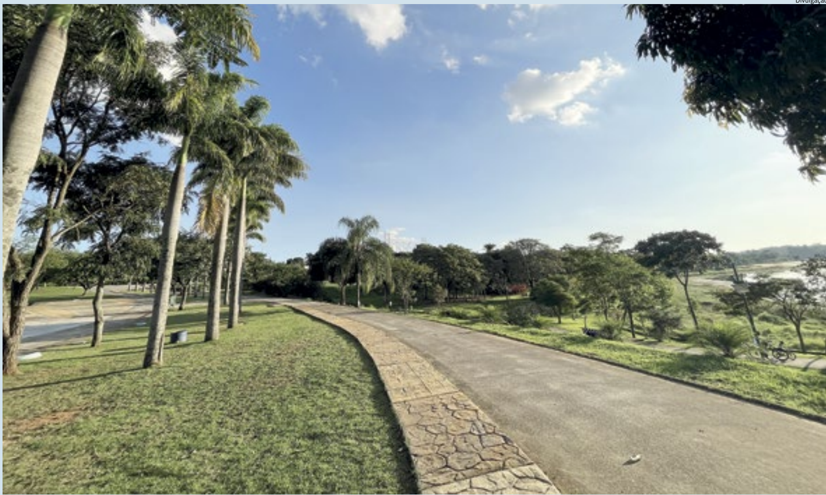
Para celebrar o aniversário do Parque da Cidade, em 21 de abril, será realizada uma grande festa com atrações gratuitas e muitas surpresas para seus visitantes

Todo início de ano chega com diferentes despesas, como IPVA, IPTU, gastos escolares, seguros e até pendência do ano anterior. Tudo isso "testa" finanças e impacta bolso. Educadora financeira, Cíntia Senna lembra que os compromissos do início do ano se repetem, então é necessário se programar. "Geralmente, esses compromissos acontecem todos os anos. Parte da manutenção de um bem, como um carro, tem o imposto que é cobrado uma vez ao ano", explica. Cidades 5