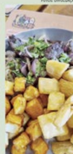
Carne seca, aipim e queijo de coalho do Kalango