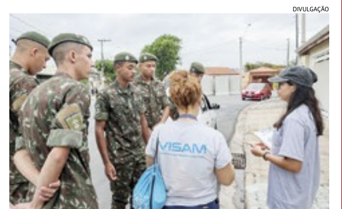
Equipes da VISAM e soldados do GAC fazem força-tarefa em Jundiá

A Prefeitura de Jundiá realiza nesta quinta-feira (4) a primeira força-tarefa de 2024 de enfrentamento e combate aos arbovíroses. Equipes da Vigilância em Saúde Ambiental (VISAM), vinculada à Unidade de Gestão de Promoção da Saúde (UGPS), com o apoio de soldados do 12º Grupo de Artilharia de Campanha (GAC) Barão de Jundiá, percorrerão imóveis do bairro Ivoturuaia para orientação e eliminação de criadouros do mosquito Aedes Aegypti. A região é considerada local de transmissão da dengue, com 14 casos confirmados para a doença e quatro exames aguardando resultado.