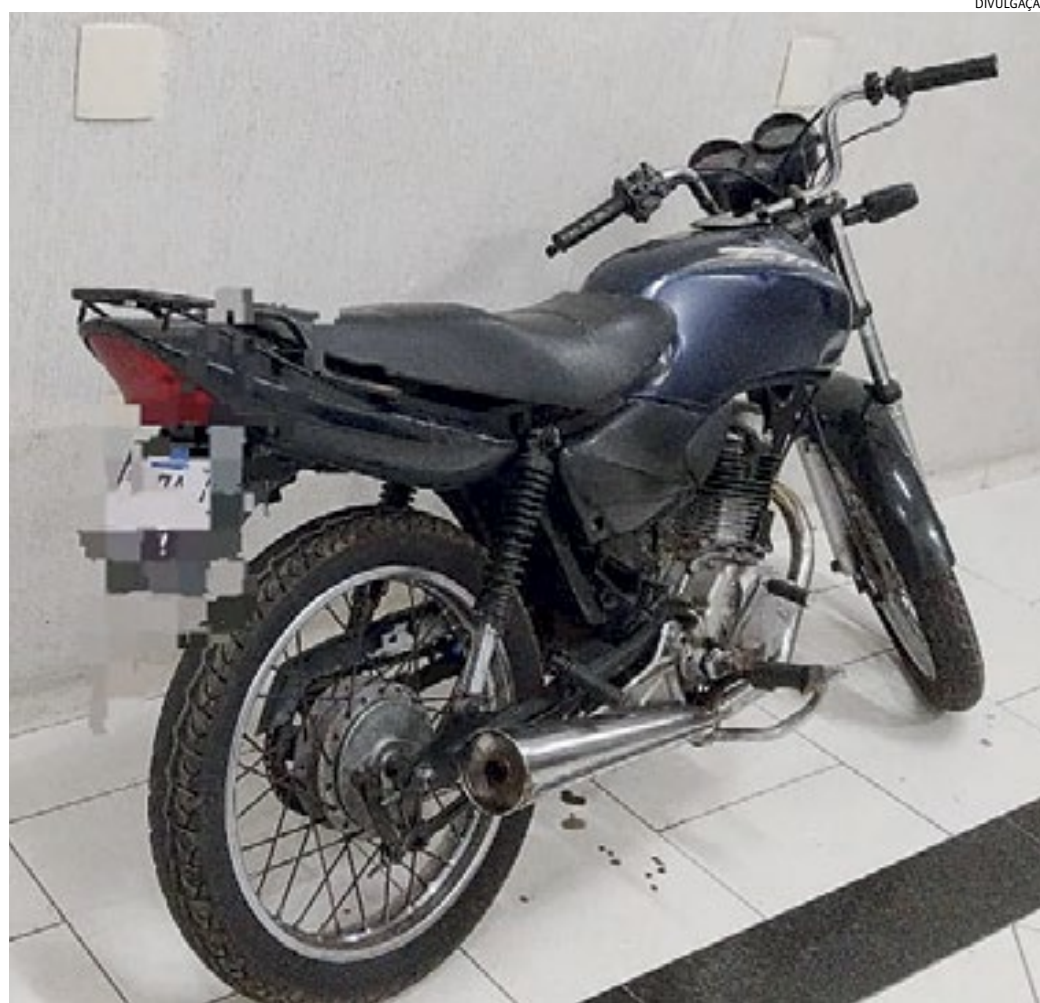
A moto foi apreendida em patrulhamento e será periciada para saber se é roubada ou furtada

A moto foi apreendida e será periciada para saber se é produto de roubo ou furto.