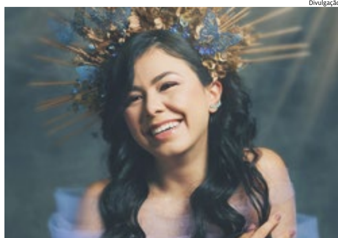
A cantora largou um emprego na indústria para viver seu sonho

minha última semana na empresa, eu falava que meu sonho era cantar com o Tia-go Iorc e uma colega me fa-