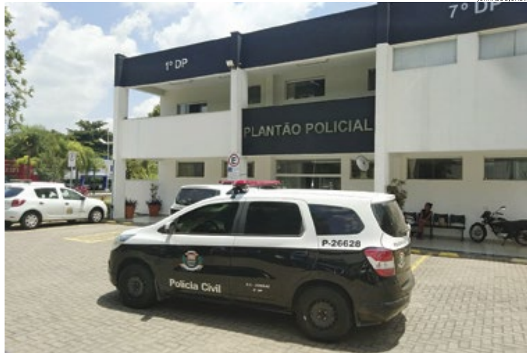
O caso foi registrado no Plantão Policial e será investigado pela Polícia Civil da delegacia de área

O caso será investigado pela Polícia Civil.