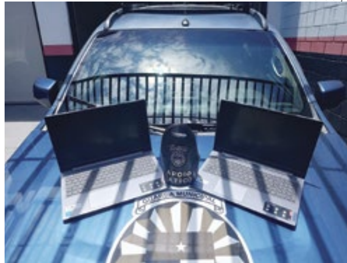
Dois notebooks aguardam para serem avaliados pelo possível proprietário