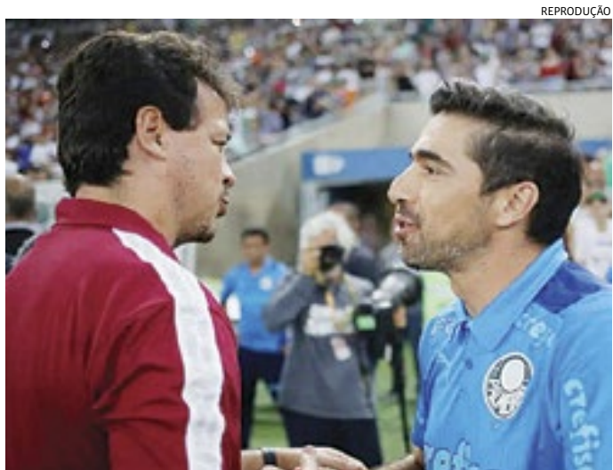
O resultado da premiação será divulgado no dia 31 de dezembro

O resultado da premiação será divulgado em 31 de dezembro.