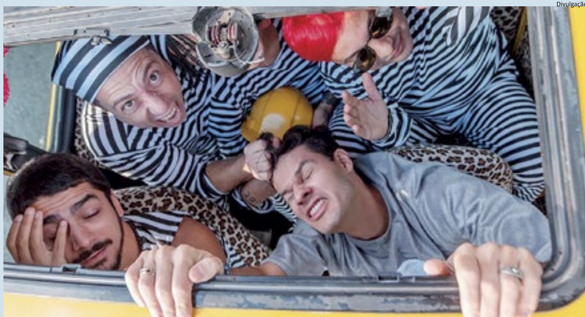
Não se trata de um documentário sobre a famosa banda dos anos 90, mas de uma ficção baseada em fatos reais

anos 90, com cinco jovens que se tornaram ícones. Ruy Brissac brilha no papel de Dinho. Cultura & Théo 7