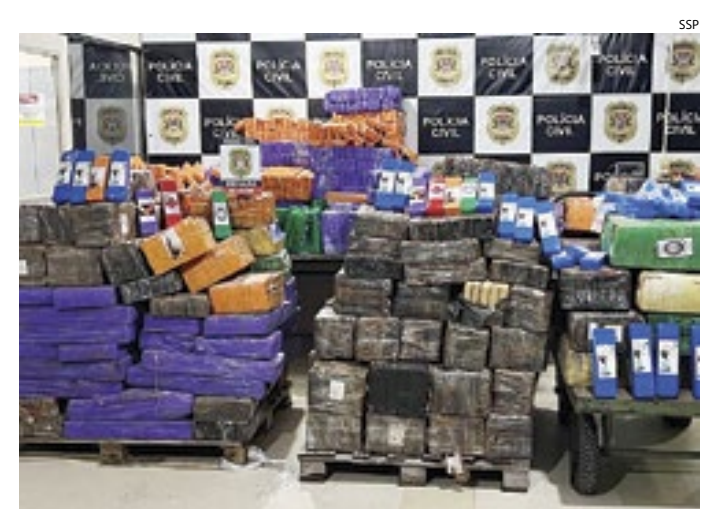
As drogas foram apreendidas em diversas ações durante todo o ano

Somente nas 3 fases da Operação Impacto SUL-MaSSP - realizada em conjunto com equipes do Paraná, Mato Grosso do Sul, Santa Catarina e Rio Grande do Sul - foram apreendidas 21,3 toneladas de entorpecentes.