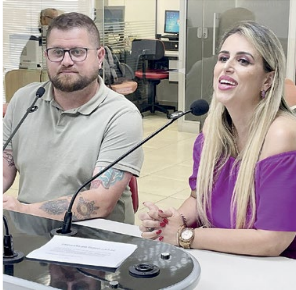
Parlamentares compartilharam experiências de primeiro mandato e planos na carreira pública em 2024