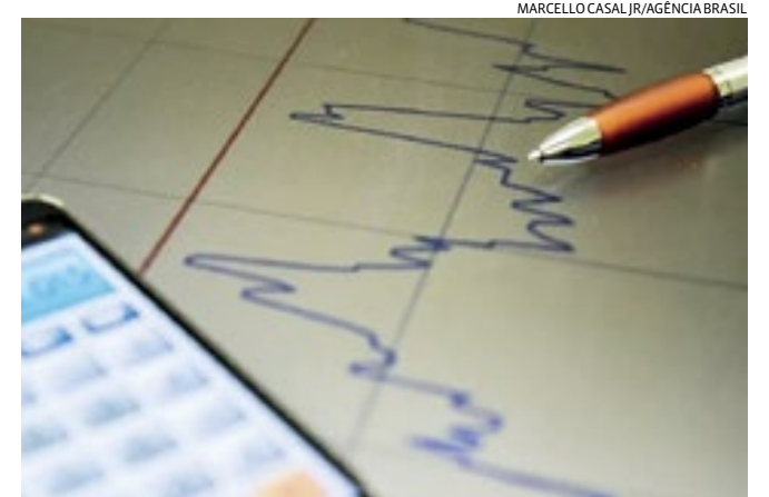
Débitos do governo no Brasil e no exterior passaram de R$ 6,172 tri

Rei Charles III em seu tradicional discurso de Natal, na Sala Central do Palácio de Buckingham