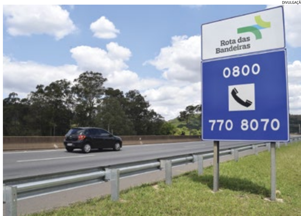
Durante o feriado de Ano Novo, algumas dicas são essenciais para garantir a segurança da viagem

Os motoristas podem obter informações sobre condições de tráfego e solicitar serviços, como auxílio me-