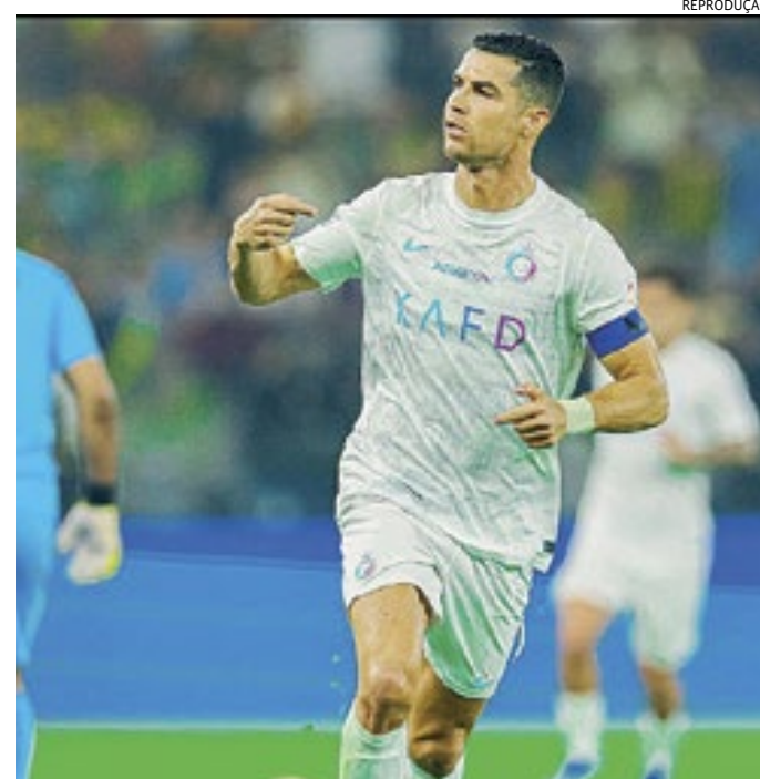
Cristiano balançou as redes 53 vezes e desbancou Mbappé e Kane

Atual melhor do mundo pela Fifa, Lionel Messi balançou as redes adversárias 28 vezes — entre PSG,