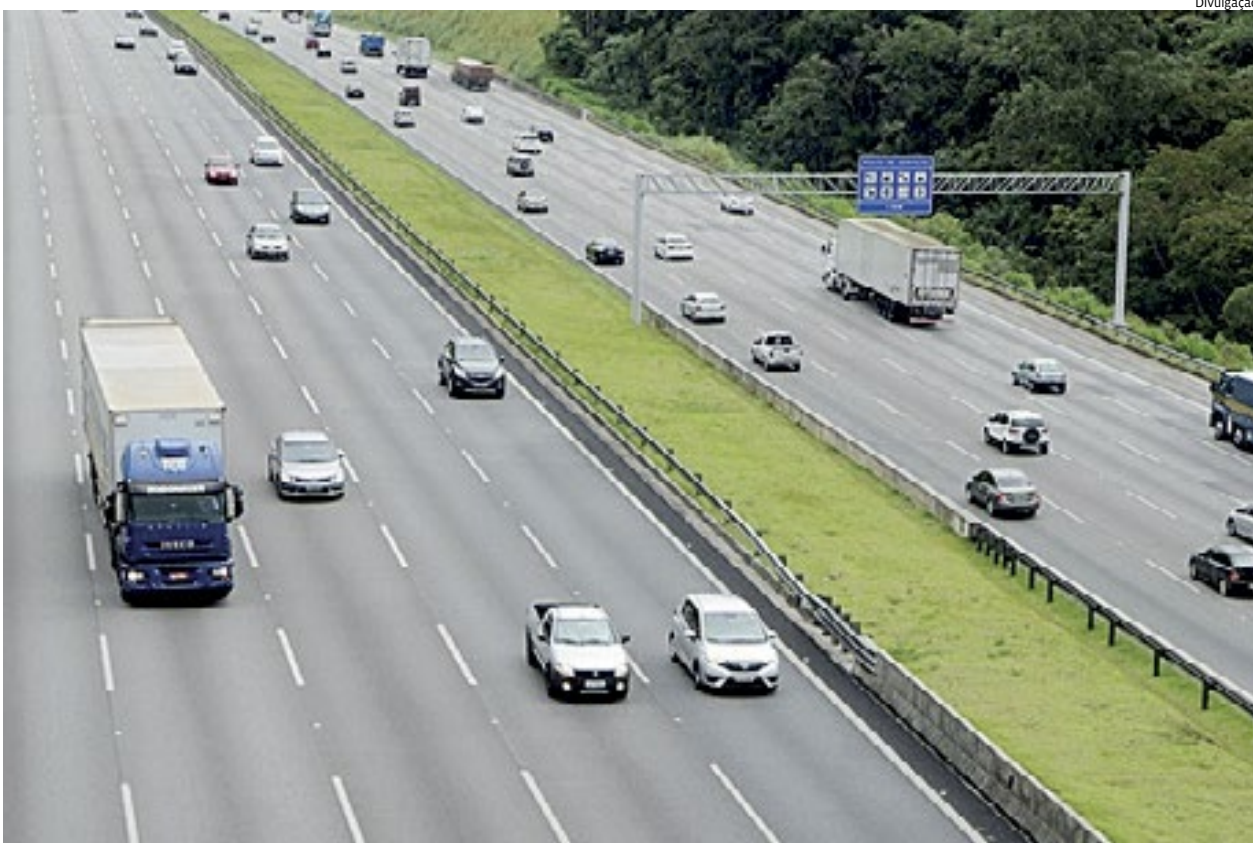
Na saída, estão previstos maiores movimentos no sentido Interior, das 15h às 21h na sexta-feira e das 9h às 15h no sábado

Com a chegada do Ano Novo, as rodovias que passam por Jundiáí se preparam para receber um volume significativo de veículos, com uma estimativa de mais de 1,9 milhões de automóveis durante o período. Mais de 800 mil