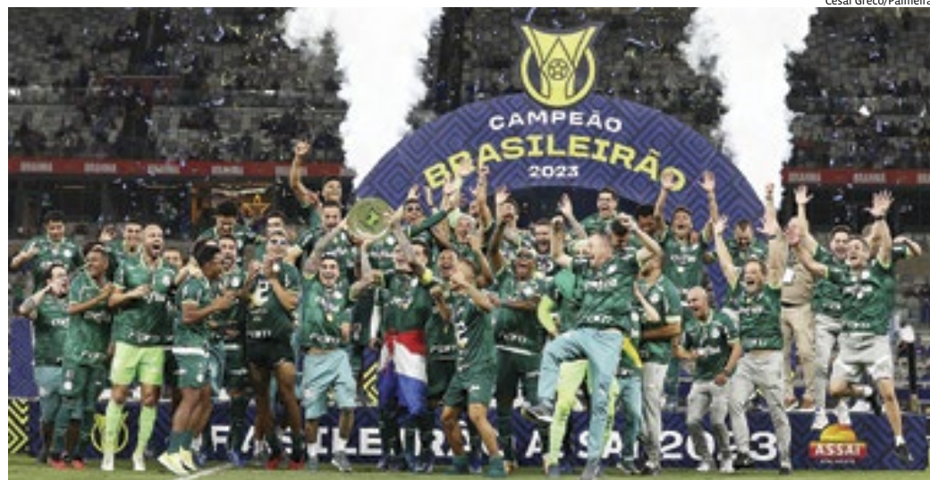
O Brasileirão seguirá normalmente durante a Copa América, disputada de 20 de junho a 14 de julho

O Brasileirão seguirá normalmente durante a Copa América, disputada de 20 de junho a 14 de julho. Quem for convocado perde-