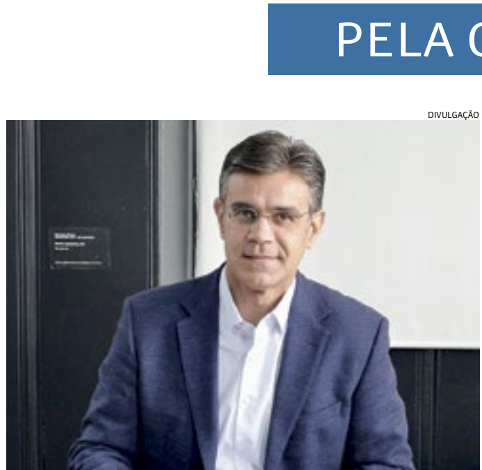
Nome é cotado em cenário de divisão dentro do partido tucano

Autoridades da área de segurança dos Três Poderes apresentarão, até o dia 4 de janeiro, um plano integrado de ações para garantir o ato democrático previsto para o dia 8 de janeiro. O evento foi proposto pelo presidente Lula e marca um contraponto à tentativa de golpe de Estado ocorrida na mesma data, um ano antes. O secretário-executivo do Ministério da Justiça, Ricardo Cappelli, se reuniu nesta terça-feira (26) com representantes das polícias Federal e Rodoviária Federal.