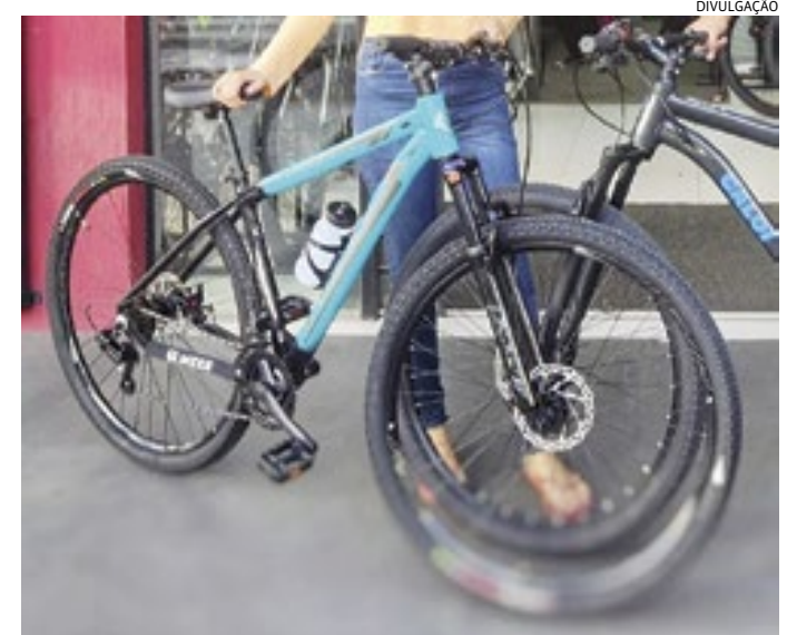
Quem tiver informações do paradeiro da bike, deve ligar para a polícia

As imagens mostram que, por volta das 4h de sábado, o bandido passa olhando para as casas e nota que o portão está com o cadeado destrancado. Ele então se aproveita da situação para entrar e sobe a escada lateral a casa, onde havia duas bikes em um corredor. Segundos depois ele sai com uma das bicicletas, avaliada em cerca de R$ 1,5 mil. "Nós havíamos pedido lanche na noite de sexta-feira e, por azar, esquecemos de trancar o cadeado. Ele se aproveitou dis-