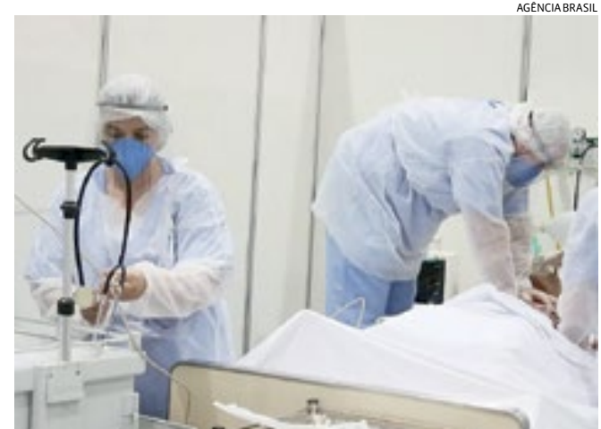
Paciente morreu em 2021 por falta de vaga na UTI e de oxigênio

A Justiça Federal no Amazonas decidiu que os familiares de uma mulher que morreu durante a pandemia de covid-19 devem ser indenizados em R$ 1,4 milhão. O pagamento da quantia deverá ser dividido entre os governos federal e estadual, além da prefeitura de Manaus, em função da falta de oxigênio na cidade, em 2021. Cabe recurso contra a decisão. Na época em que a mulher faleceu, a família chegou a obter uma liminar da Justiça para garantir o tratamento intensivo, mas a decisão não chegou a ser cumprida em função do falecimento.