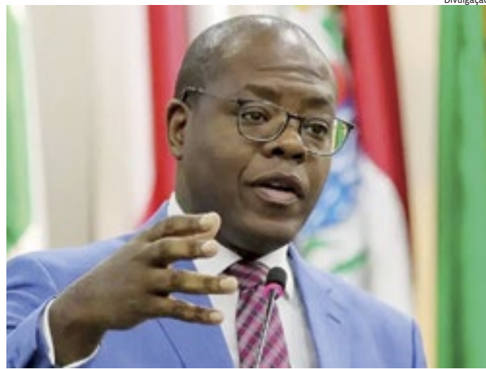
Ministro Silvío de Almeida falou sobre a importância de uma medida

li diz que fake news causam grandes problemas. “Fiquei sabendo do recente caso de fake news, vi o tamanho do impacto que ocorreu e sinto muito pelo triste desfecho. As fake news causam tantos danos, porque são informações que retiram o indivíduo da realidade, através da manipulação de informações falsas e tendenciosas com o intuito de prejudicar pessoas. Causam ansiedade, estresse, pânico e sintomas depressivos. A fake news é elaborada para