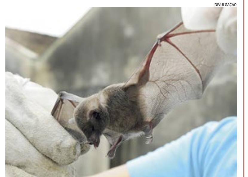
Ontem houve reforço em medidas pelo Programa de Vigilância no bairro

dade, a partir de demanda registrada no canal 156. O animal foi localizado na região de Torres de São José. Cidades 5