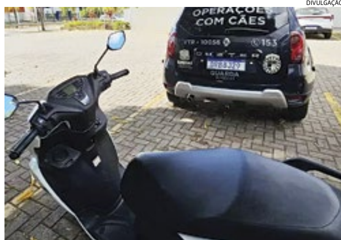
A moto foi encontrada abandonada na rodovia João Cereser

Os guardas imediatamente foram para a rodovia, em patrulhamento com