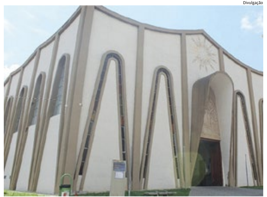
Esta não é a primeira vez que o templo religioso sofre com a ação de ladrões

Foram levados fios do sistema de eletricidade e parte de um ventilador. Um suspeito do crime foi detido por guardas. Polícia 6