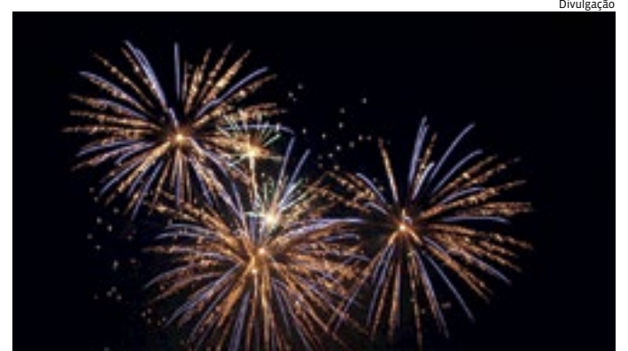
Antes de planejar o uso de artefatos de pirotecnia, consulte legislação

Outras pessoas e animais de estimação também devem manter distância do praticante, no momento da soltura. Caso o artifício falhe, não tente reaproveitá-lo e sempre deixe pelo menos um balde com água próximo, para casos de necessidade.