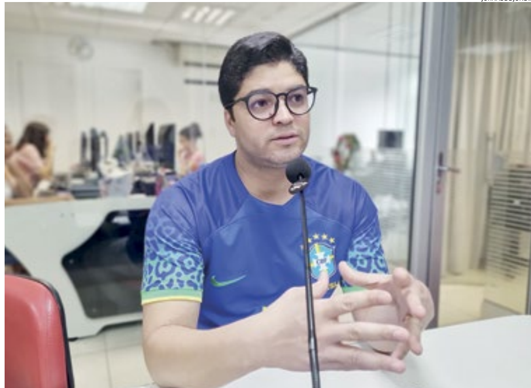
Vereador falou sobre trabalhos políticos de 2023 e cenários possíveis envolvendo seu nome em 2024