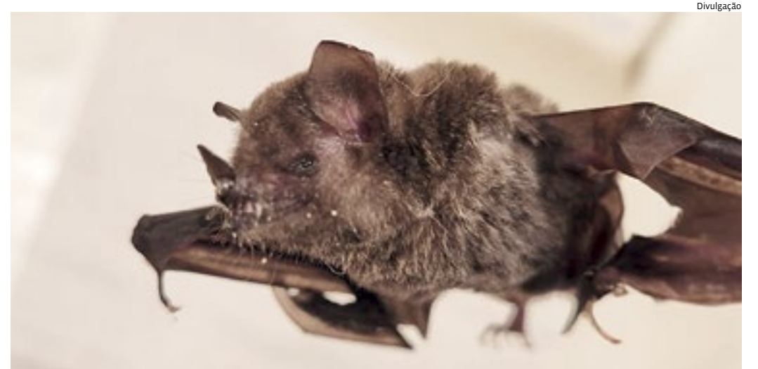
Morcegos são animais protegidos por lei; vacinação de animais domésticos é a prevenção eficiente

Os morcegos são animais protegidos por lei, sendo considerados úteis ao homem e à natureza, devendo ser preservados. É crime ambiental matá-los ou agredi-los.