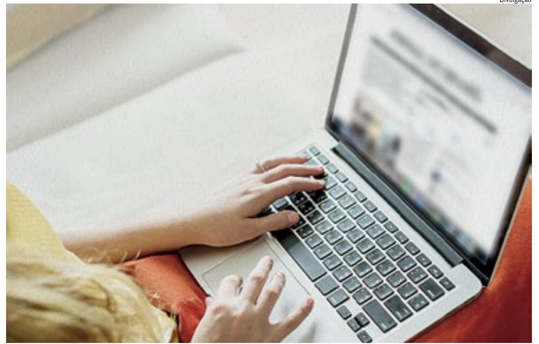
A circulação de fake news afeta diversos setores, mas pouco foi feito desde o aumento deste conteúdo

Atualmente o Brasil não tem uma lei que assegure a responsabilidade sobre a veracidade das postagens na internet