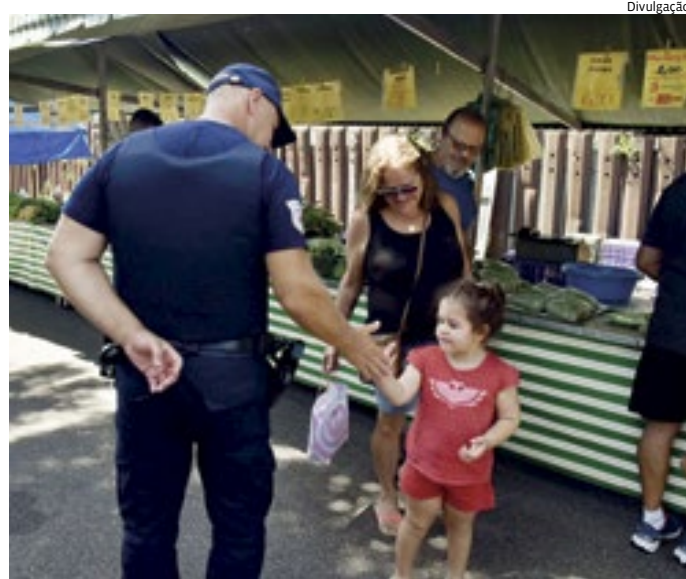
Agentes de fiscalização também percorrem as feiras e varejões

Além da Guarda Municipal, os agentes de fiscalização também percorrem as feiras e realizam o controle do horário dos permissãoários, a organização das bancas, controle da venda de produtos de acordo com a licença e coibição do comércio ambulante dentro das feiras e varejões. “O trabalho visa manter a organização dos espaços, bem como garantir apoio aos permissãoários e segurança aos consumidores. Com o apoio da Guarda