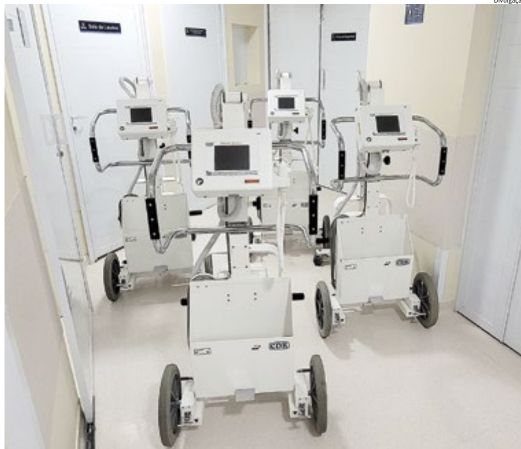
Os recursos possibilitam a atualização dos equipamentos já disponíveis na unidade

O engenheiro também chama a atenção para a tecnologia disponível nos dispositivos, que compõe o processo de transformação digital e modernização da