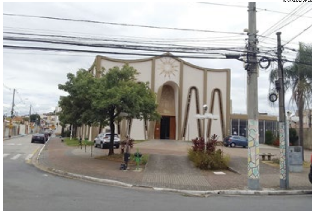
A Paróquia São João Batista, no bairro Ponte São João, já foi alvo de ladrões por diversas vezes