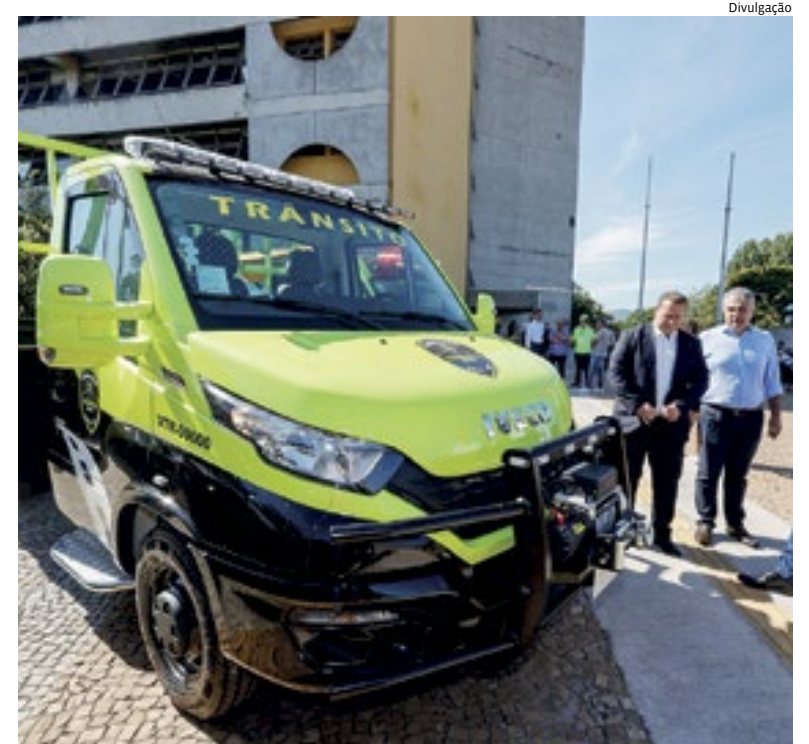
Veículos são dotados de equipamentos de sinalização sonora e visual

todo, foram investidos R$ 4,4 milhões na aquisição de 28 veículos que atenderão diferentes equipes nas ruas. Cidades 4