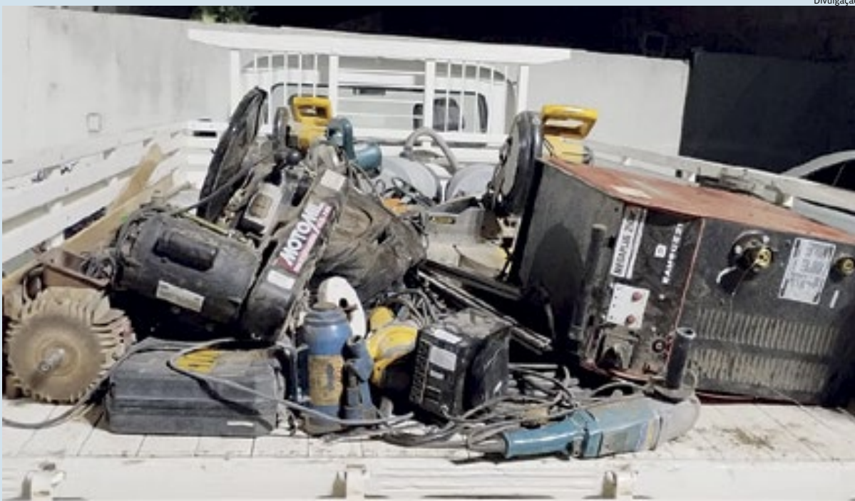
Na avenida dos Imigrantes, os agentes alcançaram a dupla a bordo da Kombi carregada com os produtos furtados

na mesma avenida. As prisões foram possíveis graças a uma pessoa que passava pela avenida e que acionou a PM. Polícia 6