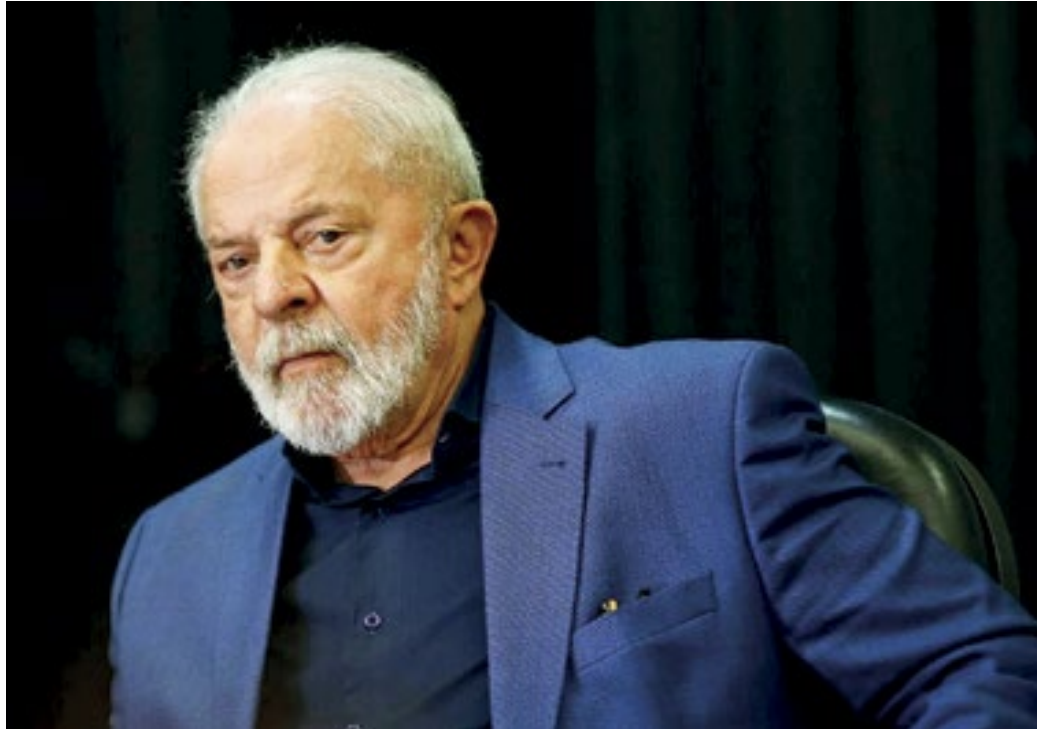
Pedido de fiscalizar Lula veio de deputada bolsonarista Bia Kicis, acolhido pelo ministro Augusto Nardes

Nardes contrariou recomendação feita pela área técnica do TCU para arquivar o assunto. Em sua decisão favorável ao pedido da Comissão, o ministro destacou que, embora a recomendação seja para que o Tribunal avalie, "em finais de mandato", os presentes recebidos pelo presidente da República, "isso não impede a realização imediata de solicitações do Congresso ou de suas Comissões Técnicas em virtude do mencionado trabalho rotineiro" da Corte