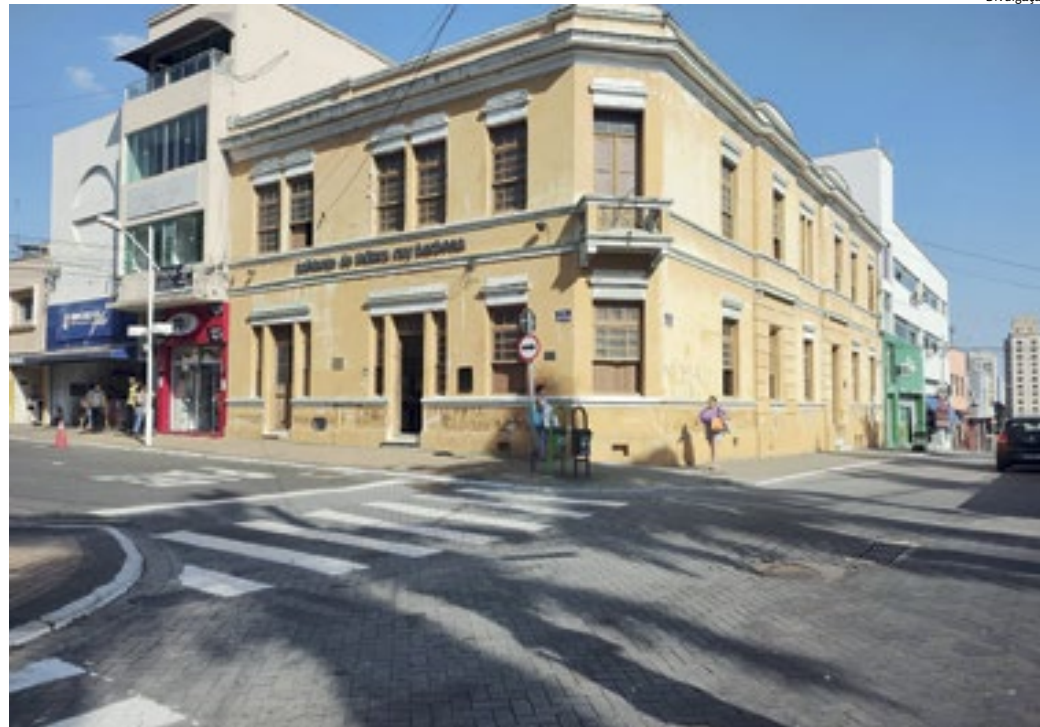
O prédio centenário do gabinete é tombado, então não pode ser reformado, precisa ser restaurado

Através de nota, a Prefeitura de Jundiaí informa que, diante da decisão da Associação Comunitária que administra o Gabinete de Leitura Ruy Barbosa pelo encerramento das atividades, a Unidade de Gestão de Cultura (UGC), considerando a importância histórica e cultural do prédio e seu acervo para a cidade, está em tratativas para assumir a administração do espaço. Não há, porém, qualquer definição a respeito dos serviços a serem oferecidos ou revitalização do prédio.