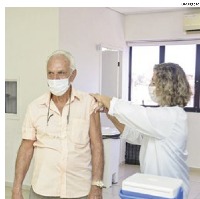
Idosos integram grupo de risco; reforço aplicado de segunda a sexta

Jundiaí, por meio do Comitê Municipal de Prevenção e Enfrentamento ao Coronavírus (CEC), monitora diariamente os dados da cidade e do País para, de forma transparente e pautados em orientações das autoridades sanitárias, adotar medidas antecipadas.