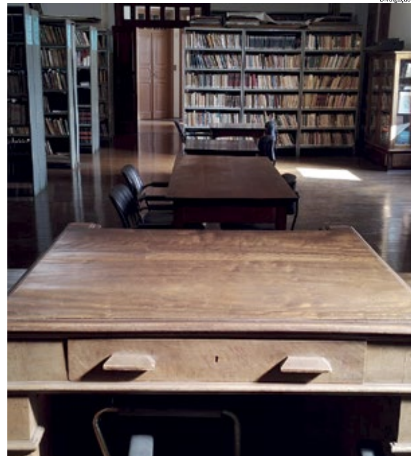
Com 55 mil livros no acervo, Gabinete de Leitura enfrenta problemas financeiros

Até lá, porém, não há planos para o prédio e nem para o acervo centenários. Em nota, a Prefeitura de Jundiáí informa que a Unidade de Gestão Cultural está em tratativas para assumir a administração do espaço. Cidades 4