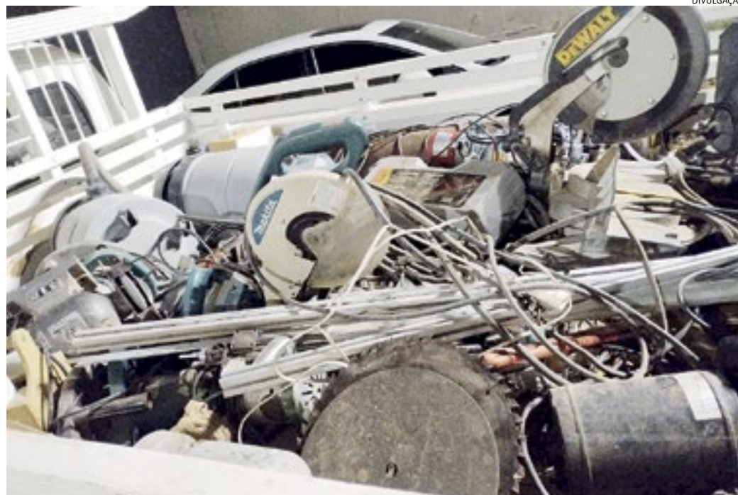
Mais de R$ 40 mil em ferramentas foram recuperados pelos policiais militares durante a ação