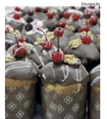
Doces natalinos estão em lista de pesquisa de preços

Para conferir a pesquisa completa, com detalhes dos produtos pesquisados, estabelecimentos visitados e mais dicas ao consumidor, acesse procon.jundiai.sp.gov.br/procon-orienta/pesquisas/