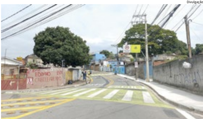
Objetivo é promover melhores condições de segurança no trajeto do pedestre

soito com faixas na cor lima-limão, balizadores, entre outras intervenções. Cidades 5