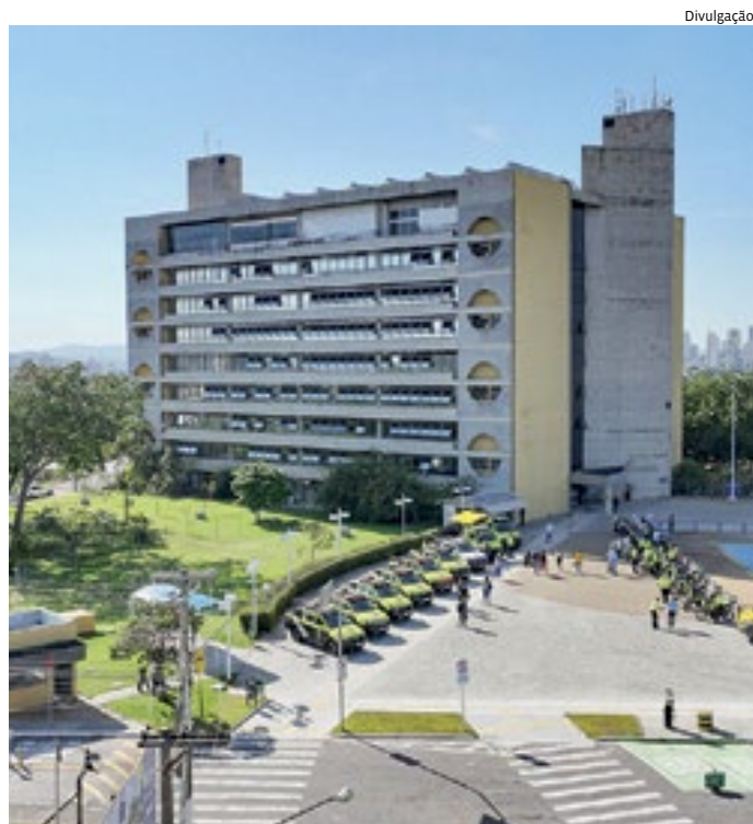
A renovação/ampliação da frota vem sendo realizada desde 2017