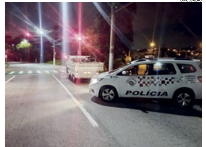
PMs conseguiram alcançar e prender a dupla que cometeu o crime

Os homens foram submetidos à abordagem e confessaram o crime, alegando que entraram no estabelecimento comercial para furar fios de cobre, mas viram uma oportunidade mais