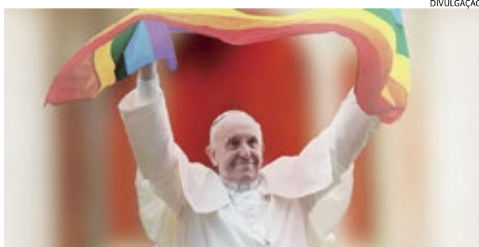
'Não podemos ser juízes que apenas proibem', disse papa Francisco