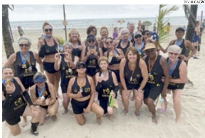
Equipe jundiaense comemora os bons resultados no torneio

Jundiaí ainda foi representada no concurso de Miss Interpraías com seis candidatas. O clima de toda a competição foi contagiante, e a Unidade de Gestão de Esporte e Lazer (Ugel) ofereceu toda a estrutura para que nada faltasse às atletas da Melhor Idade.