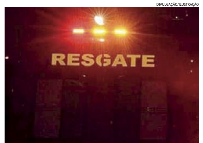
A vítima foi socorrida a um hospital com vários ferimentos

O motociclista foi orientado quanto ao prazo de seis meses para denunciar o motorista por crime se trânsito.