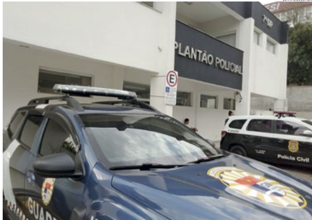
Guardas municipais saíram à procura do ladrão e prenderam um suspeito do crime

Os agentes então foram para a comunidade da Fepasa, suspeitando de que o criminoso pudesse ter ido para trocar o objeto furtado, por drogas. A aposta deu