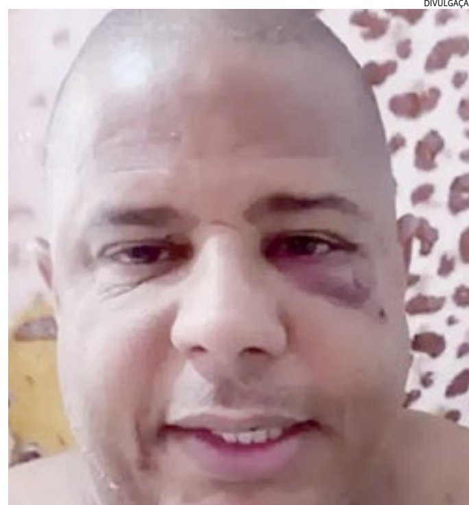
O ex-jogador estava desaparecido após acompanhar um show

O autor do sequestro seria marido da mulher. No vídeo, a versão é endossada pela mulher que supostamente saiu com Mar-