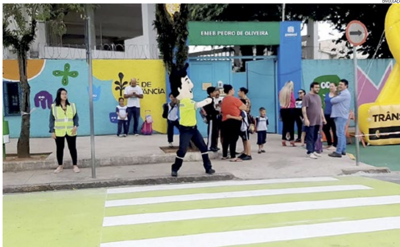
A sinalização de solo, principalmente as faixas de travessia, foram destacadas com coloração lima-limão para chamar a atenção dos usuários

A sinalização de solo, principalmente as faixas de travessia, foram destacadas com coloração lima-limão, justamente para chamar a atenção dos usuários de que ali é um pon-