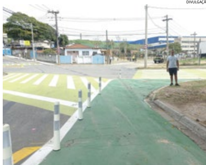
O programa ajuda no comportamento de pedestres e condutores

“Além disso, estamos expandindo nossos investimentos em equipamentos que contribuem para a segurança das crianças. O reforço da sinalização para os motoristas é uma medida essencial, visando conscientizá-los sobre a presença dos alunos. Reconhecemos também a importância da parceria com as comunidades locais, incentivando a colaboração