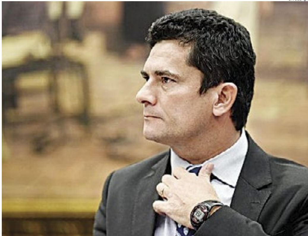
Políticos de esquerda e de direita dão como certo que o resultado final para Moro, com sua cassação

Moro como juiz e Deltan como chefe da equipe de procuradores da Lava Ja-