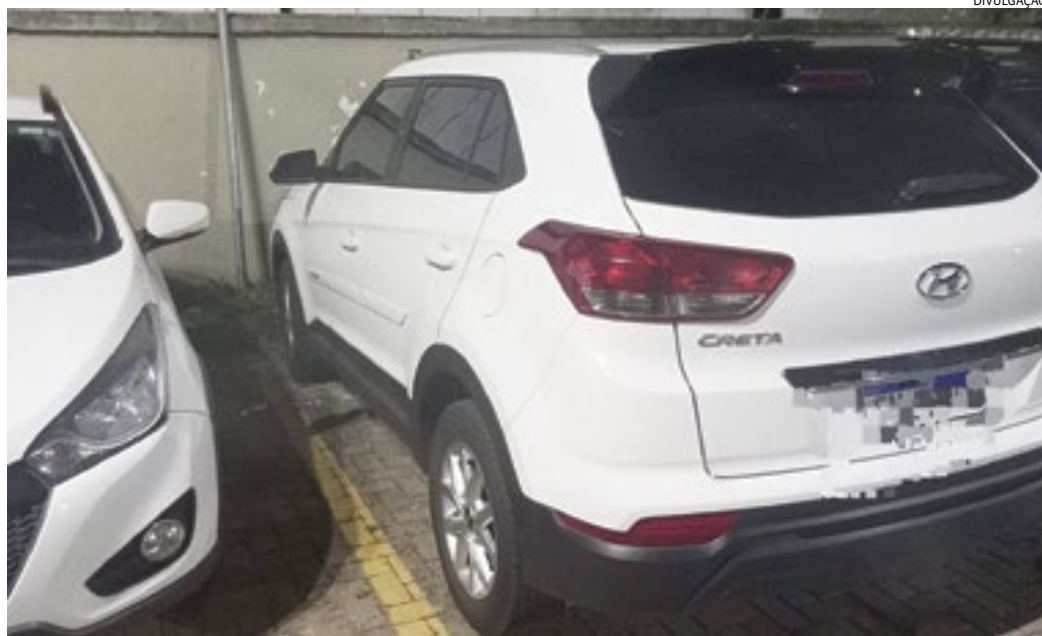
O carro, recuperado por policiais militares do 11º Batalhão, na Vila Rami, foi devolvido à família

Era noite de sexta-feira (15) e, pensando em espairecer após uma semana dura de trabalho para os pais, e de estudo para os filhos, uma família de Jundiá decidiu ir ao complexo esportivo do Bolão, no bairro Anhangabaú, para alguns momentos de lazer. Porém, a paz se transformou em medo no momento em que eles saíram do local e se dirigiam ao carro, que estava ao lado de fora. Dois bandidos apontaram suas armas e anunciaram o assalto, levando o carro da família, um veículo Creta - localizado por policiais militares do 11º Batalhão, no início da madrugada deste sábado (16), abandonado na Vila Rami.