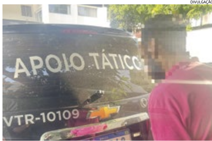
Ele estava com mandado de prisão em aberto, expedido pela Justiça

Os GMs Pierre, Zarantonello e Aparecido estavam em patrulhamento pela Ponte, na região da 'cracolândia' - onde algumas horas antes haviam prendido um criminoso perigoso, autor de dois homicídios e uma tentativa de homicídio -, quando perceberam que um homem que caminhava pela rua apertou o passo e tentou se esconder em um comércio. Abordado, ele informou que tinha 36 anos, o que causou estranheza nos guardas. "Pela aparência, ele claramente tinha mais idade do que estava informando", disse Zarantonello.