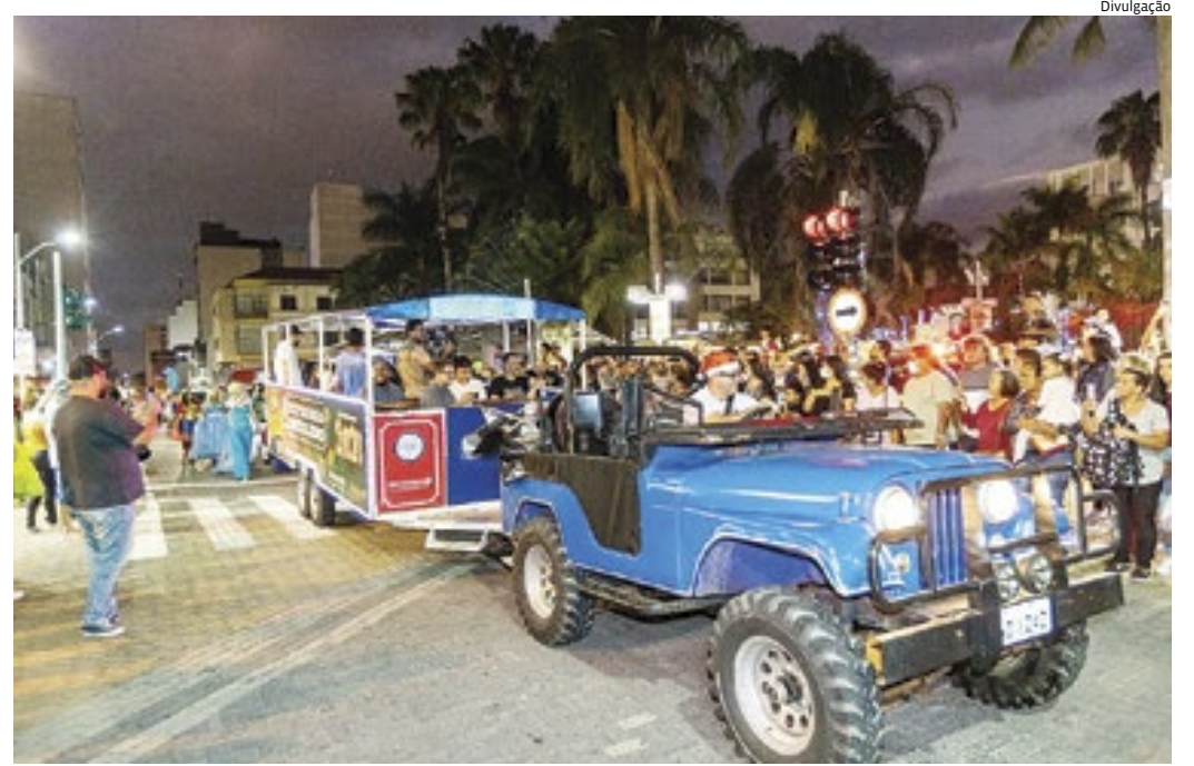
O Expresso Natalino está entre as atrações do desfile, com canções da Banda Marcial Bamalo