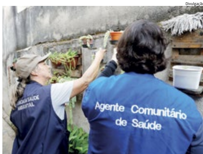
O esforço tem sido conjunto para evitar mais essa crise sanitária

O cenário se agrava porque, além da variação climá-