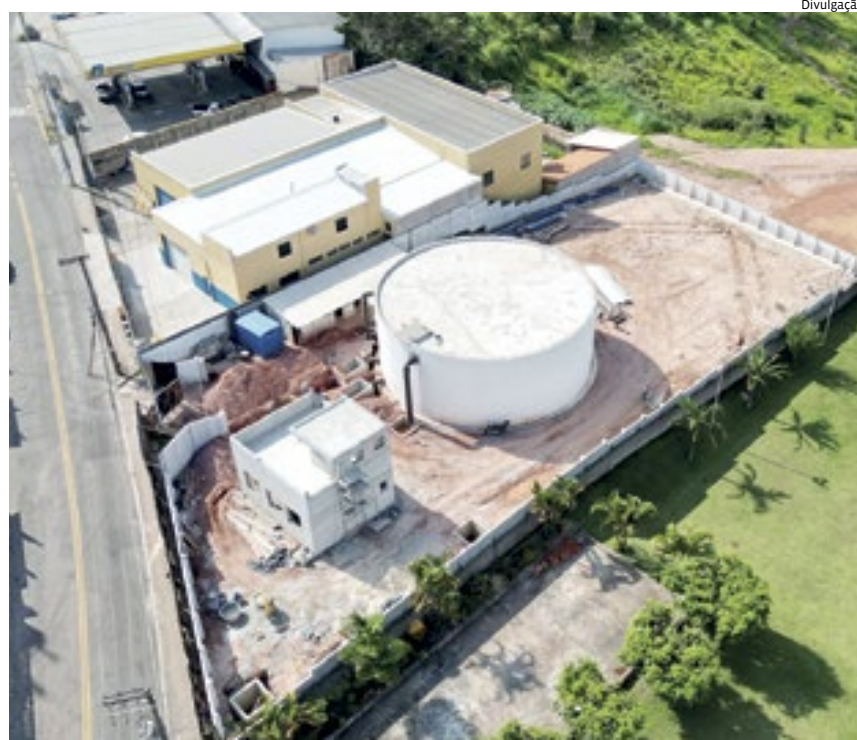
O equipamento do Igoturucaia atenderá vários bairros, como Marajoara e Bianchini

No Jardim do Lago, o serviço começou pela demolição do reservatório elevado antigo, que estava obsoleto. Agora começou a ser cons-