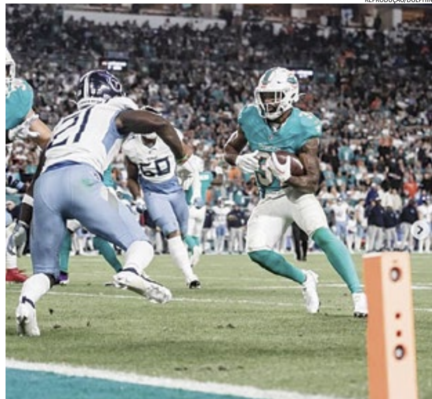
A tendência é que o Miami Dolphins, da Flórida, esteja na partida da Neo Química Arena

mi Dolphins esteja na partida da Neo Química Arena. A franquia da Flórida selecionou o Brasil como sua área internacional de atuação de marketing. O time vem promovendo iniciativas no país desde então, como watch parties de jogos e o anúncio de uma escolha de Draft por Filipe Luís, então jogador do Flamengo, no Cristo Redentor.