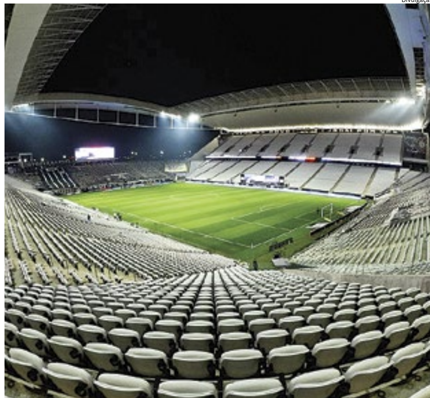
O jogo acontecerá no estádio do Corinthians, a Neo Química Arena, em 2024