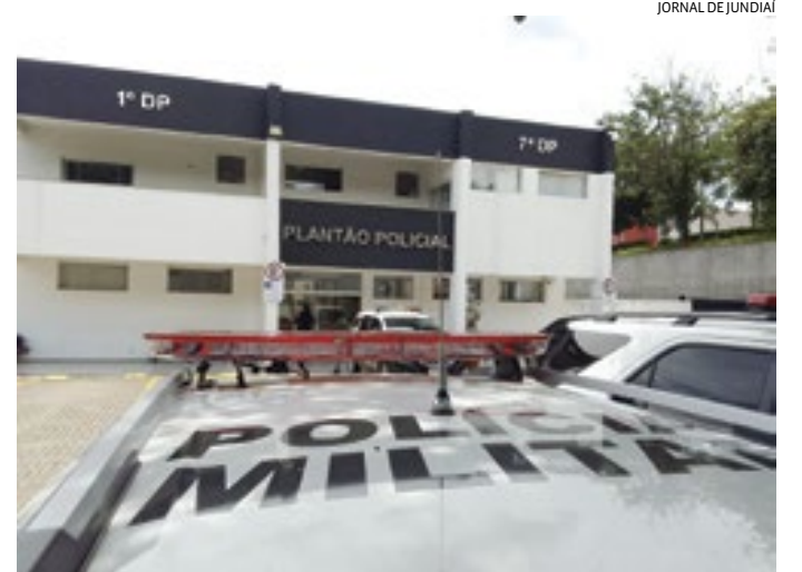
Preso pela PM, o suspeito foi levado para o Plantão Policial

Câmeras de monitoramento flagraram um ladrão usando uma pedra da decoração externa do restaurante para jogar na porta de vidro (que é temperada), conseguindo destruí-la. Após isso, o bandido invade e, em ação rápida, pega o di-