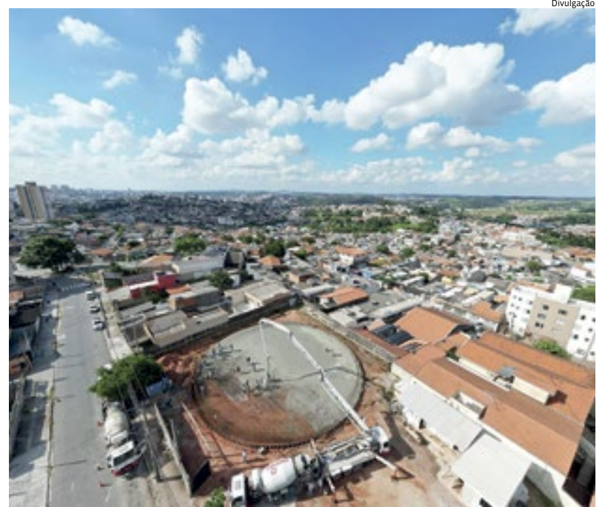
No Jardim do Lago, começou a ser construído um novo reservatório para a população

truído o novo reservatório apoiado, com capacidade para armazenar até três milhões de litros de água. Uma sala de painéis e uma guarita integram o projeto. Além do bairro, Vila Didi, Jardim Estádio, Cidade Jardim e Vila Esperança serão beneficiados.