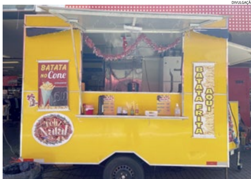
A batata frita no cone é vendida por R$ 15 e a batata frita no prato é vendida por R$ 25