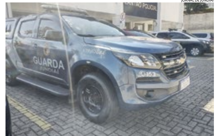
Os GMs reconheceram o homem após terem assistido aos vídeos

O primeiro furto ocorreu em uma clínica odontológica, onde o ladrão arrombou a porta para entrar - da clínica ele levou três notebooks e um celular. Em seguida, o mesmo criminoso invadiu outro estabelecimento comercial, de onde furtou dois notebooks e três celulares. As vítimas registraram Boletim de Ocorrência nesta sexta-feira e, após isso, colocaram em grupos de WhatsApp de comer-