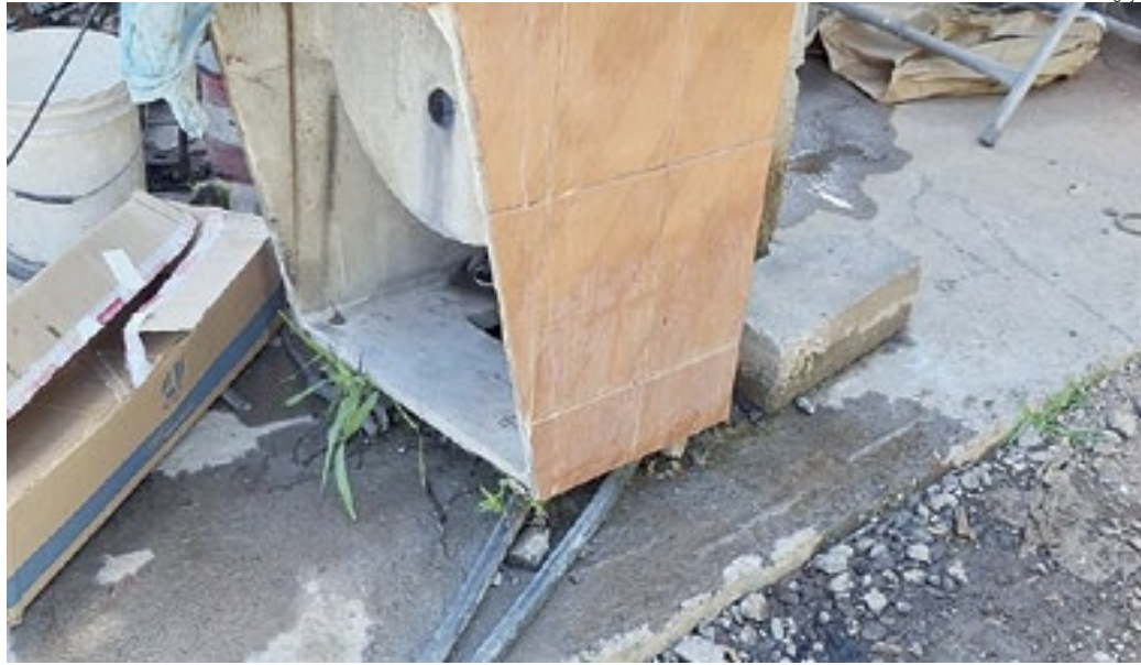
O descarte irregular de substâncias no solo infiltra para o lençol freático e acaba contaminando a água

“Com relação a oficina mecânica, não vou dizer que é impossível, mas que uma pessoa que trabalha não saiba que não pode jogar fora. Existem caminhões de coleta, que faz serviço gratuito, porque as empresas fazem o reciclo.