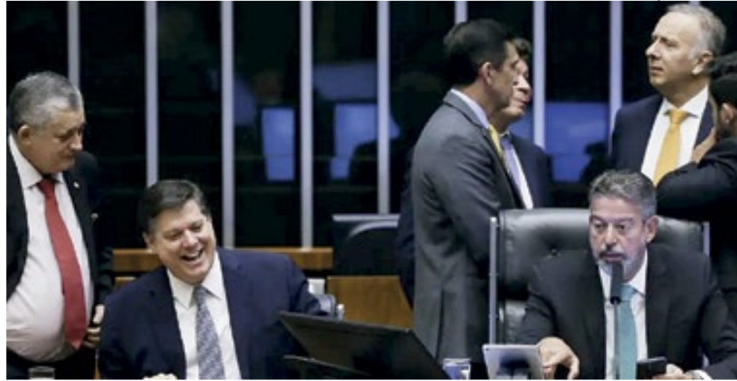
Proposta unifica cinco tributos sobre consumo e coloca Brasil entre países que adotam um sistema IVA

O Executivo terá até 180 dias a partir da promulgação para enviar os projetos de lei complementar que regulamentarão a reforma. O governo trabalha com o envio de três a quatro propostas para definir regras e alíquotas dos novos tributos, os regimes específicos de setores que ficarão fora do alcance