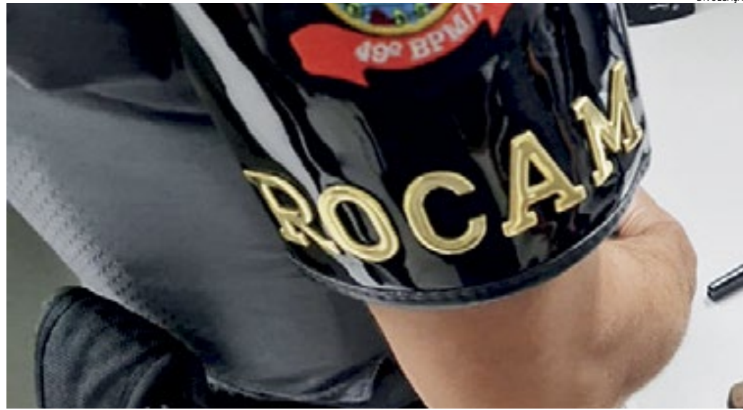
Os PMs foram informados de que nesta casa estava havendo movimentação suspeita

Policiais militares da Ronda Ostensiva Com Apoio de Motocicletas (Rocam), pertencentes ao 2º Pelotão de Força Tática do 49º Batalhão, prenderam um homem por tráfico de drogas, receptação e adulteração de sinal identificador automotor, na noite desta quinta-feira (14), na Vila Real, em Várzea Paulista. Segundo apurou a reportagem, a área onde ocorreu a prisão é dominada pelo Primeiro Comando da Capital (PCC), motivo pelo qual acredita-se que ele seja membro desta facção criminosa - ou não teria autorização para atuar no local. Inclusive, no Plantão Policial, em seu despacho, o delegado Rodrigo Carvalhaes fez menção a essa possibilidade, ao representar pela prisão preventiva do suspeito: "Uma investigação mais aprofundada provavelmente apontará que o local dos fatos e o autor pos-