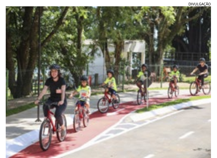
Espaço foi criado a partir de diretrizes da rede internacional Urban95