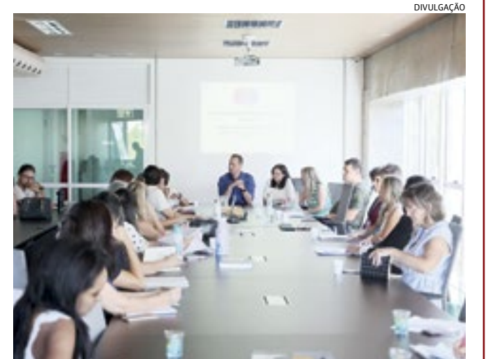
Técnicos da prefeitura alinham estratégias contra arboviroses

Diante do alerta do Ministério da Saúde e do Estado para o risco de epidemia de arboviroses, técnicos da Prefeitura de Jundiá traçaram, em reunião realizada quinta-feira (14), novas estratégias para prevenção e enfrentamento da dengue, chikungunya e zika. O Brasil registrou, até o último dia 9, cerca de 1,6 mil casos de dengue, em torno de 15% a mais do que o ano passado. Só no Estado de São Paulo, foram 333,5 mil casos. Em Jundiá, são 1.072 casos de dengue.