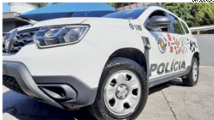
Os PMs estavam em patrulhamento quando suspeitaram de um homem

Os policiais estavam em patrulhamento, quando, ao entrarem na rua Humberto Primo Campana - local onde funciona um ponto de tráfico -, eles avistaram um homem sentado em frente a um bar, com uma sacola nas mãos. Este, ao perceber que não teria como fugir, logo se rendeu.