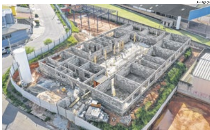
Avança a construção da nova escola municipal do bairro Terra Brasilis

crianças com algum tipo de necessidade especial.