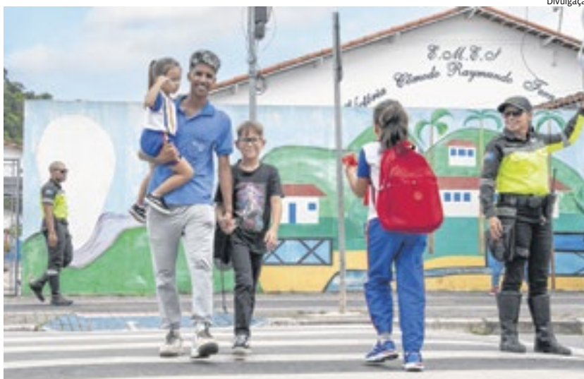
Itupeva teve alta populacional nos últimos anos, mostrando interesse habitacional

Os trabalhos em curso para conclusão da ponte estaiada, importante ligação viária entre a região central