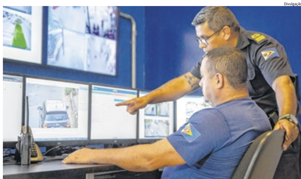
A Sala de Controle da GCM de Itupeva faz monitoramento da cidade e dos veículos em circuito fechado