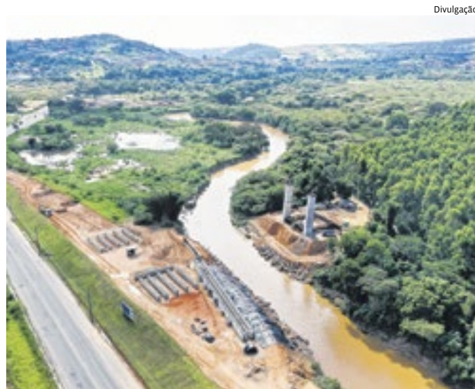
A ponte estaiada será uma importante ligação entre Centro e bairros

e bairros, com planejamento para interligação futura direta ao Aeroporto de Viracopos, é um símbolo desta decisão da administração em realizar sonhos antigos e estruturar a cidade para o futuro.