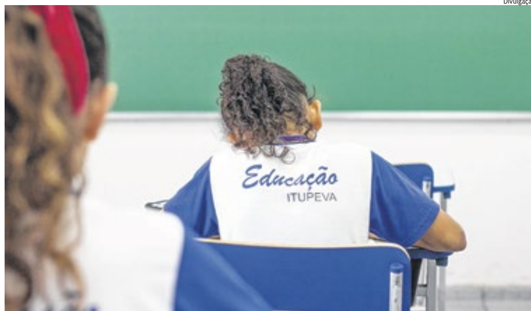
Todos os alunos da rede municipal de ensino receberam uniforme e kit de material escolar neste ano

A educação de Itupeva é referência e manter o padrão de qualidade é desafiador, especialmente com o crescimento da demanda. Porém, tijolo por tijolo, o trabalho vai virando realidade: três novas escolas serão entregues neste ano, uma em julho e duas em dezembro, além da ampliação de duas novas unidades e uma outra conquista: o Centro de Atendimento Educacional Especializado, oferecendo atendimento diferenciado e especializado às