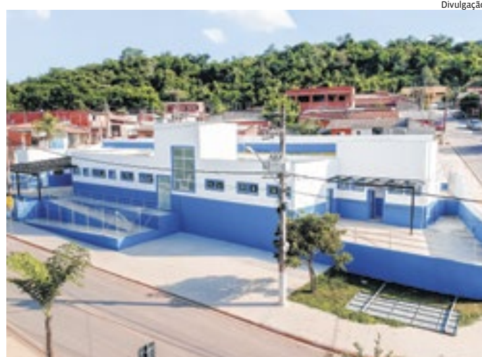
A UBS do bairro do Quilombo foi concluída e ampliará atendimentos