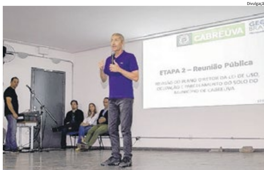
A revisão do Plano Diretor permite novas ocupações no município

A etapa do diagnóstico aconteceu entre outubro e novembro de 2022. Foram duas oficinas e uma audiência pública nos bairros Villarejo e Jardim Alice.