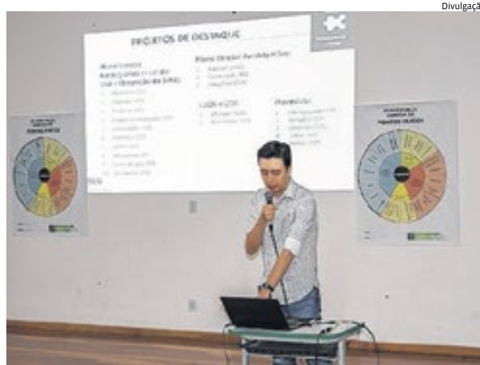
As reuniões e audiências vêm acontecendo desde o ano passado

Entre as inovações da proposta, há a substituição da divisão atual, rural e urbana, o que permite maior assertividade sobre o que se deseja para cada porção