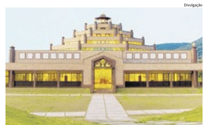
O Templo Pela Paz Mundial de Cabreúva terá comemoração