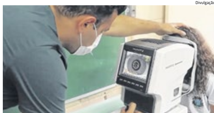
O projeto começou no ano passado, com avaliação oftalmológica

necessitarem serão atendidos e receberão de forma gratuita os óculos. Os alunos podem escolher a arma-