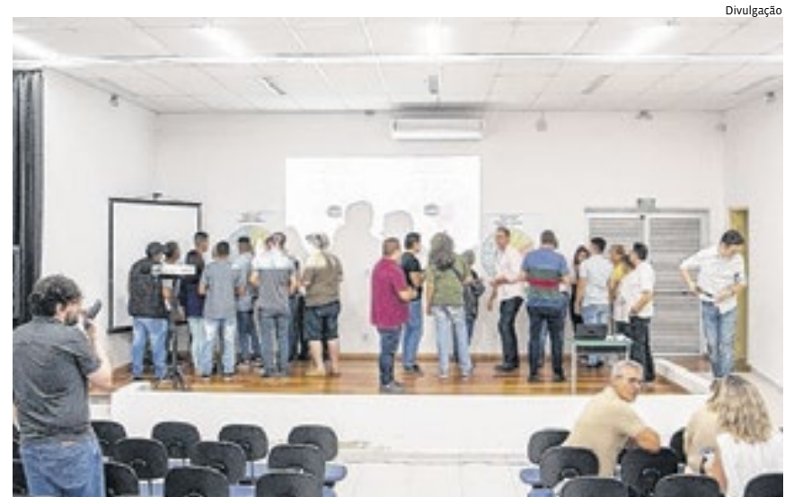
A elaboração do plano acontece com participação popular

Após essa etapa, veio a formulação e validação de propostas, elaboradas entre fevereiro e o início de março em duas reuniões, nos bairros Villarejo e Jardim Alice, e uma audiência na Câmara Municipal.