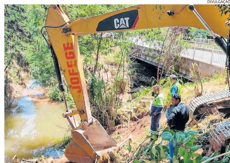
Homens trabalham na recuperação da margem do córrego Sorocaba

Também é fundamental destacar que as obras do túnel liner (que vai ligar o córrego Bertioga ao rio Jundiaí, ajudando no escoamento) já atingiram 45 metros escavados à mão, passando sob a Marginal do Rio Jundiaí e a linha férrea. A construção prevê o combate às fortes chuvas dos meses de verão.