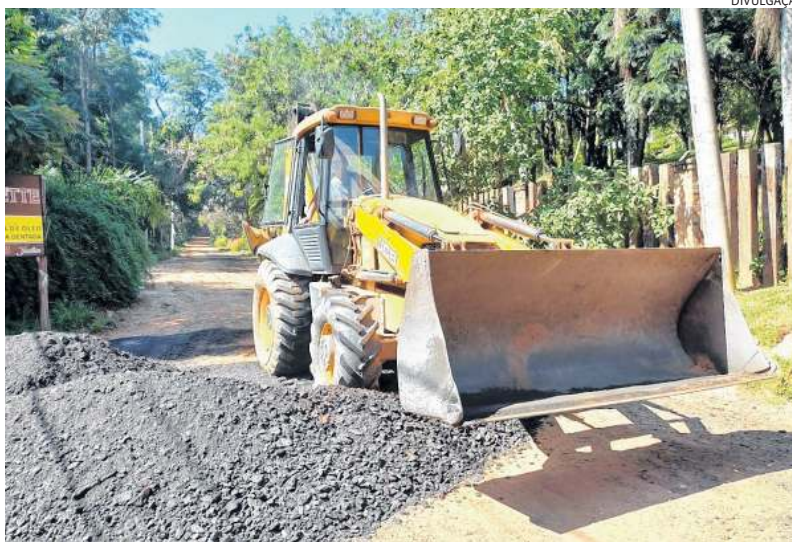
Vias passam por nivelamento no caminho para a Serra do Mursa

Também na área de Assistência Social, a Prefeitura entrega o vale-gás, um dos benefícios estaduais do programa assistencial Bolsa do Povo, do Governo do