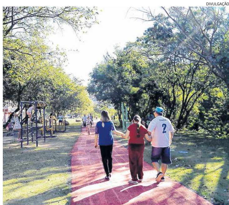
Parque Chico Mendes, ponto de encontro de famílias, será palco da festa

Após o ato político de abertura do evento, com falas do prefeito professor Rodolfo e outras autoridades municipais, está previsto, entre 10 horas e meio-dia, se as condições de tempo permitirem, um aulão de diversas atividades físicas: ritmos, futsal, capoeira, caratê e muay thai.