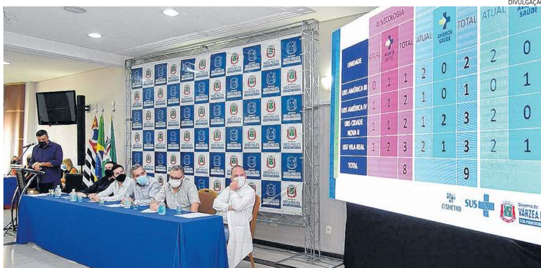
Cerimônia marcou adesão ao consórcio Cismetro; acordo promete mudanças no atendimento de saúde

dos serão: exames de imagem (raio-X, por exemplo), exames laboratoriais (como o de sangue), consultas médicas, procedimentos cirúrgicos de baixa complexidade e recursos humanos. Futuramente os municípios poderão contar com a aquisição de medicamentos com custos mais baixos e maior agilidade nas compras.