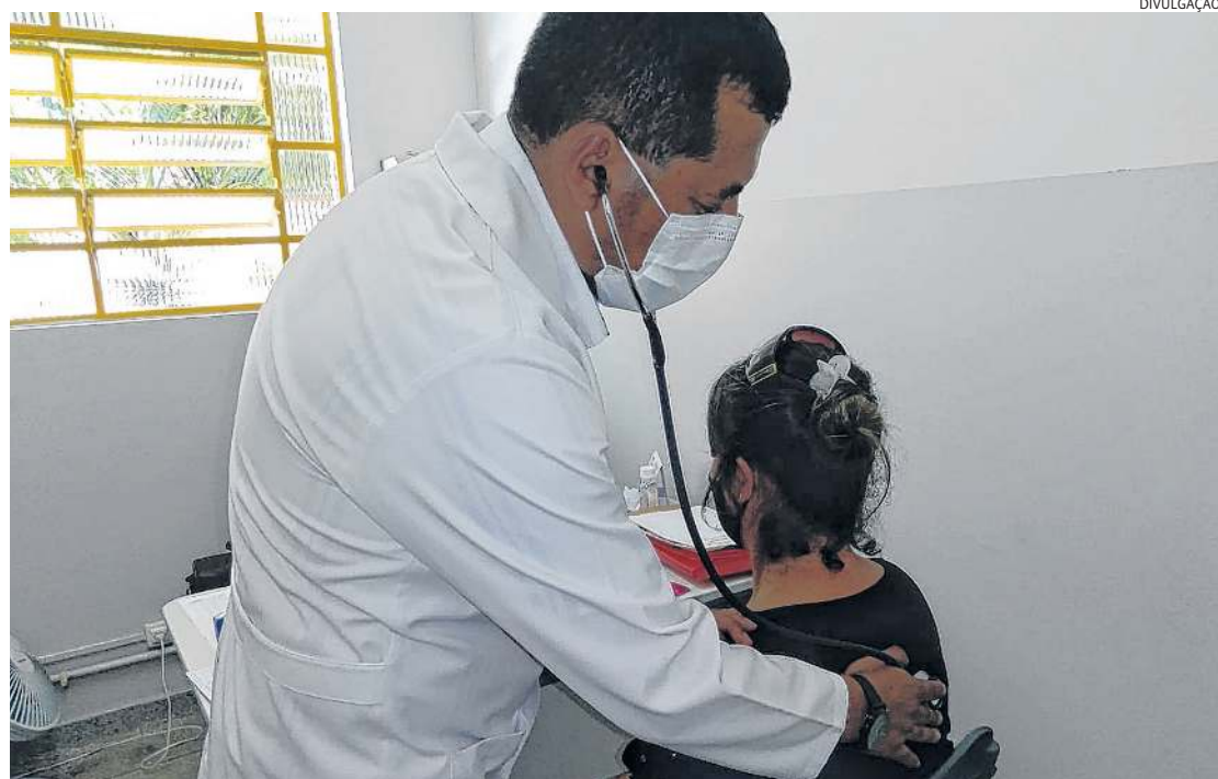
Com Avança Saúde, Várzea espera ter mais médicos para atendimento nas diversas especialidades

A previsão de início das obras é ainda no primeiro semestre de 2022 e sua conclusão deverá acontecer no final de 2024.