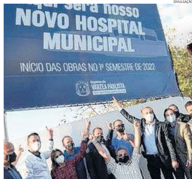
Autoridades comemoram escolha do local para o novo hospital varzino