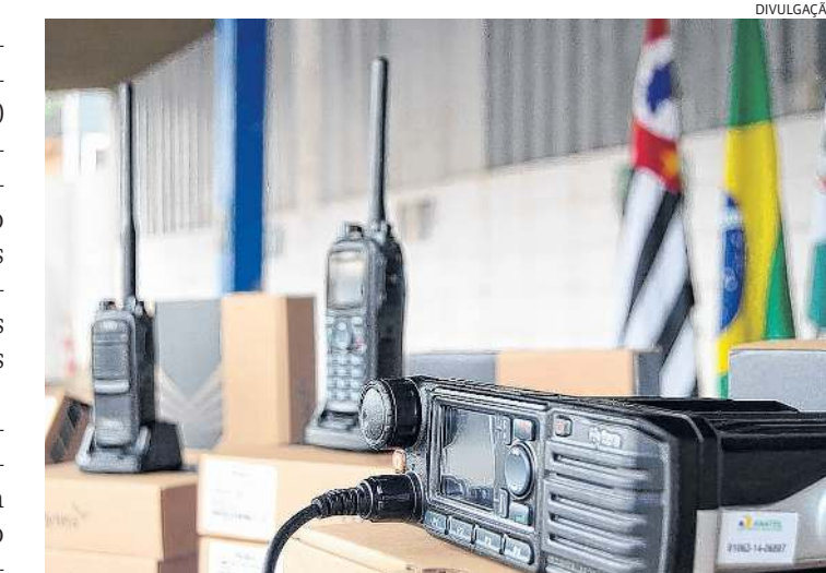
Equipamentos permitem comunicação digital para o trabalho da GCM

Estado de São Paulo. No município, quase 300 famílias são beneficiadas com o vale-gás ou SP Acolhe, do Bolsa do Povo.