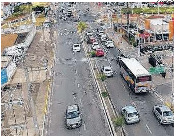
Corredor comercial de Várzea Paulista se expande, assim como parque industrial

que nossa cidade se tornasse mais atrativa a investidores e se tornasse um polo regional também.