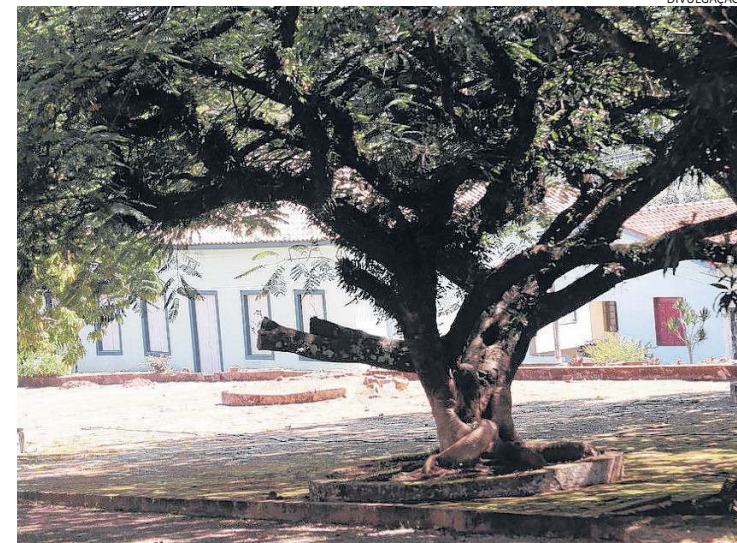
Fazenda Santo Antônio é um dos ícones da história de Louveira

Localizada na Estrada das Rainhas, no bairro Ponte Preta, a fazenda tem cerca de 250 mil metros quadrados de área