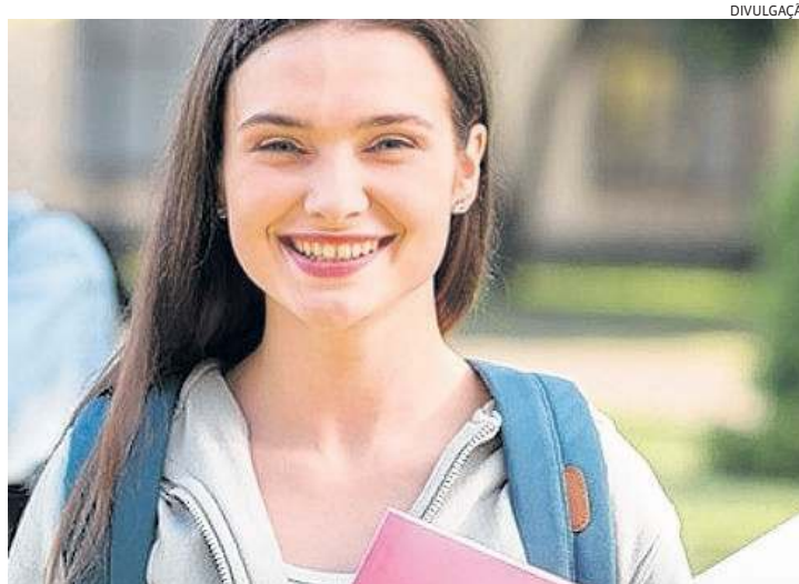
Louveira tem programas para subsidiar ensino superior e tecnológico