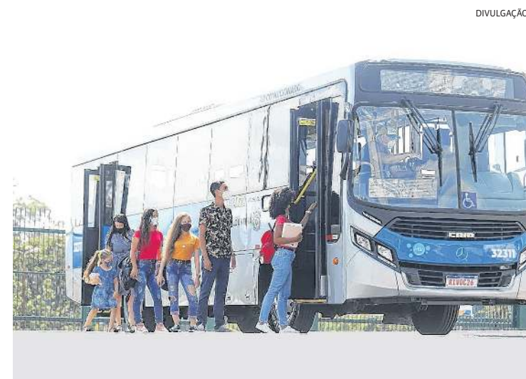
Prefeitura de Louveira passou a subsidiar passagens de ônibus

Ao diminuir o valor da tarifa cobrada aos usuários do sistema, a Prefeitura de Louveira teve como meta incentivar a utilização do transporte público, atendendo os princípios, diretrizes e objetivos da Política Nacional de Mobilidade Urbana, a Lei 12.587/2012.