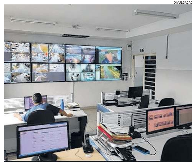
Foram instaladas câmeras dotadas de rastreamento pelo sistema OCR

As câmeras com sistema OCR ficam na avenida José Manfrim, ruas Catharina Calsavara Caldana e Atílio Biscuola, Comendador Guilherme Manfrim, avenidas José Manfrim, Nilo Traci, Silvério Finamore, Luiz Pereira dos Santos, Alexandre Biassi e Monsehor Antônio Benedito Spoladori, ruas Dez e Helaco, estradas Fazenda Conceição e Monterrey.