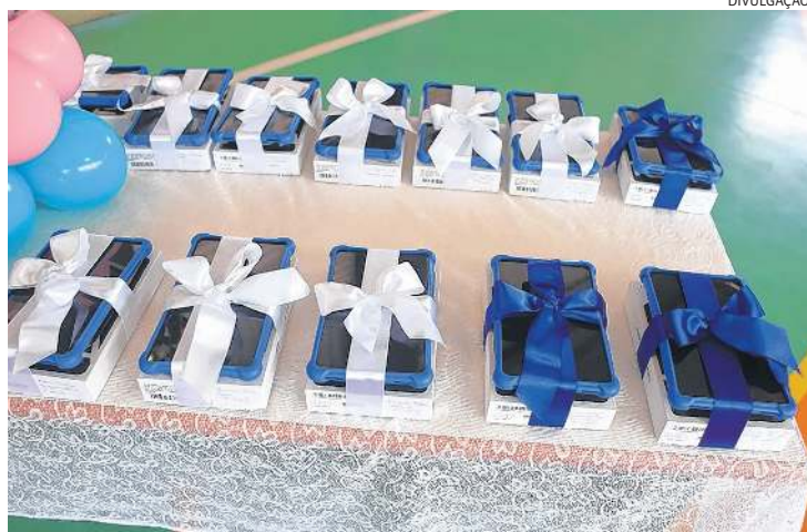
Tablets são mais um passo para acesso dos alunos a atividades remotas