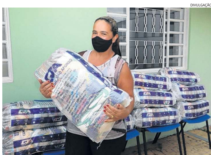
Cadastrados receberam cesta básica e cartão alimentação