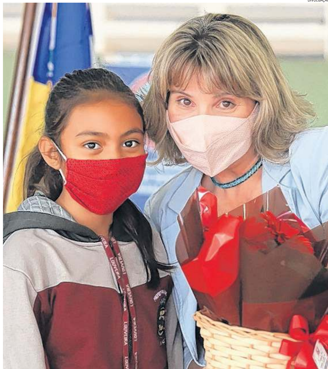
Aparelhos foram entregues aos estudantes após assinatura, pelos pais ou responsáveis, de termo de comodato

Para retirar os aparelhos, os pais ou responsáveis legais pelos alunos devem assinar um documento, chamado de Termo de Comodato. Nele, a família confirma o recebimento dos kits, aceita os termos de utilização e se responsabiliza pelos cuidados com os equipamentos, incluindo a prevenção a perdas e danos.