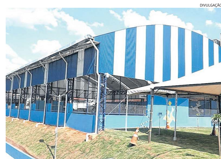
Complexo Terra da Uva é a alegria do Jardim Santo Antônio

Em breve a secretaria abrirá turmas para aulas esportivas dentro do salão multiuso.