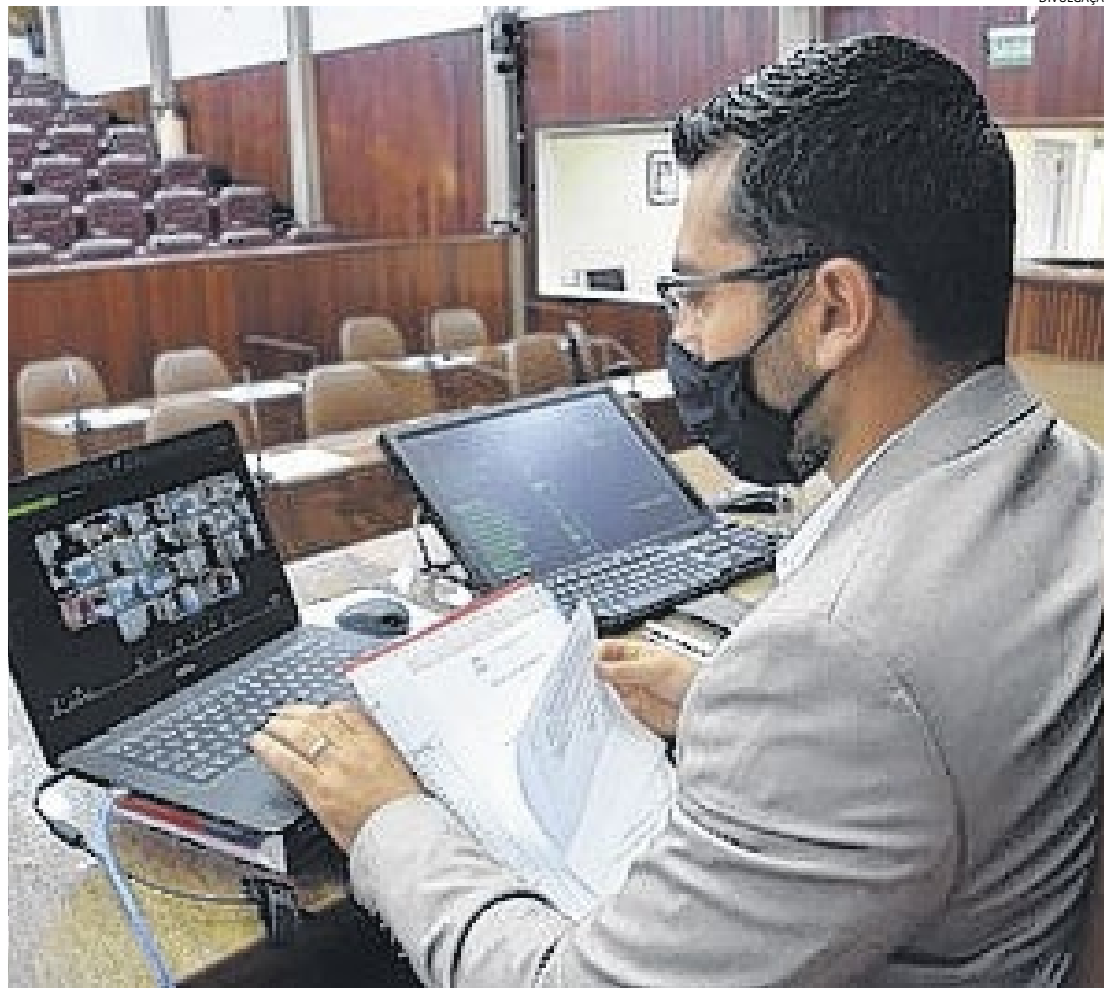
Com a suspensão das sessões presenciais, vereadores fazem as votações dos projetos de lei de maneira remota

“O plenário do Supremo Tribunal Federal (STF), em sessão realizada no dia 8 de abril, por 9 x 2, decidiu que estados e municípios podem proibir cultos e missas religiosas presenciais durante a pandemia. Com a decisão anterior de que os municípios somente poderão ser mais restritivos, e nunca mais fle-