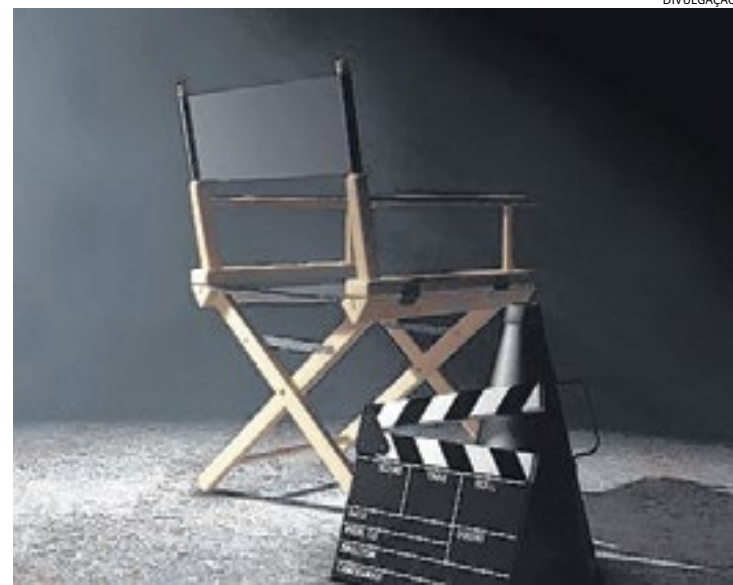
O Festival Digital Curtas Campos do Jordão de 2021 ocorre virtualmente

São 89 curtas-metragens concorrendo ao Prêmio Araucária de Cinema do Festival Digital Curta Campos do Jordão, selecionados entre os 564 inscritos de todo o Brasil. 23 curtas disputam a categoria Ficção; 19 estão na Experimental; 18 filmes em Animação; 15 em Documentário; 10 na Regional; e 4 na categoria na Infantil. Os vencedores em cada cate-