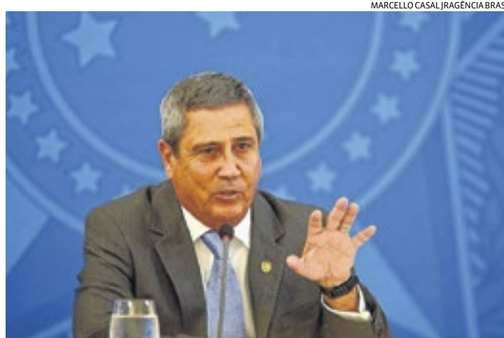
O ministro Braga Netto falou sobre a instauração da CPI da covid-19

A fala do ministro ocorreu durante solenidade de transmissão do comando do Exército, em Brasília. O general Edson Pujol passou o posto para o também general Paulo Sérgio