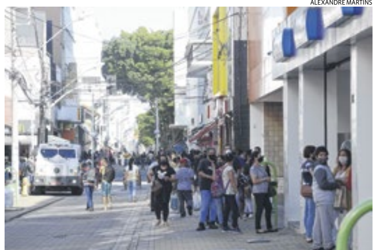
As lojas do Centro e dos shoppings abrem hoje, feriado de Tiradentes