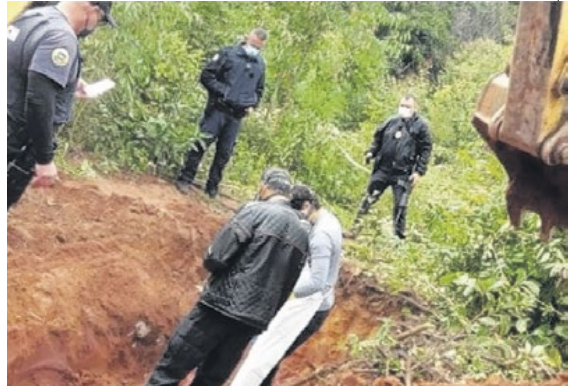
Ossos de pelo menos cinco pessoas são desenterrados em Jarinu após um trabalhador encontrá-los