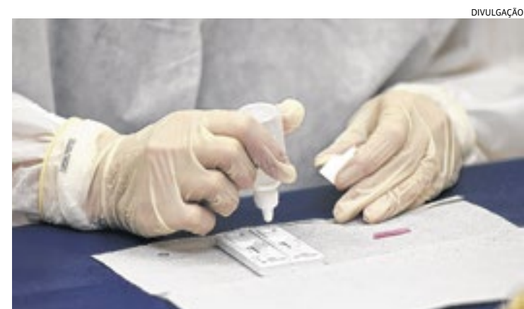
Dos 999 óbitos, 584 eram homens e 415 mulheres entre 15 e 109 anos

De acordo com o boletim divulgado pela Prefeitura de Jundiaí nesta terça (20), após 72 dias, nenhuma morte por covid foi confirmada. Ainda segundo o boletim, 170 novos casos foram confirmados. Até o momento, a cidade registra 35.096 casos confirmados, 658 casos ativos, 33.439 recuperados e 81.466 vacinados desde o início da pandemia. (Mariana Checoni)