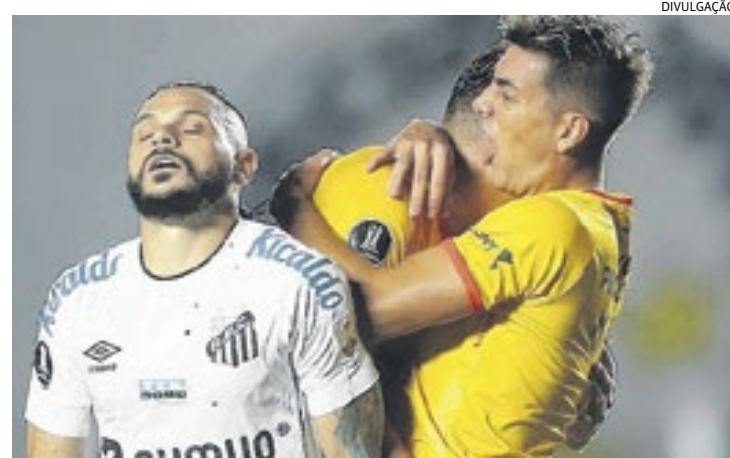
O lateral Pará foi um dos destaques negativos do Santos na partida