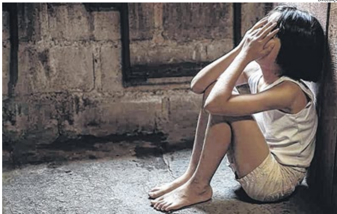
O Ministério Público explica que o olhar dos professores permite identificar os sinais iniciais do abuso

A Unidade de Gestão de Promoção da Saúde (UGPS) informa, em nota oficial, que o município conta com 172 agentes comunitários de saúde. Das 35 Unidades Básicas de Saúde (UBSs), 18 contam com os agen-