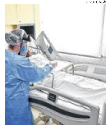
A adequação foi necessária depois da redução de demanda

para atendimento não-covid-19 será dedicada para a demanda geral dos demais serviços.