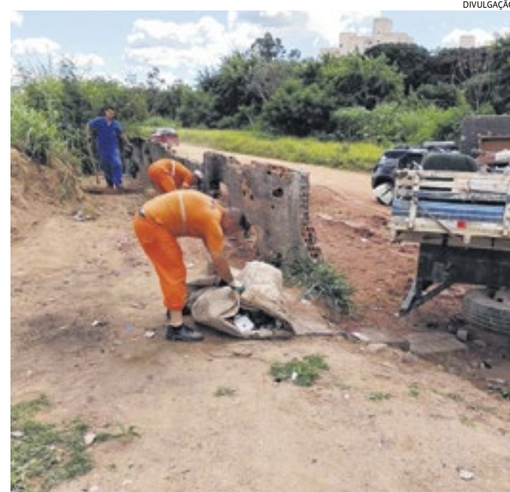
Foram localizados 2 quilos de drogas escondidos nos entulhos

Para vasculhar as casas de madeira e papelão foi acionado o Canil da GMJ,