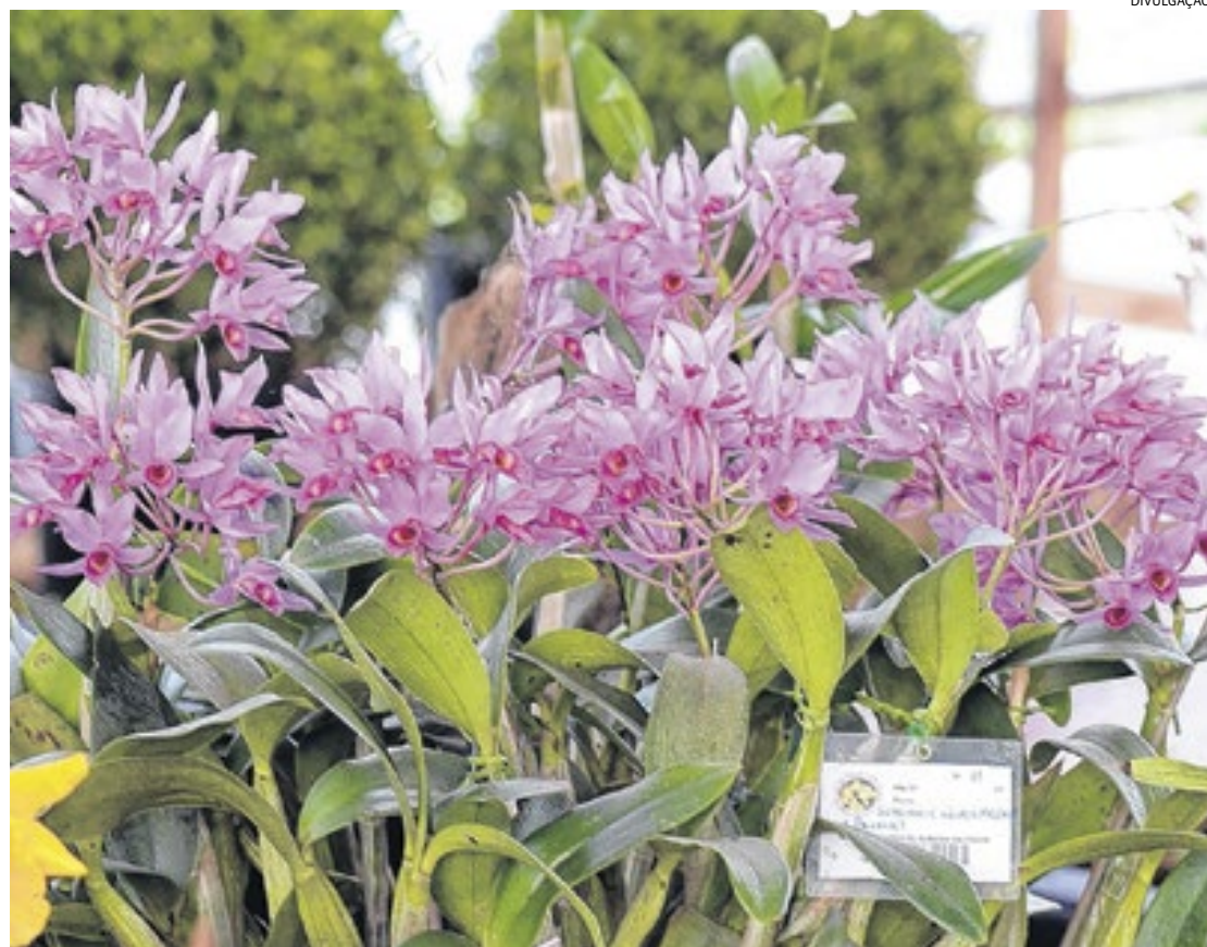
Conhecida como 'Cidade das Orquídeas', Várzea Paulista tem vasta produção de flores ornamentais

Temos boa relação, tanto com o governo federal quanto estadual. Temos recebido apoio do Governo do Estado quanto a possível aquisição de novos leitos de retaguarda e estamos seguindo as orientações que vêm do Ministério da Saúde quanto à imunização de nossa população.