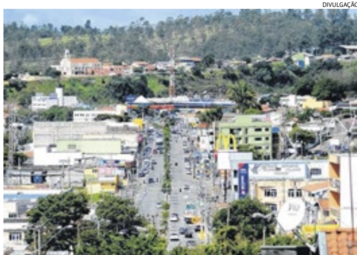
O comércio de Várzea Paulista se consolidou na última década

História de Várzea Paulista começa em 1867, quando os ingleses construíram a estrada de ferro que liga Santos a Jundiaí. A estrada passava por uma várzea campestre, com um saliente acidente