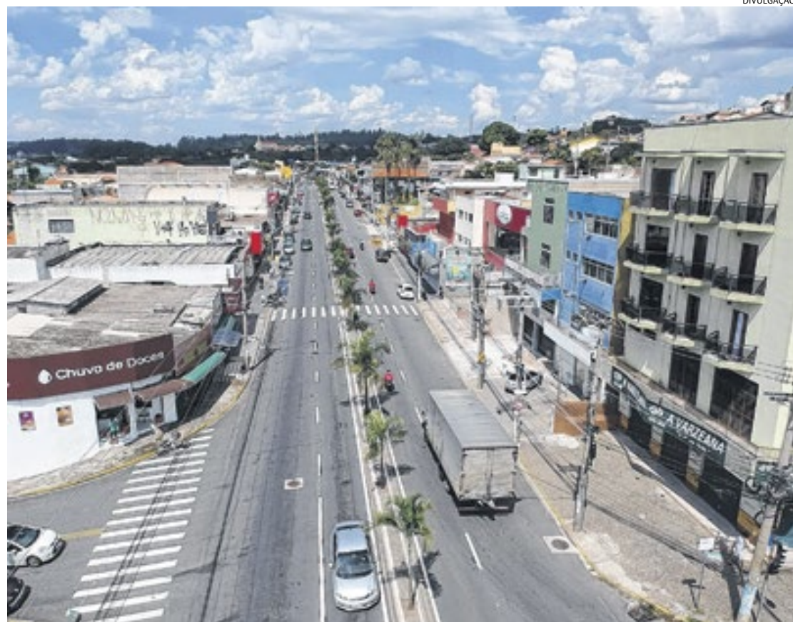
A cidade vem crescendo na sua infraestrutura viária no Centro e nos bairros, com investimentos