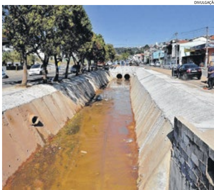
O Córrego do Bertioiga recebeu investimentos e hoje é cartão-postal

A empresa franco-italo-suíça Societé des Distilheiries Brasiennes instalou uma destilaria de álcool em terras varzinas e viveu tempos prósperos até 1888, quando finalmente foi abolida a escravi-