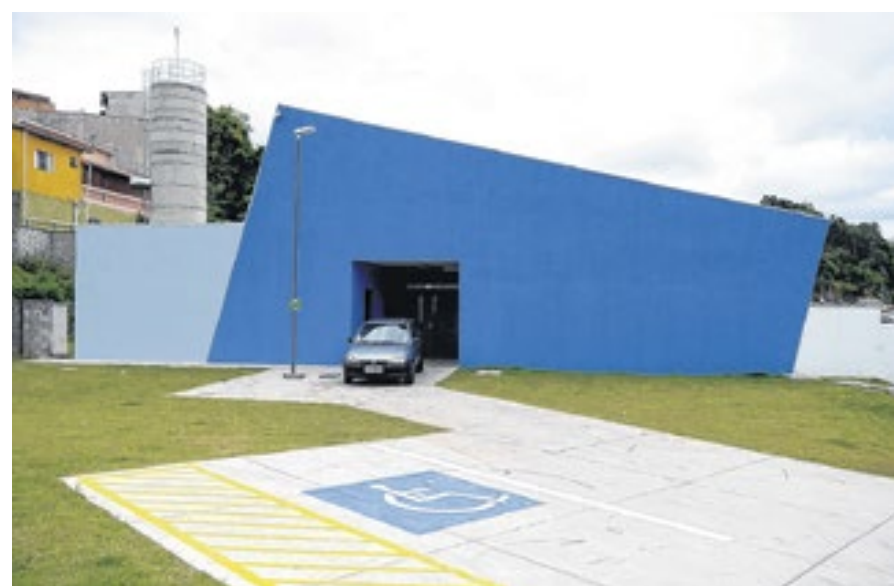
Educação vai criar a Escola do Futuro, com tecnologia e inovação e acesso remoto

Compromisso de campanha do atual prefeito, a obra deve ter seu projeto executivo definido ainda nesse ano de 2021, segundo a assessoria de imprensa da Prefeitura.