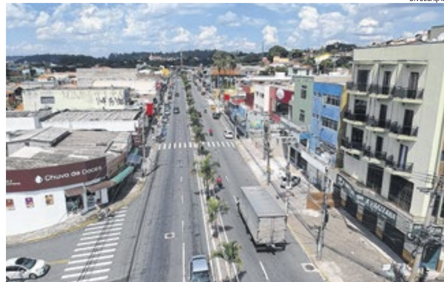
A cidade vem crescendo na infraestrutura viária no Centro e nos bairros, com investimentos