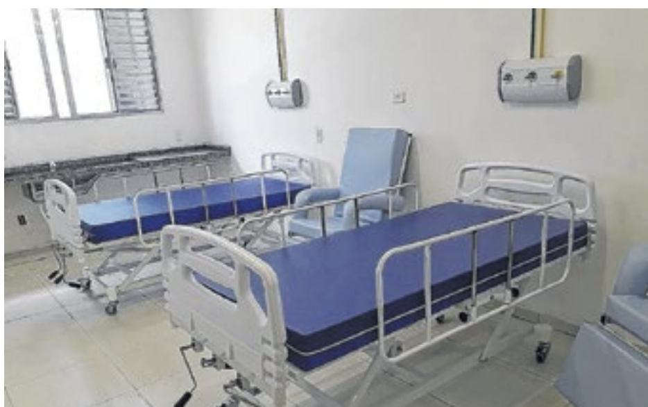
Várzea Paulista já tem um hospital, mas planeja construir outro, de maior porte