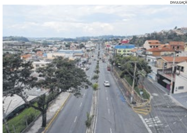
A infraestrutura viária foi ampliada, melhorando a mobilidade urbana

ção. Em 1891 foi inaugurada a Estação Ferroviária, com arquitetura e materiais ingleses.