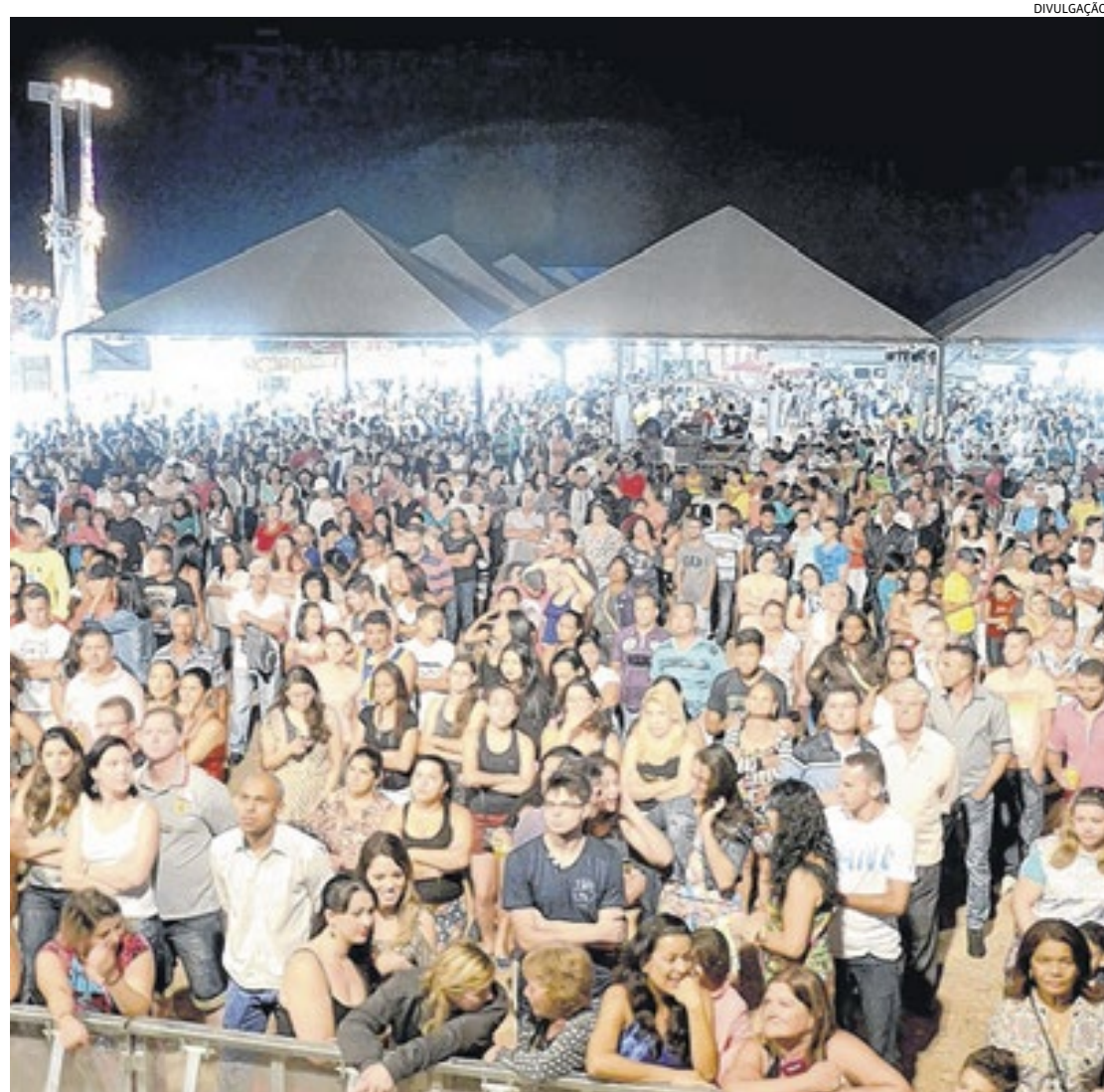
O Orquídeas é o maior evento da cidade, com shows e praça de alimentação, atraindo milhares de pessoas

@PJCONTABILIDADE / WWW.PJCONTABILIDADE.COM.BR