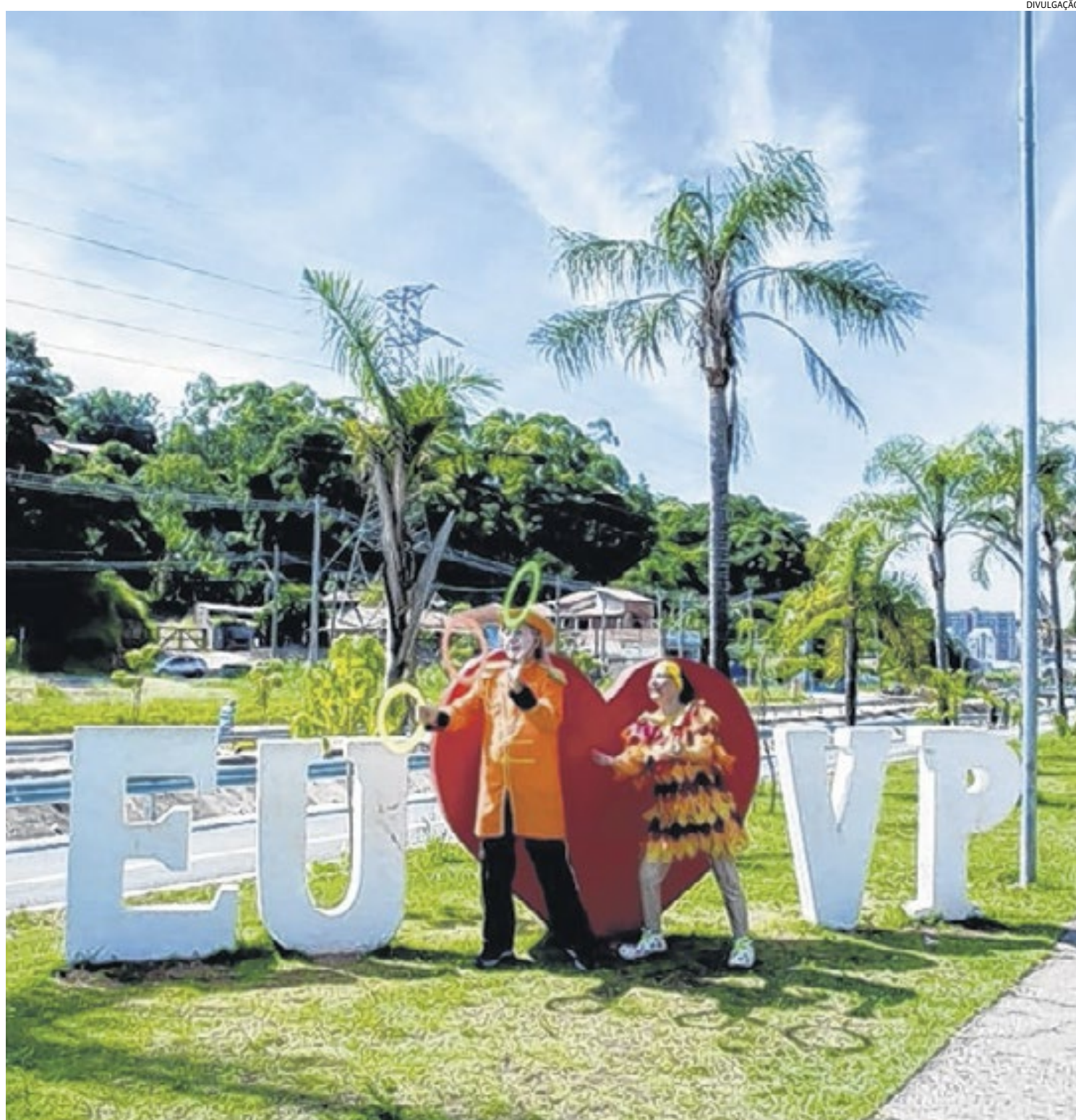
Ao todo, serão 400 profissionais beneficiados direta e indiretamente com lei de incentivo cultural no valor de R$ 834 mil, após processo de avaliação