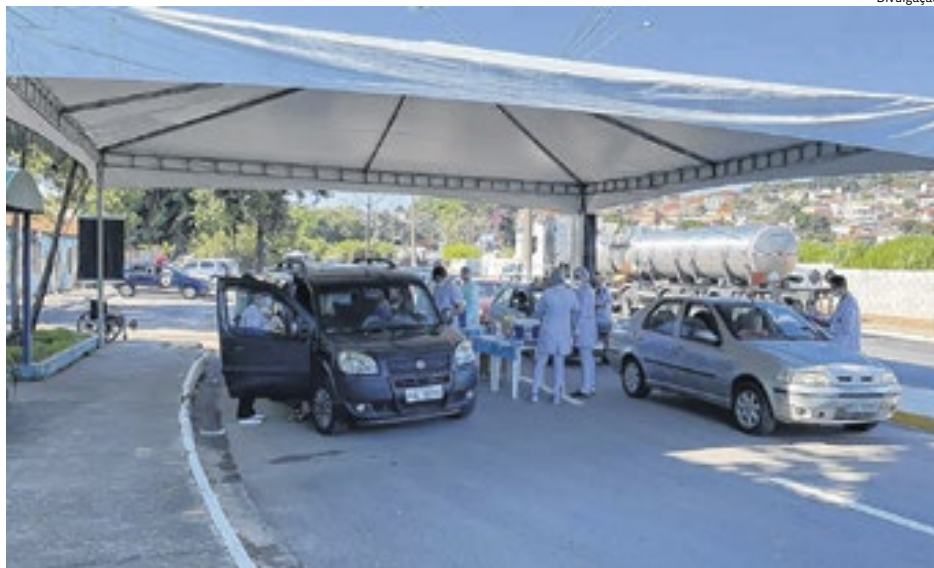
A vacinação drive-thru é uma das prioridades em Várzea Paulista

A construção do novo hospital é o maior desafio da cidade para os próximos anos.