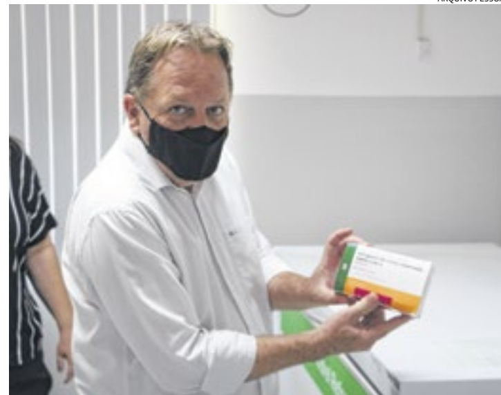
O prefeito Estanislau Steck está atento às medidas necessárias

A abertura do hospital acontece em meio a uma segunda onda que preocupa as autoridades de saúde e fez aumentar novamente o número de casos da doença. O Hospital fica na avenida Arhur de Souza Sygel, 400, no Jardim Vera Cruz.