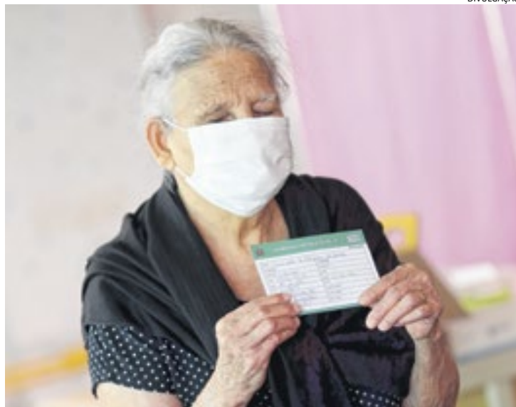
Campanha de vacinação contra o coronavírus segue na cidade

Além disso, a localização do Hospital de Campanha é estratégica. Ao lado de Santa Casa, ele permite transferência imediata de pacientes que tenham casos agravados ou que preci-