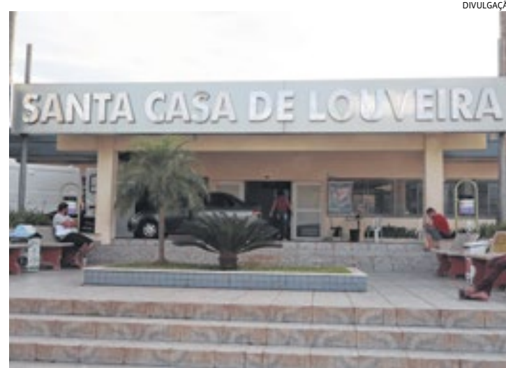
A Santa Casa possui cinco leitos de UTI e cinco leitos à covid