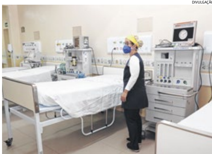
A Santa Casa de Louveira criou mais cinco leitos para atendimento

sem de atendimento mais complexo, como nos casos de UTI.