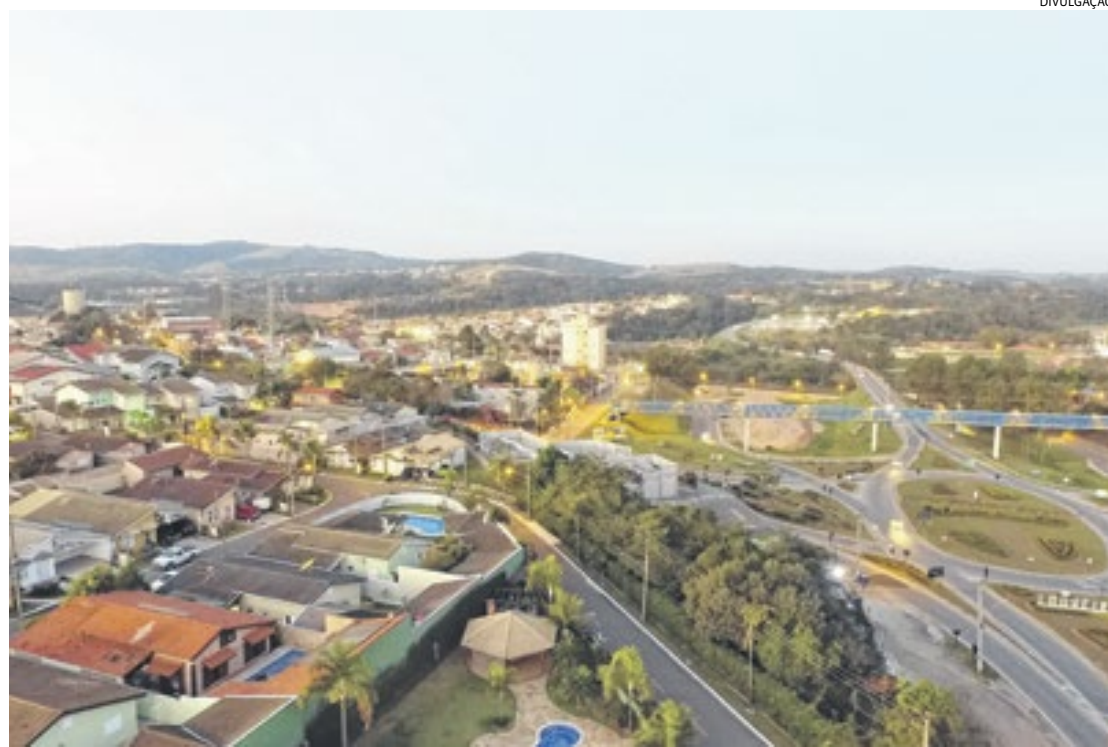
Louveira é sede de grandes indústrias e empresas de logística mundiais, com uma das maiores receitas do estado

Falo que Louveira não cresceu: ela inchou! Não houve planejamento, não houve um Plano Diretor que realmente coordenasse o crescimento da cidade e atualmente 80% de nosso orçamento vem de repasse do valor adicionado de ICMS de empresas que aqui produzem ou fazem logística. Desta forma, precisamos criar condições de mobilidade para carretas e caminhões circularem com rapidez e segurança por nossas ruas e estradas, interagindo com carros, motos, bicicletas e pedestres de maneira harmônica. É um trabalho que exige muito recurso, competência política e técnica, pois dependemos de Artesp, DER, CCR Autoban E Rota das Bandeiras, além dos governos estadual e federal para executarmos nosso tão sonhado anel viário municipal.