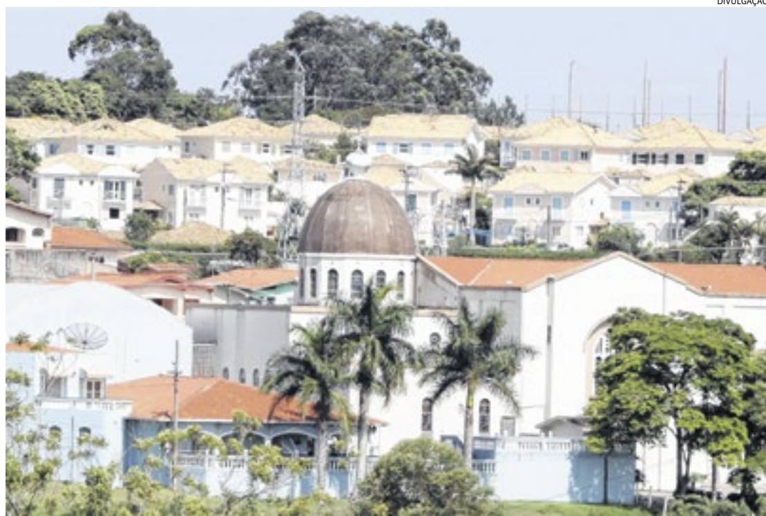
Louveira vai investir em turismo, com preservação histórica e ambiental, que atrai visitantes de duas rodas